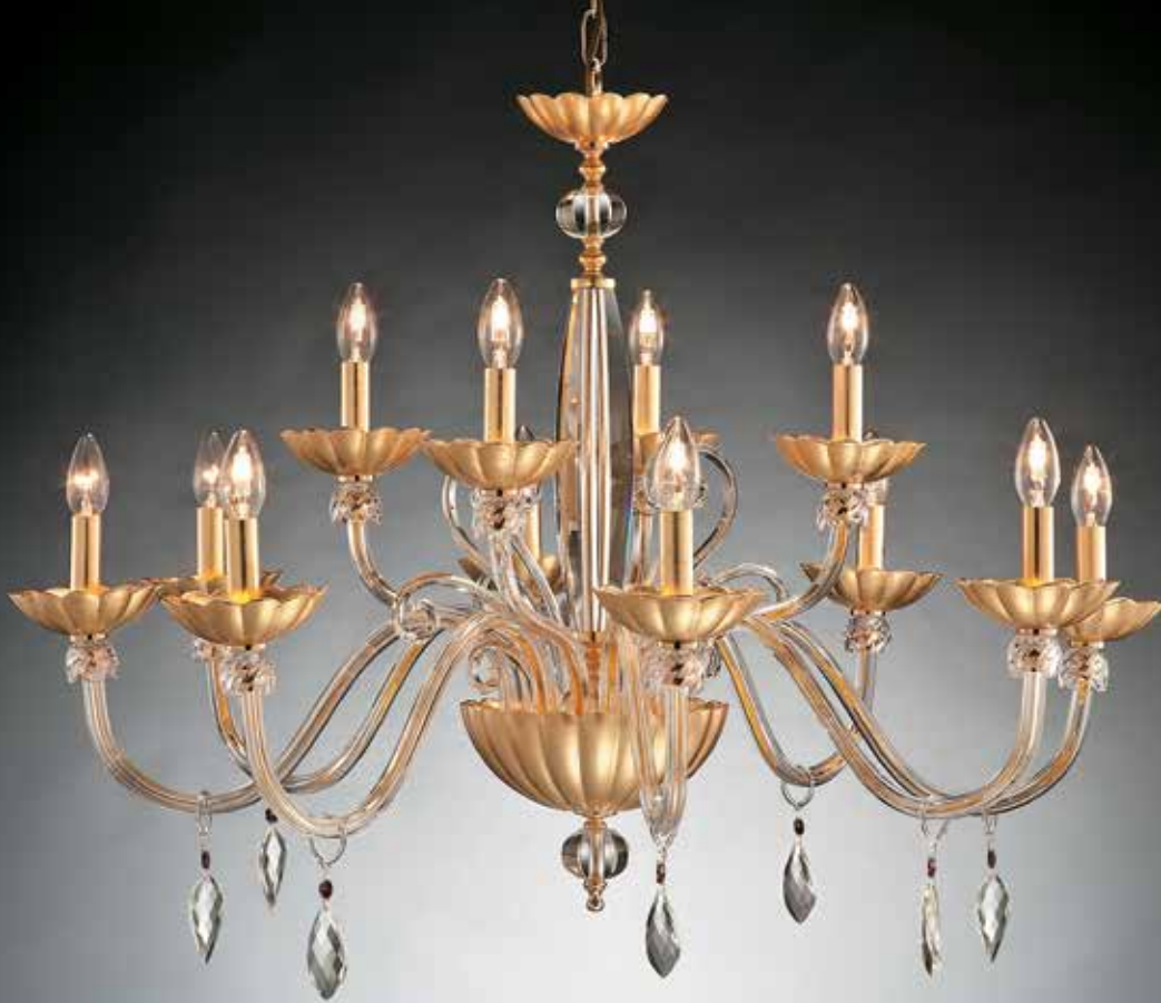
Guenda/12 foglia oro Ø 95 H 80