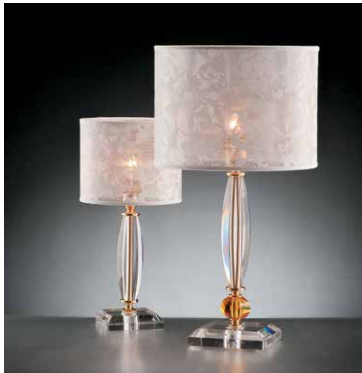
Eleonora/LG oro NB ø 30 H 55 Eleonora/LP oro NB ø 20 H 41