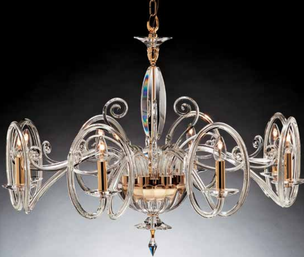
Eracle/8 oro ø 90 H 70