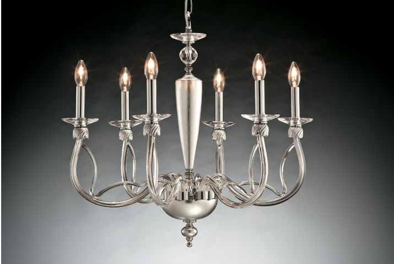
Flaminia/6 foglia argento ø 70 H 65 disponibile foglia oro