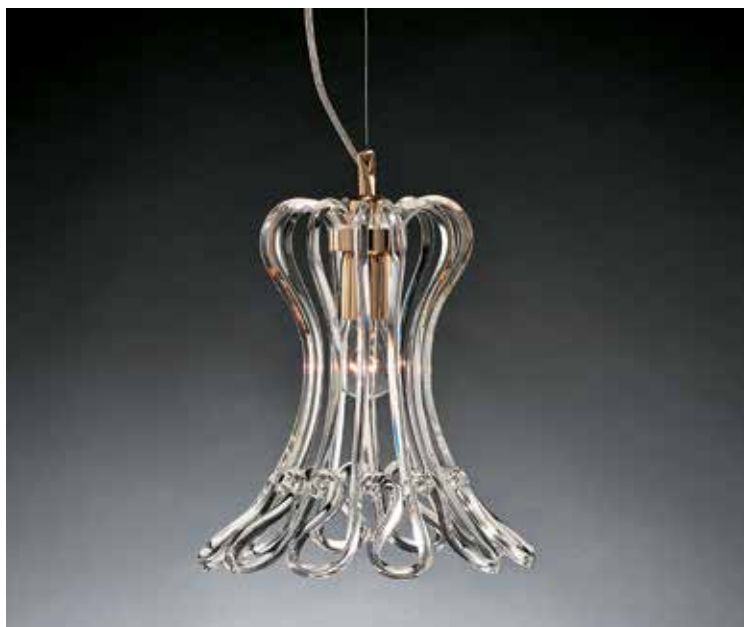
Susette/S oro Ø 35 H 30 disponibile cromo