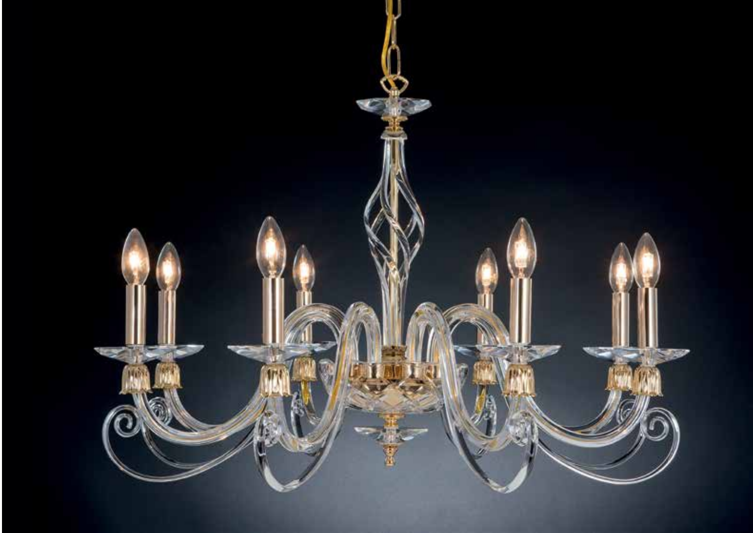
Ares/8 oro ø 80 H 55 disponibile cromo