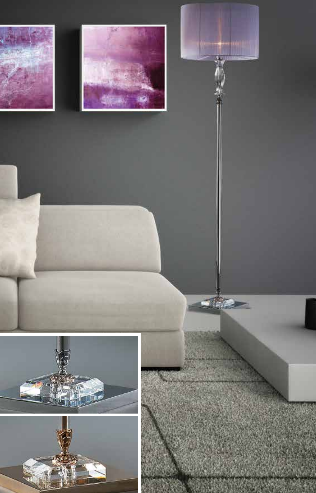
Sinuosa/PT cromo CFAO lilla Ø 45 H 178