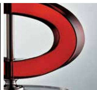
Ellisse/LG CFAO - ametista ø 30 H 49 Ellisse/LP CFAO - ametista ø 20 H 38