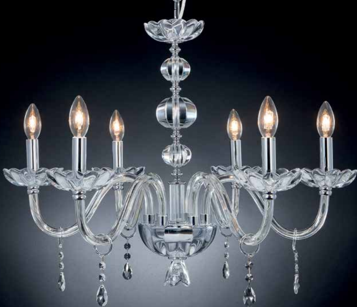
Zeus/6 cromo ø 70 H 55 disponibile oro