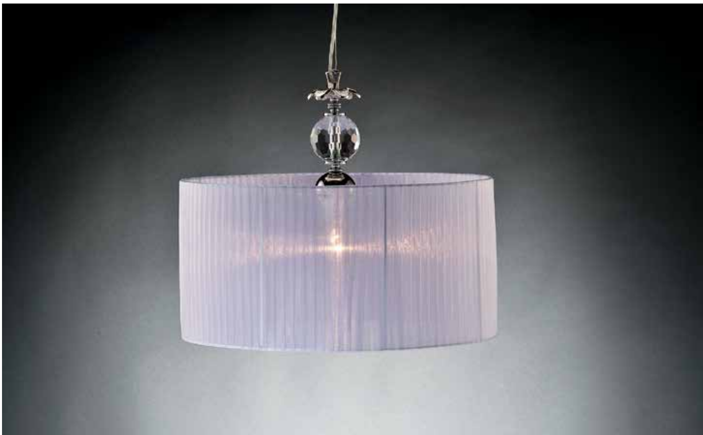
Cathy/S50 lilla Ø 50 H45