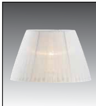
IFAO finitura bianco avorio nero oro glicine