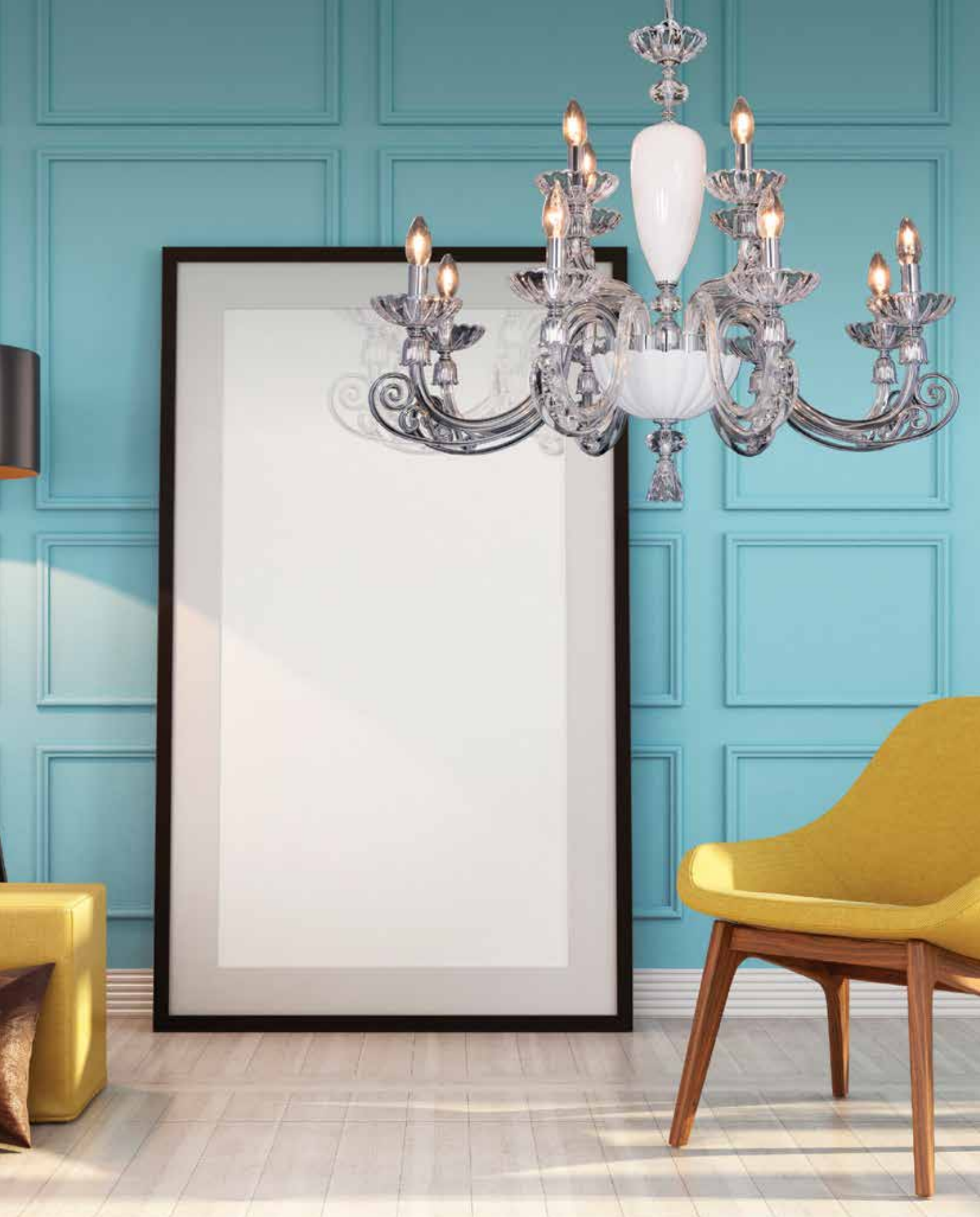
Sofia/8+4 cromo bianco Ø 90 H 75 disponibile oro, ambra