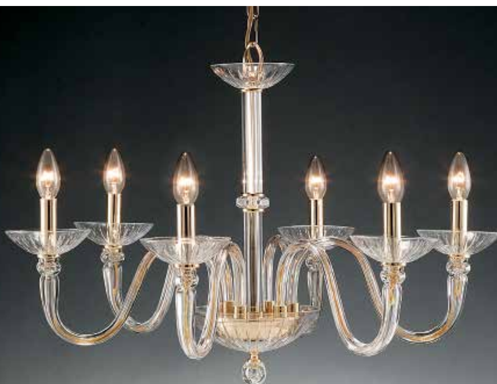
Matisse/6 oro ø 75 H 55 disponibile cromo