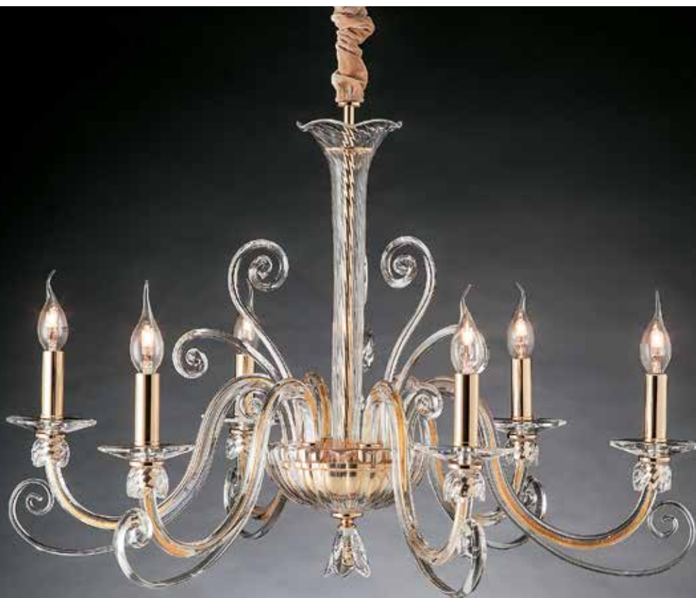
Astrid/6 oro ø 85 H 55 disponibile cromo