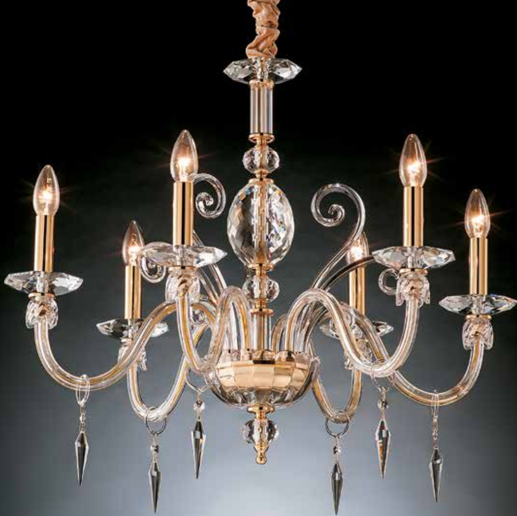
Elvira/6 oro ø 68 H 65 disponibile cromo