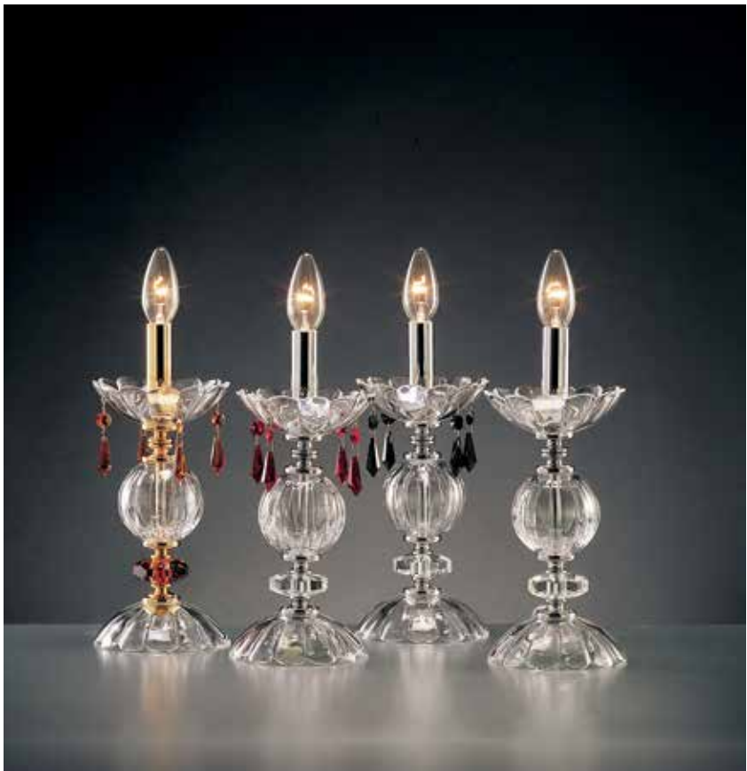
Rossella/L1 ø 13 H 31 Rosita/L1 ø 13 H 31