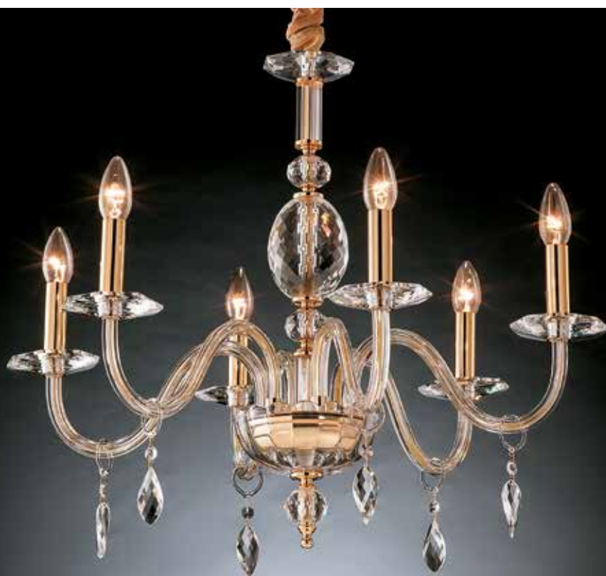
Susanna/6 oro ø 68 H 65 disponibile cromo