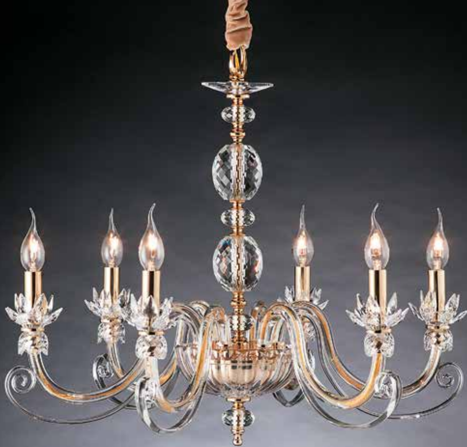
Rosetta/6 oro ø 70 H 60 disponibile cromo