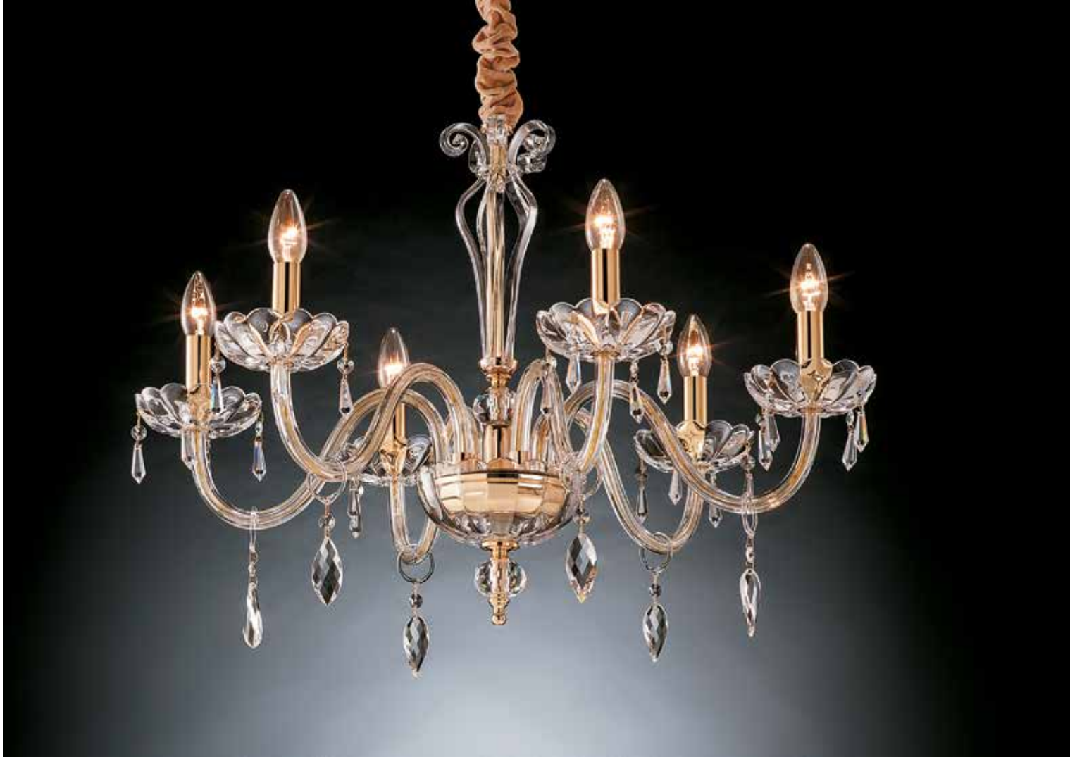
Matilde/6 oro ø 68 H 55 disponibile cromo