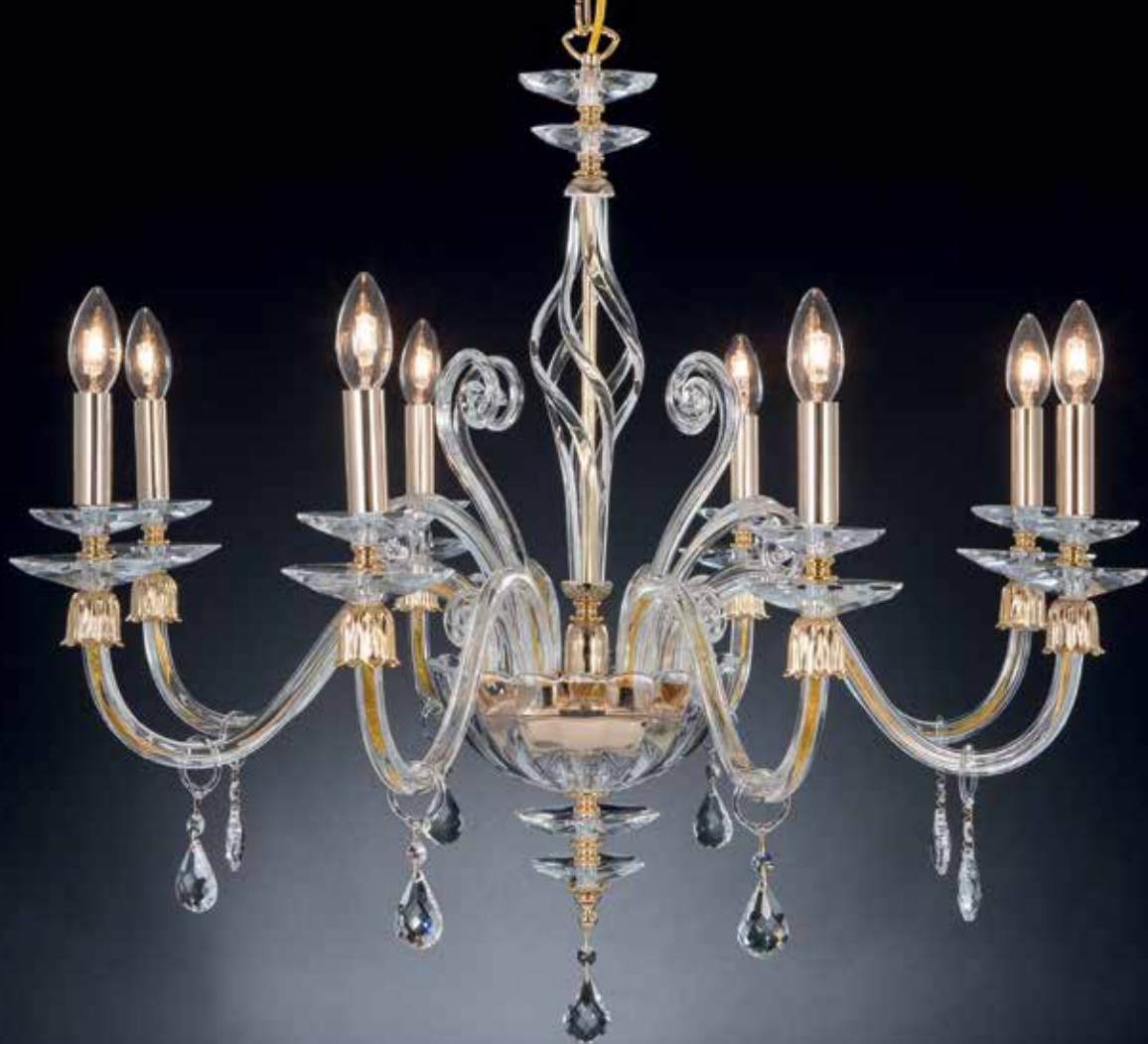
Perkele/8 oro ø 85 H 75 disponibile cromo