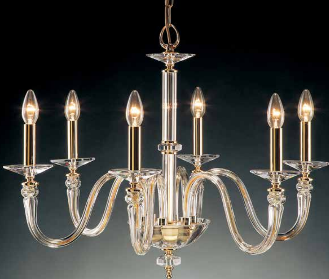
Patrizia/6 oro ø 75 H 70 disponibile cromo