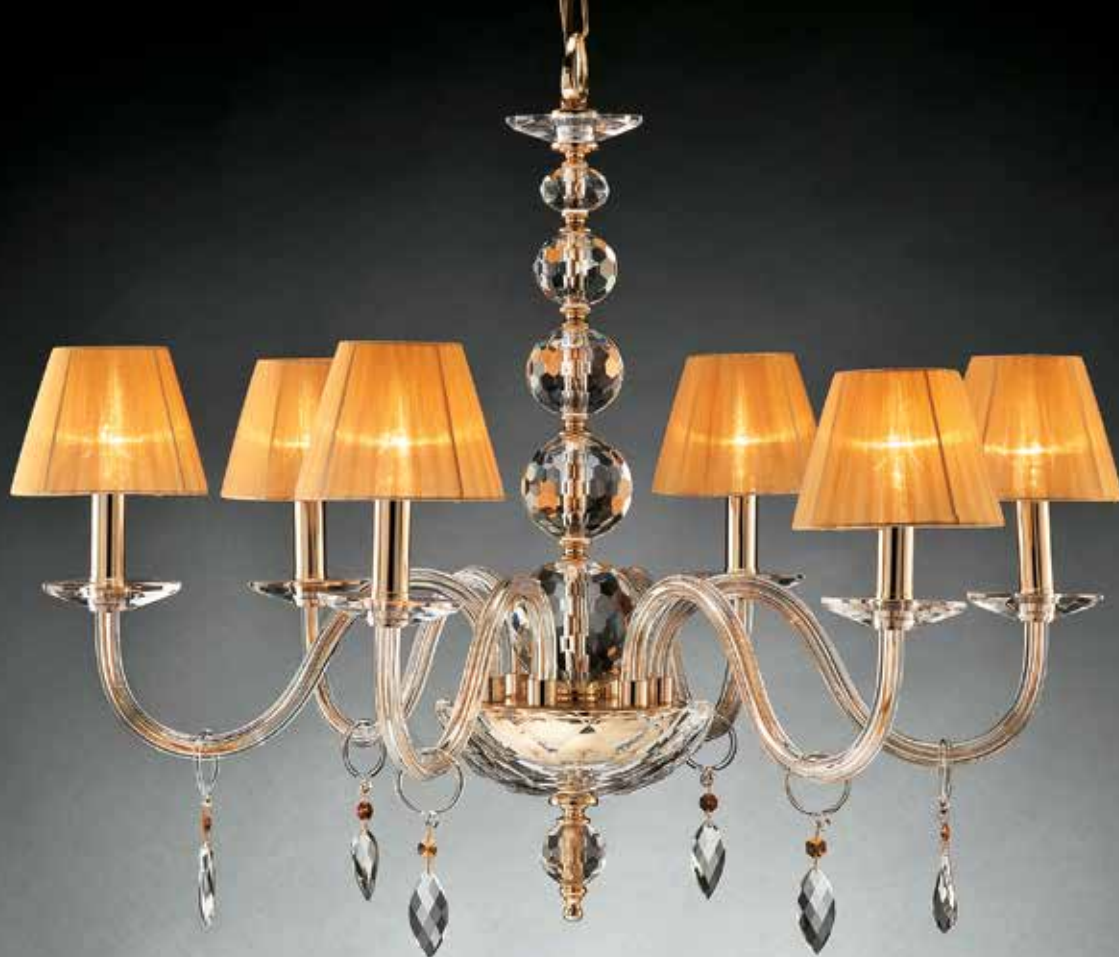
Elena/6 con paralume IFAO oro ø 83 H65 disponibile cromo