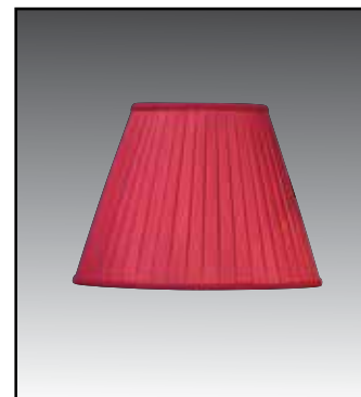
T CONO finitura bordeaux bianco avorio tabacco