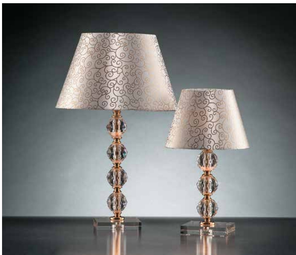
Prisma/LG oro GALLO ø 30 H 47 Prisma/LP oro GALLO ø 20 H 38 disponibile cromo