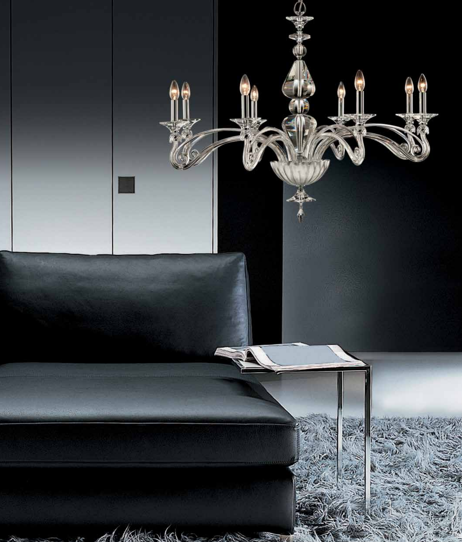
Alessandra/8 foglia argento ø 110 H 80 disponibile oro