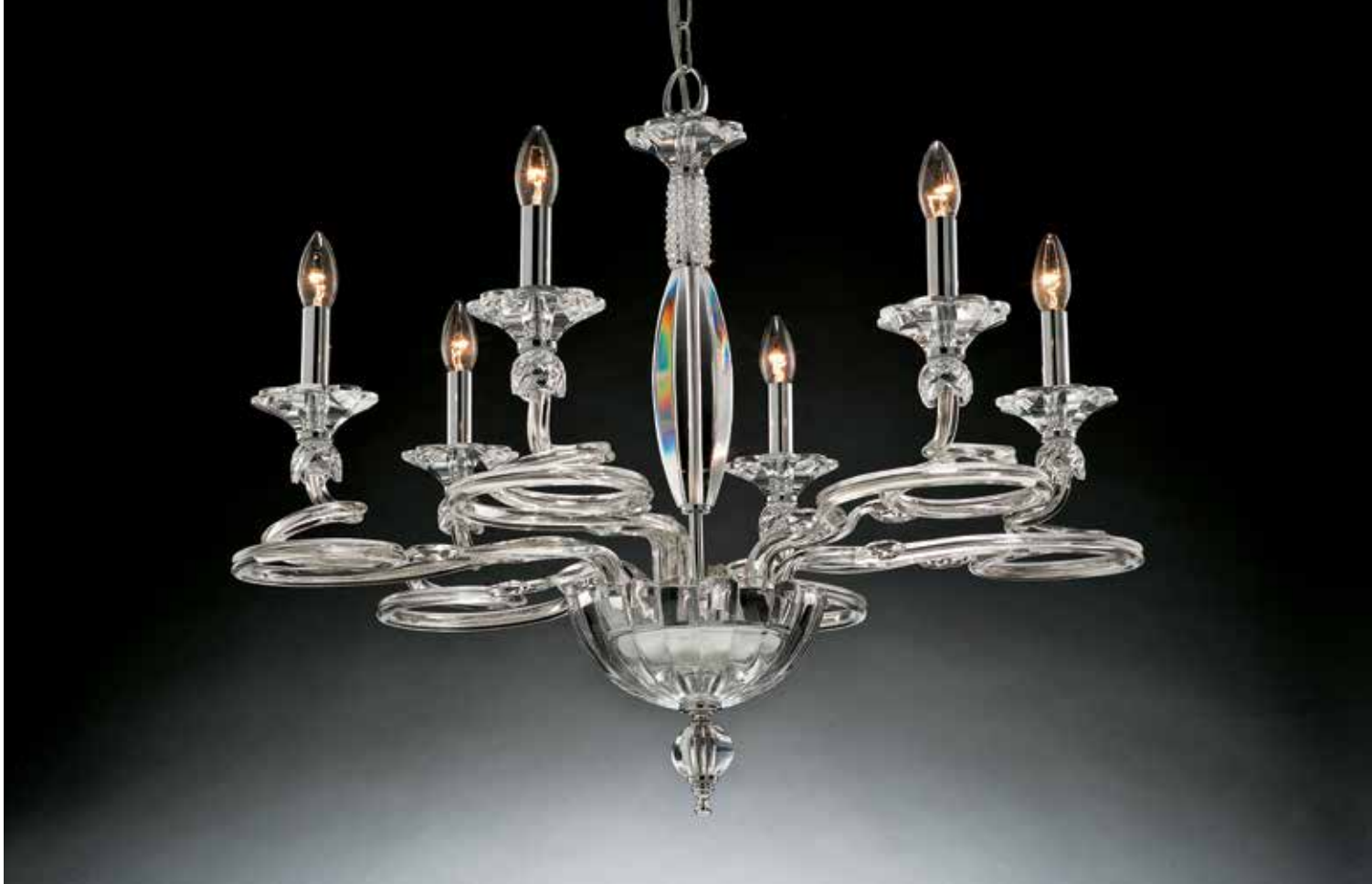
Siria/6 cromo ø 75 H 65 disponibile oro