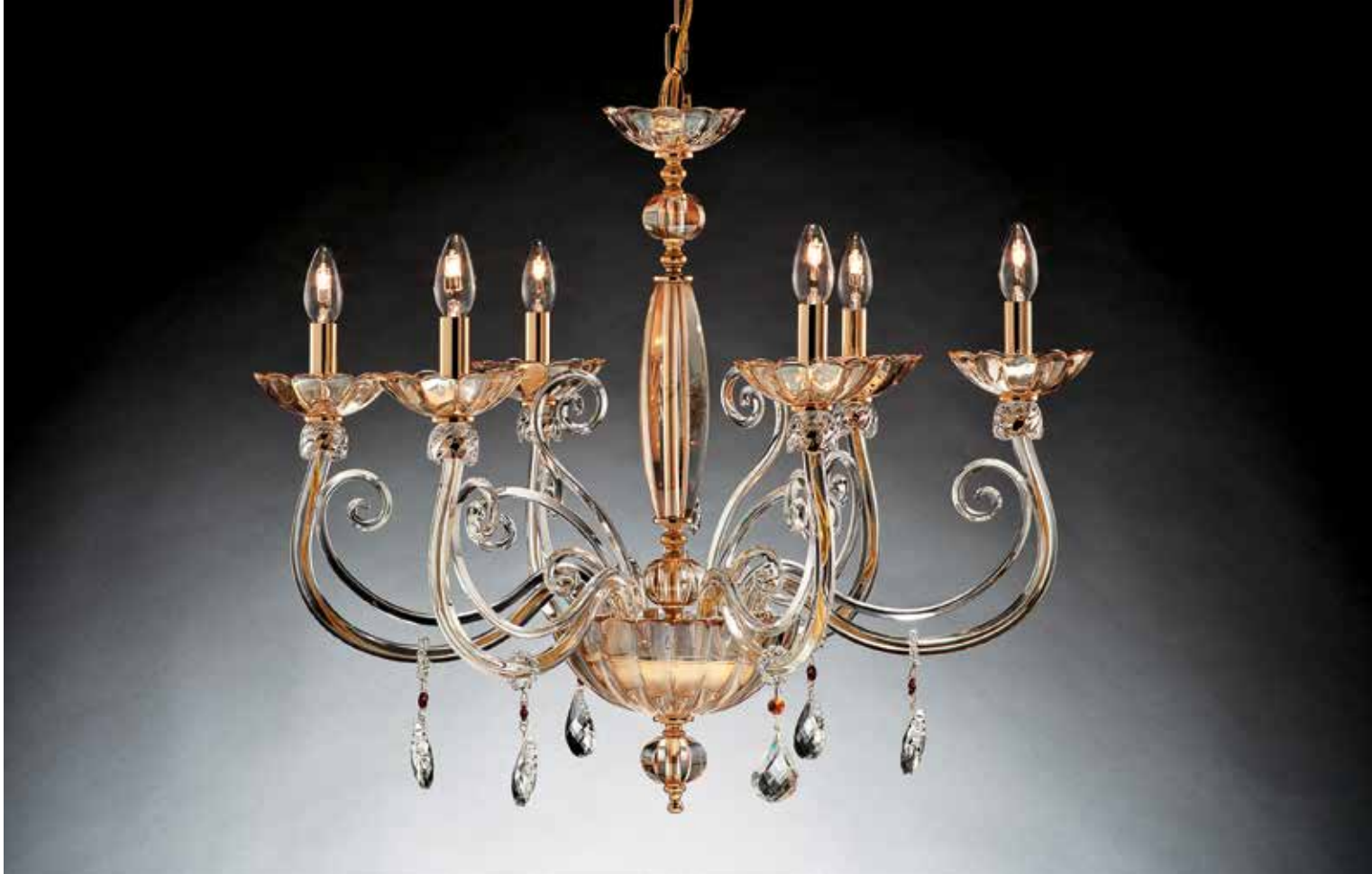
Andrea/6 ambra ø 75 H 65 disponibile cristallo, oro/cromo