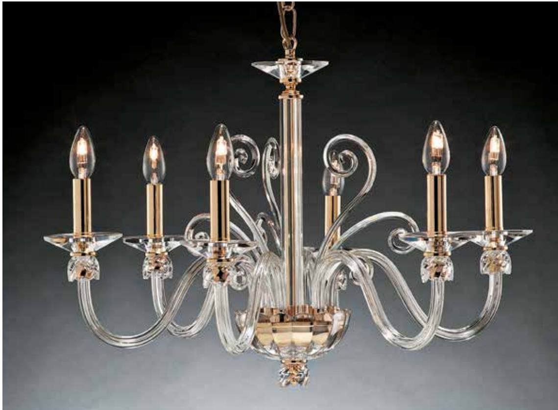
Fabiola/6 oro ø 70 H 50 disponibile cromo