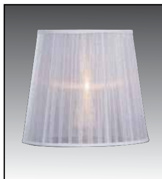
FAS finitura bianco oro