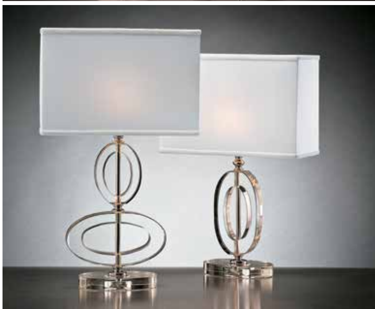
Ovada - cristallo