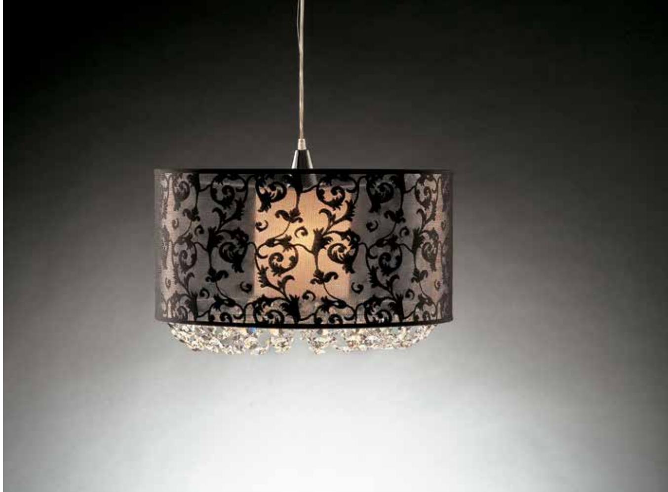
Anastasia/S50 nero ø 50 H 35