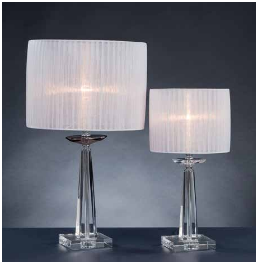
Marò/LG cromo fumè Ø 30 H 52 Marò/LP cromo cristallo Ø 20 H 40 disponibile oro