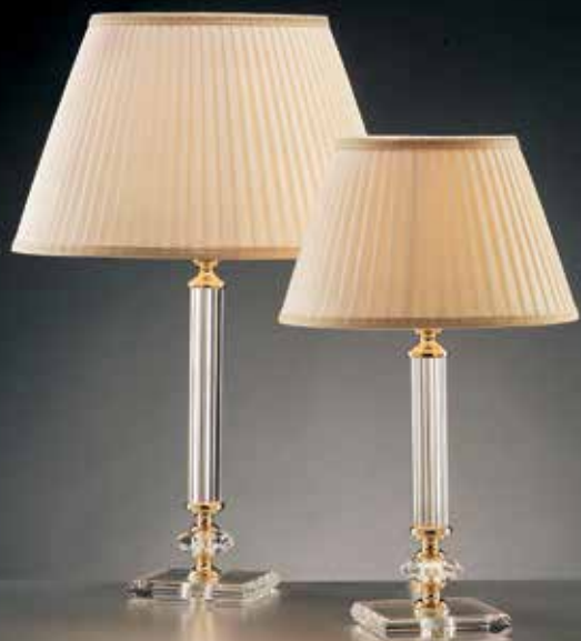
Patrizia/LG oro IFA ø 37 H 54 Patrizia/LP oro IFA ø 25 H 42