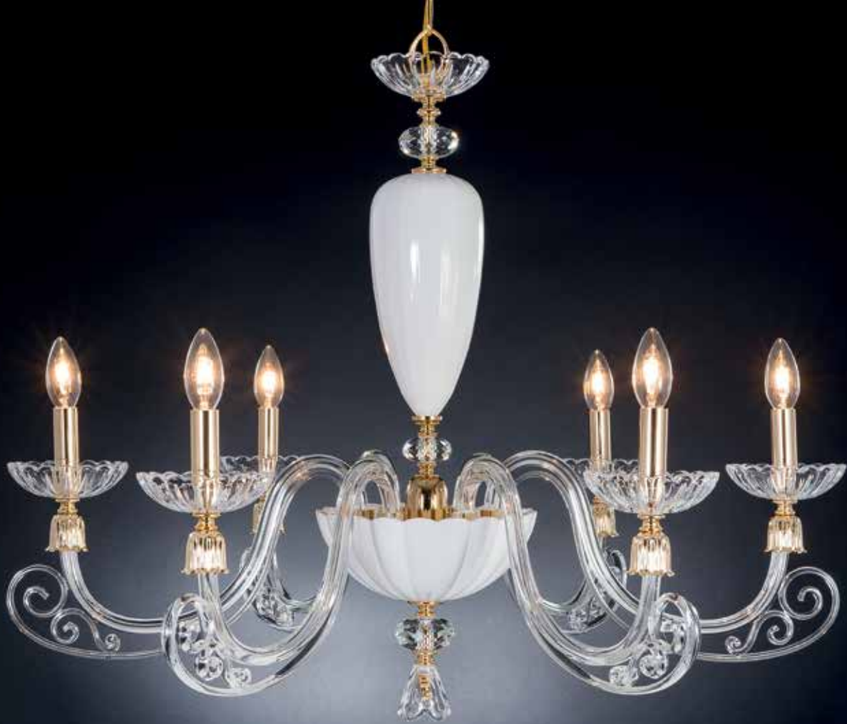
Sofia/6 bianco oro Ø 85 H 65 disponibile cromo