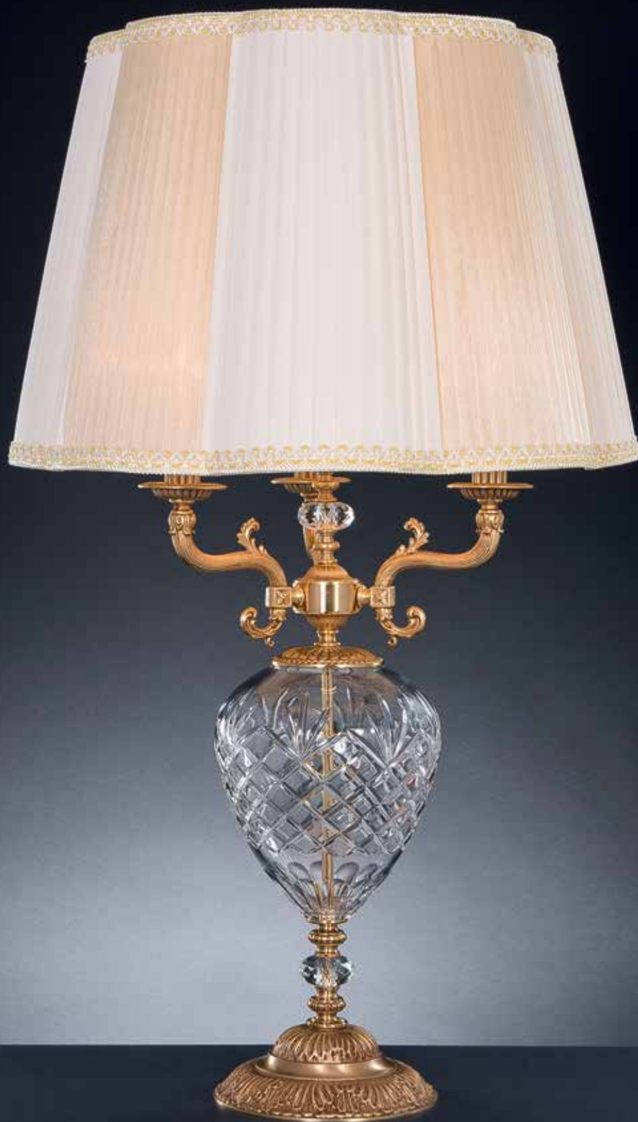
Stromboli/LG oro francese satinato ø 55 H 92