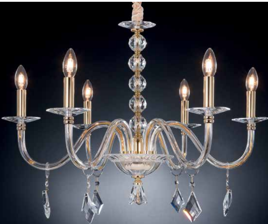
Prisma/6 Bis oro ø 75 H 55 disponibile cromo