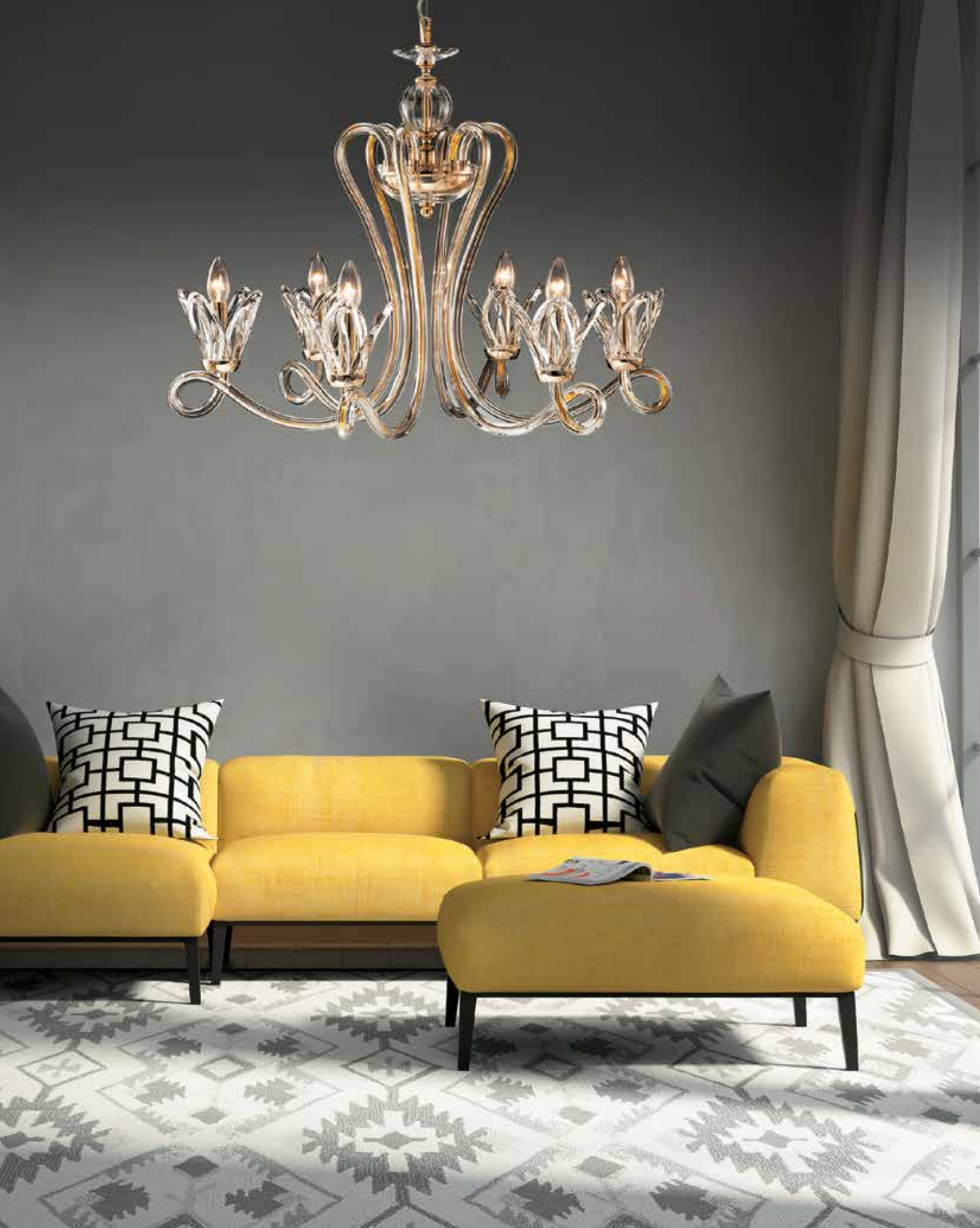
Marcella/6 oro ø 75 H 60 disponibile cromo