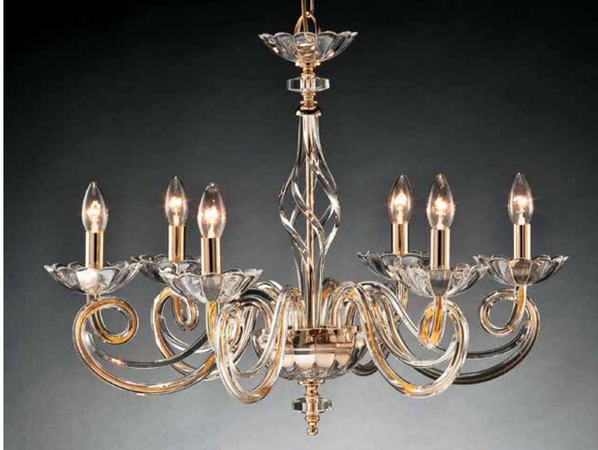
Adele/6 oro ø 70 H 56 disponibile cromo