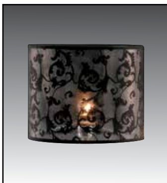
NORMANDIA finitura NN = nero NB = bianco