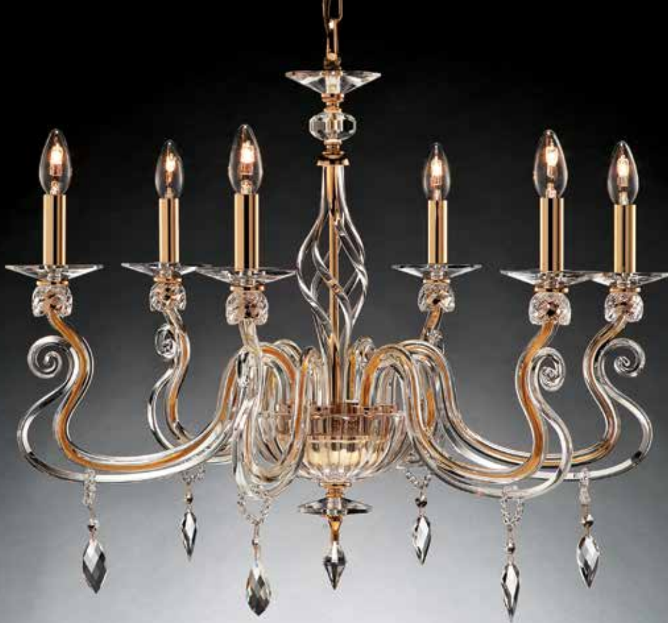
Maura/6 oro ø 85 H 70 disponibile cromo