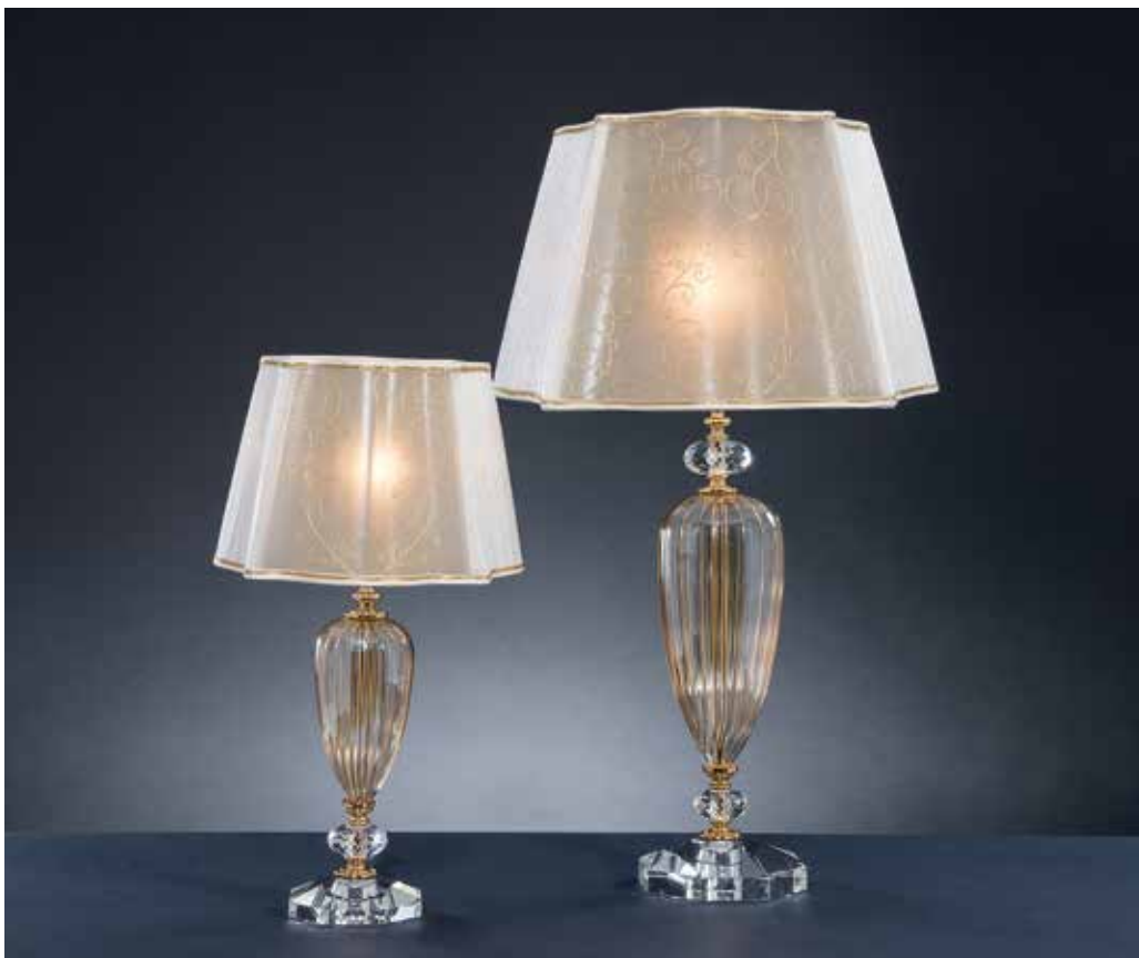
Sofia/LG ambra oro ø 40 H 70 Sofia/LP ambra oro ø 30 H 50