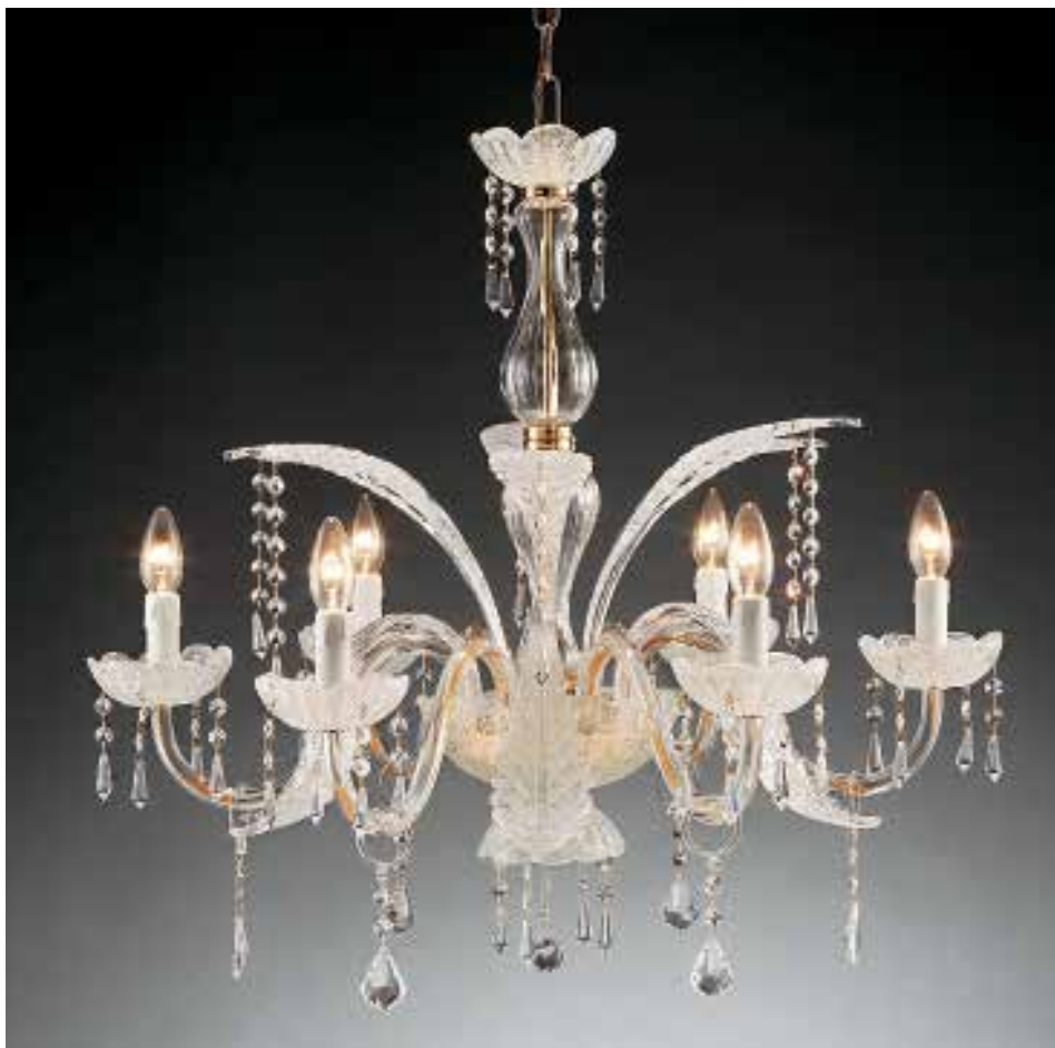
Stefy/6 cristallo ø 75 H 70 disponibile ambra