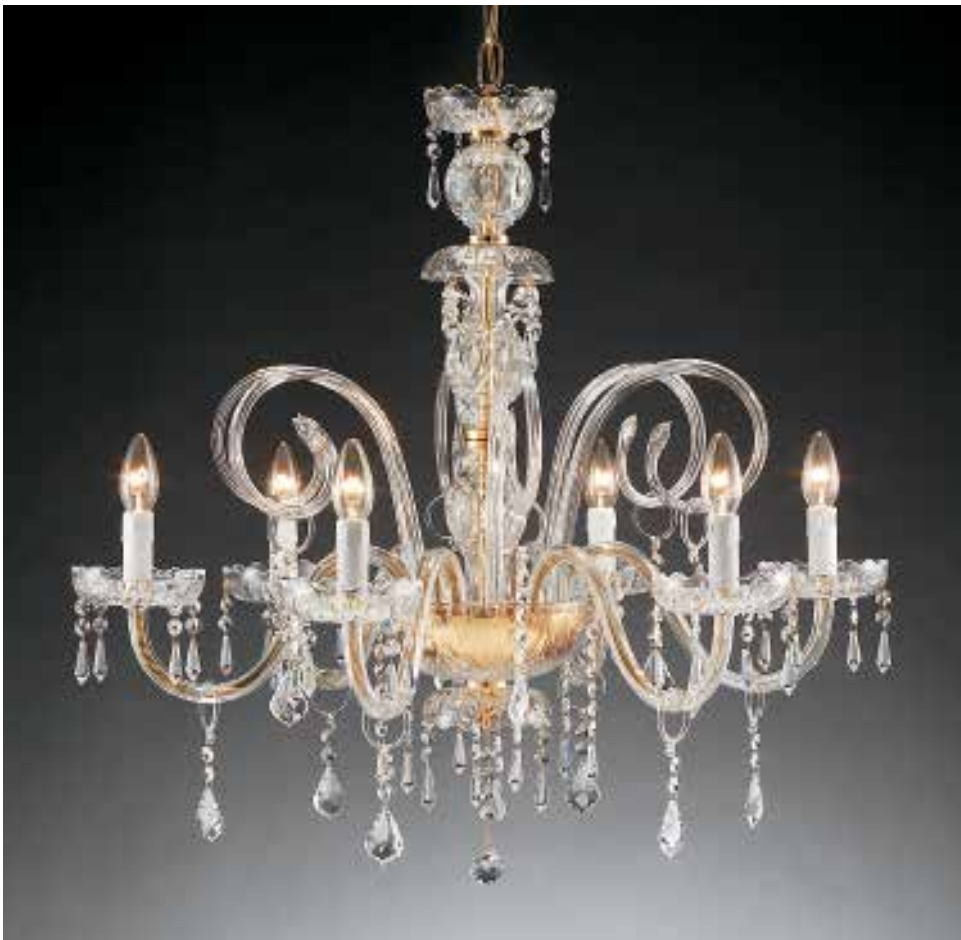
1301/6 L ø 72 H 72 disponibile cromo