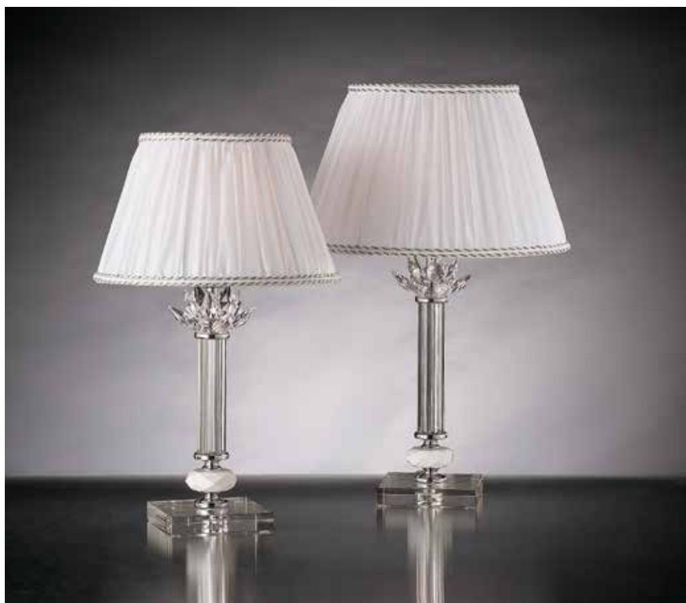
Amanda/LG cromo IPL ø 36 H 53 Amanda/LP cromo IPL ø 25 H 43 disponibile oro