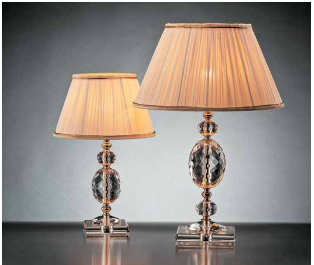
Elvira/LG oro INT ø 36 H 50 Elvira/LP oro INT ø 25 H 40 disponibile cromo