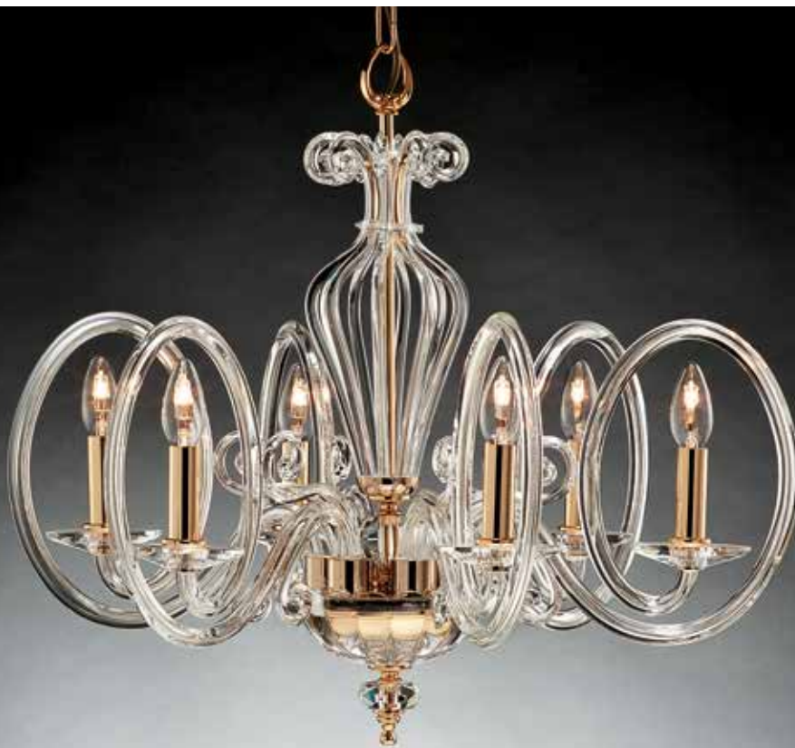
Cassandra/6 oro Ø 70 H 65