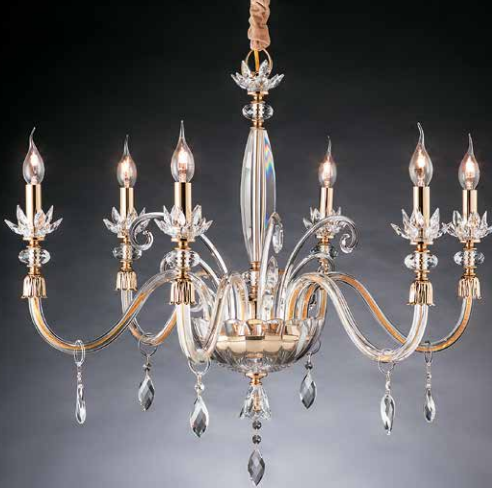
Amanda/6 oro ø 80 H 65 disponibile cromo