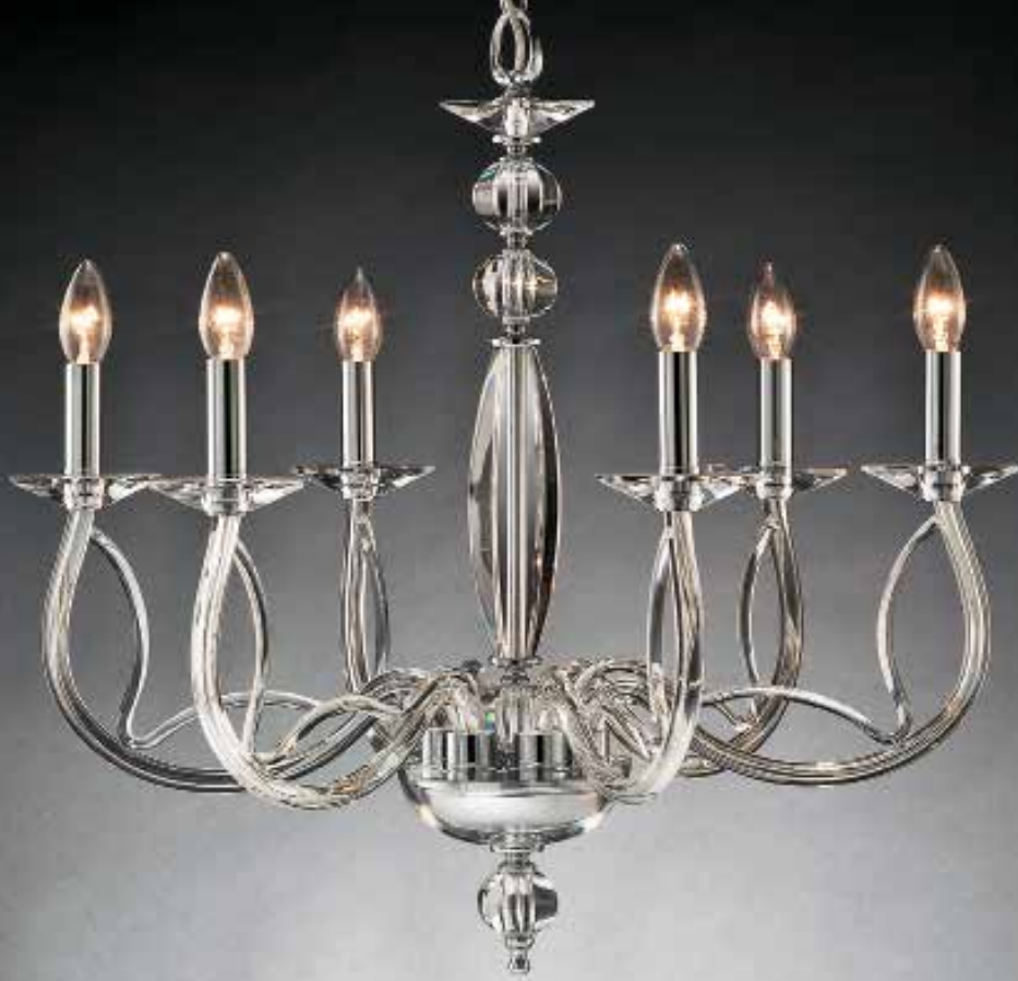
Chiara/6 cromo ø 70 H 65 disponibile oro