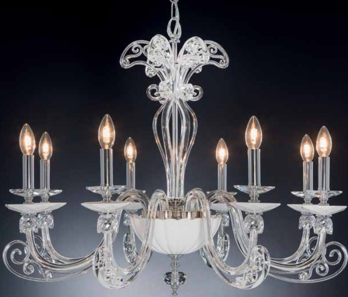
Angy/8 cromo bianco ø 85 H 70 disponibile oro