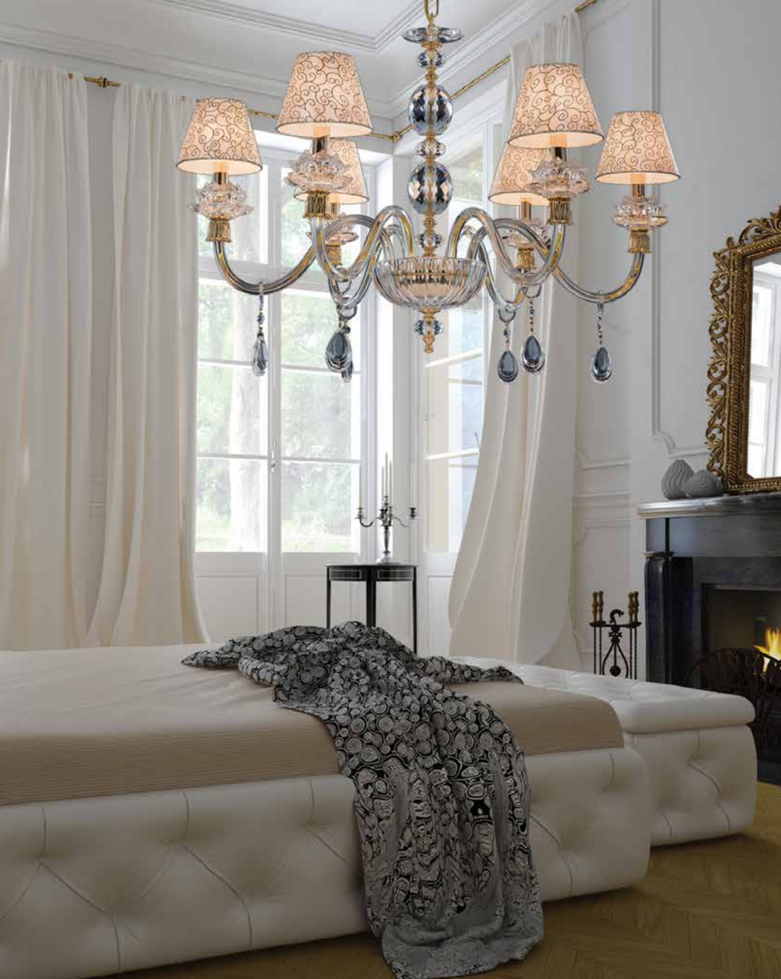
Raffaella/6 oro ø 80 H 60 disponibile cromo