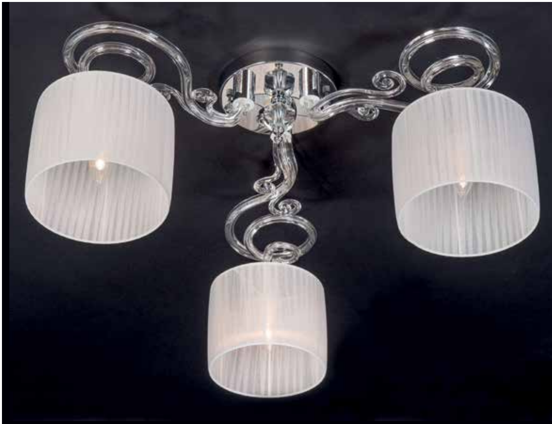
Siria/PL3 cromo ø 80 H 38 disponibile oro