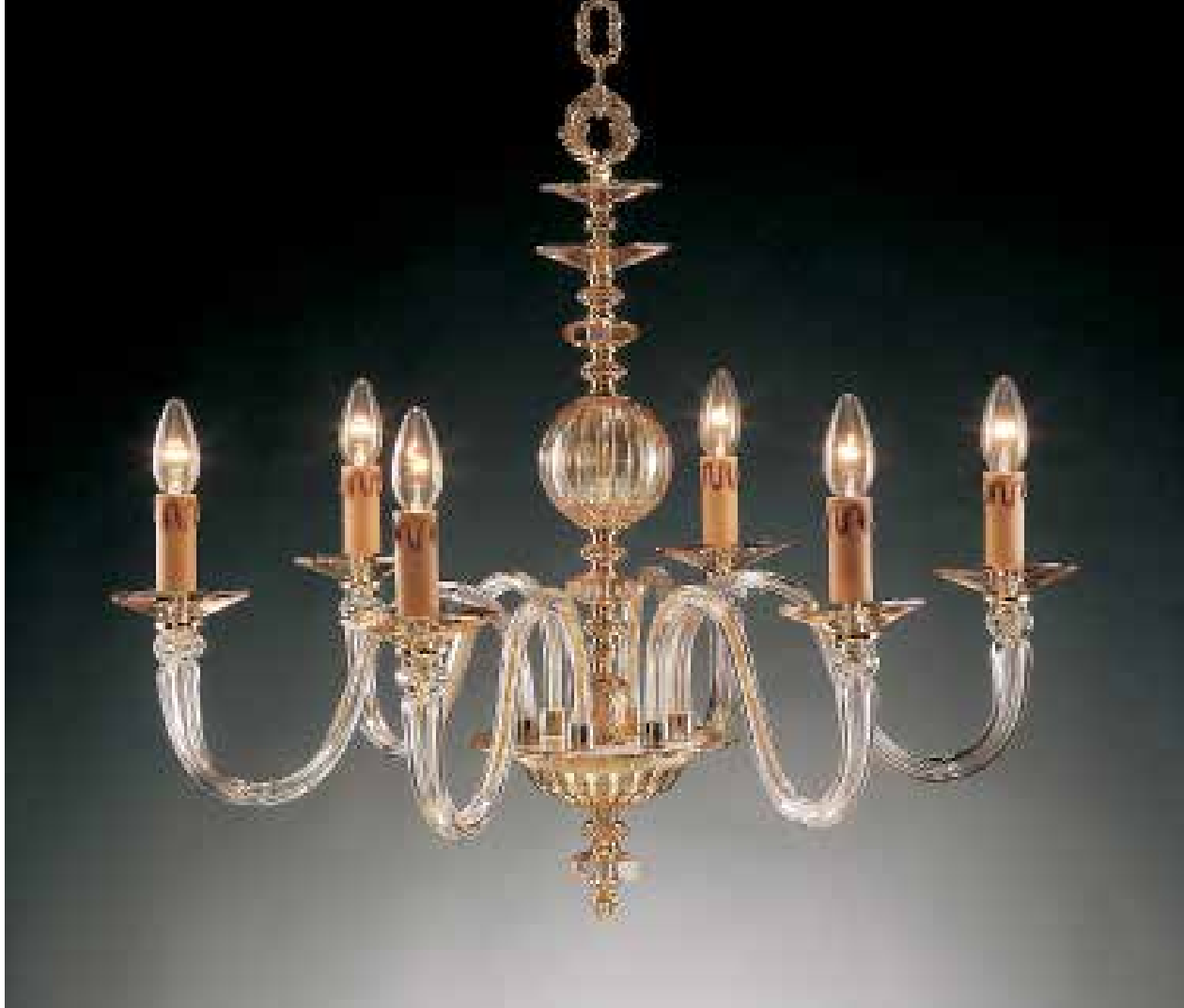
Anita/6 ambra ø 70 H 60