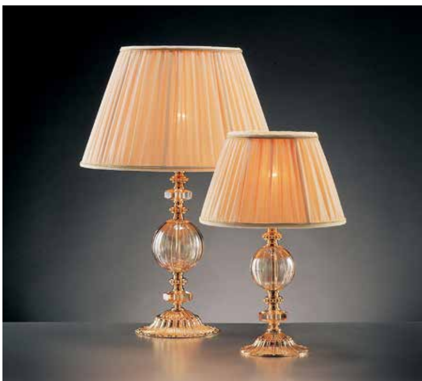
Anita/LG INT ø 35 H 52 Anita/LP INT ø 25 H 40