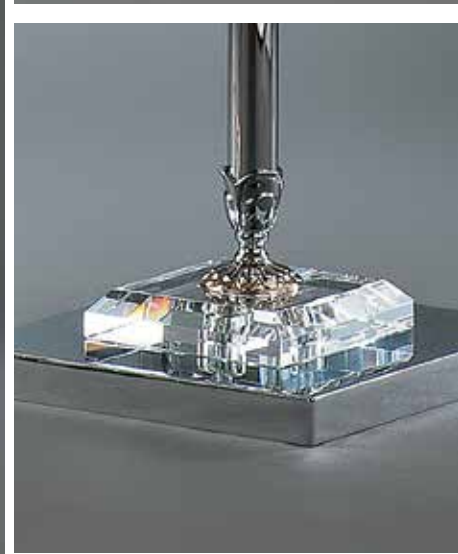
Ottagono/PT cromo IFAO nero ø 45 H 178 Venezia/PT oro IFAO bianco ø 45 H 178