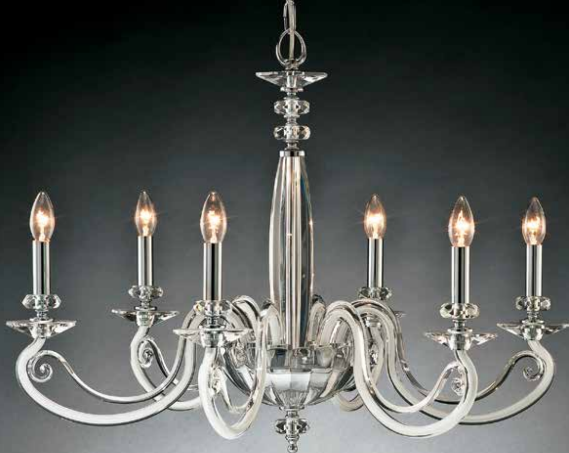
Morena/6 bianco ø 85 H 70 disponibile nero