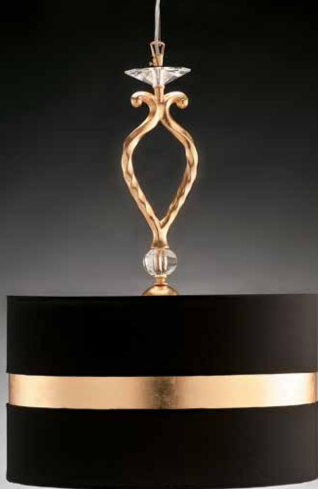
Aisha/S foglia oro ø 50 H 65