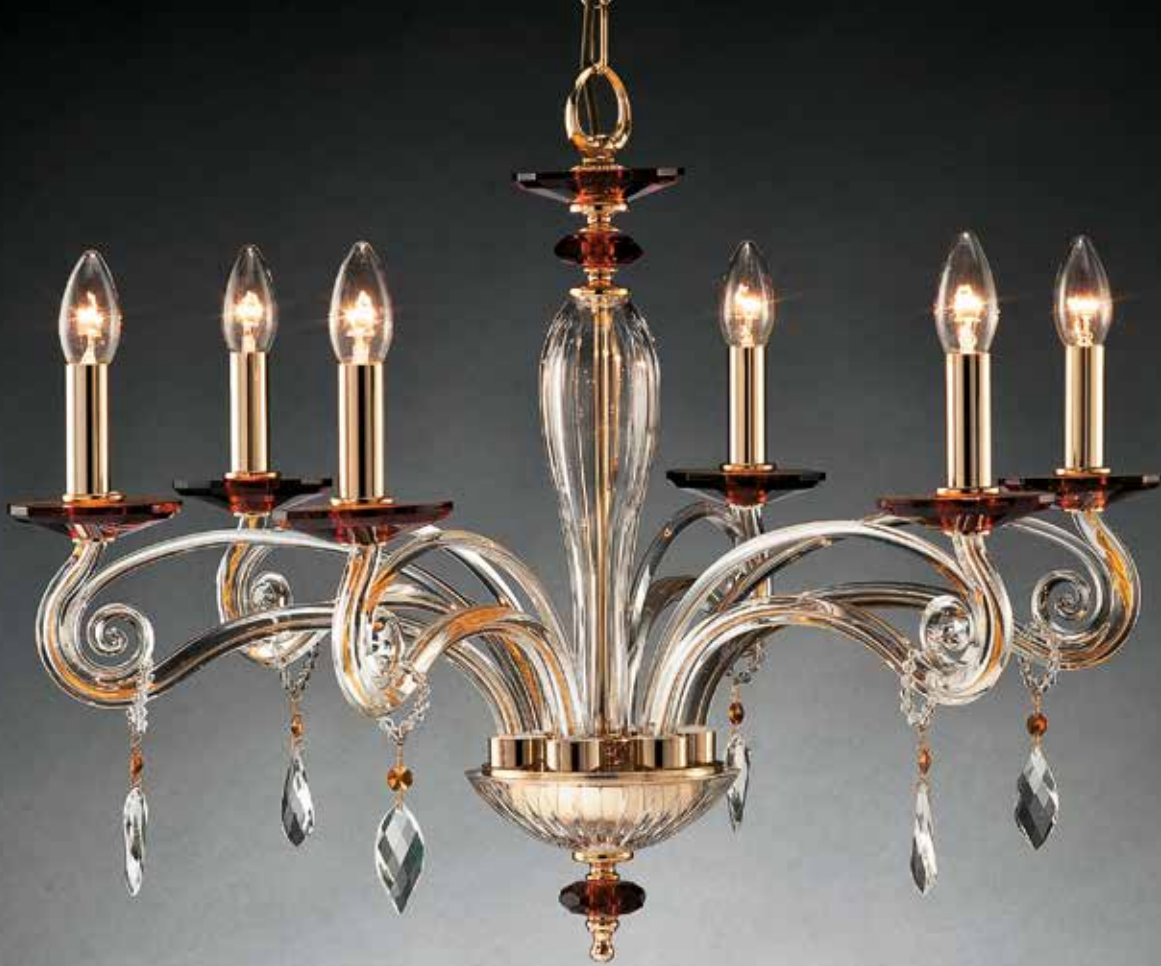
Carla/6 oro ø 70 H 50 disponibile cromo