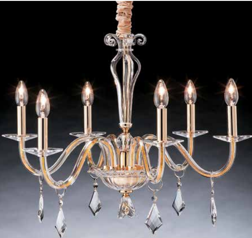
Riccio/6 oro ø 75 H 60 disponibile cromo