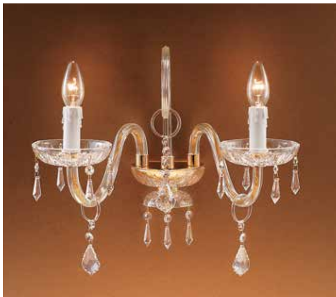
LU 200/L H 35 L 36 SP 30