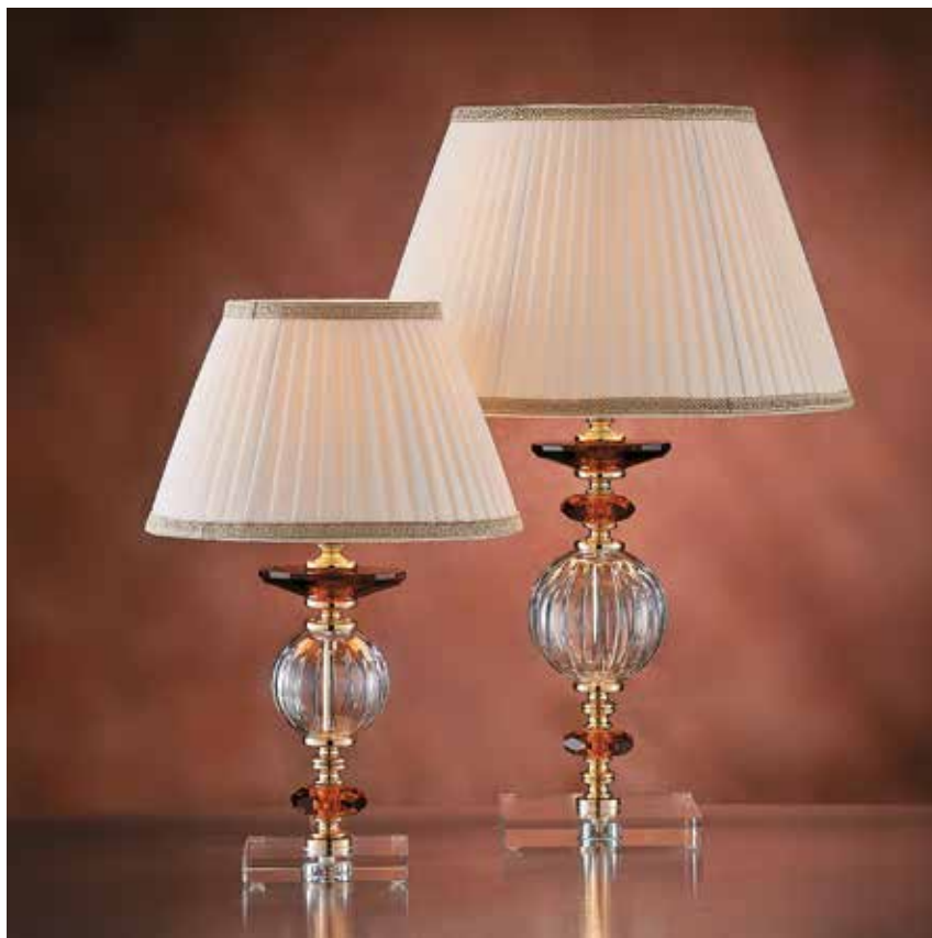
Carla/LG oro IFA ø 37 H55 Carla/LP oro IFA ø 25 H40