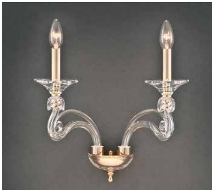
Vanessa/AP2 H 34 L 34 SP 25 disponibile cromo