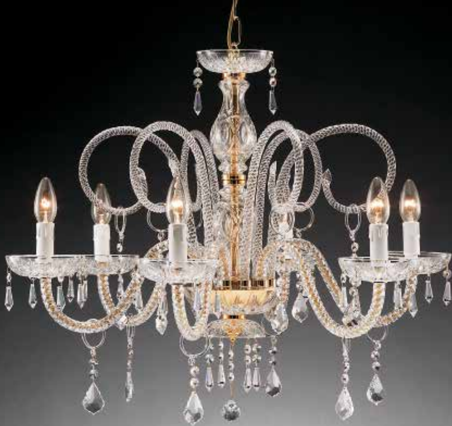
LU600/T oro/cromo ø 80 H 55 disponibile liscio