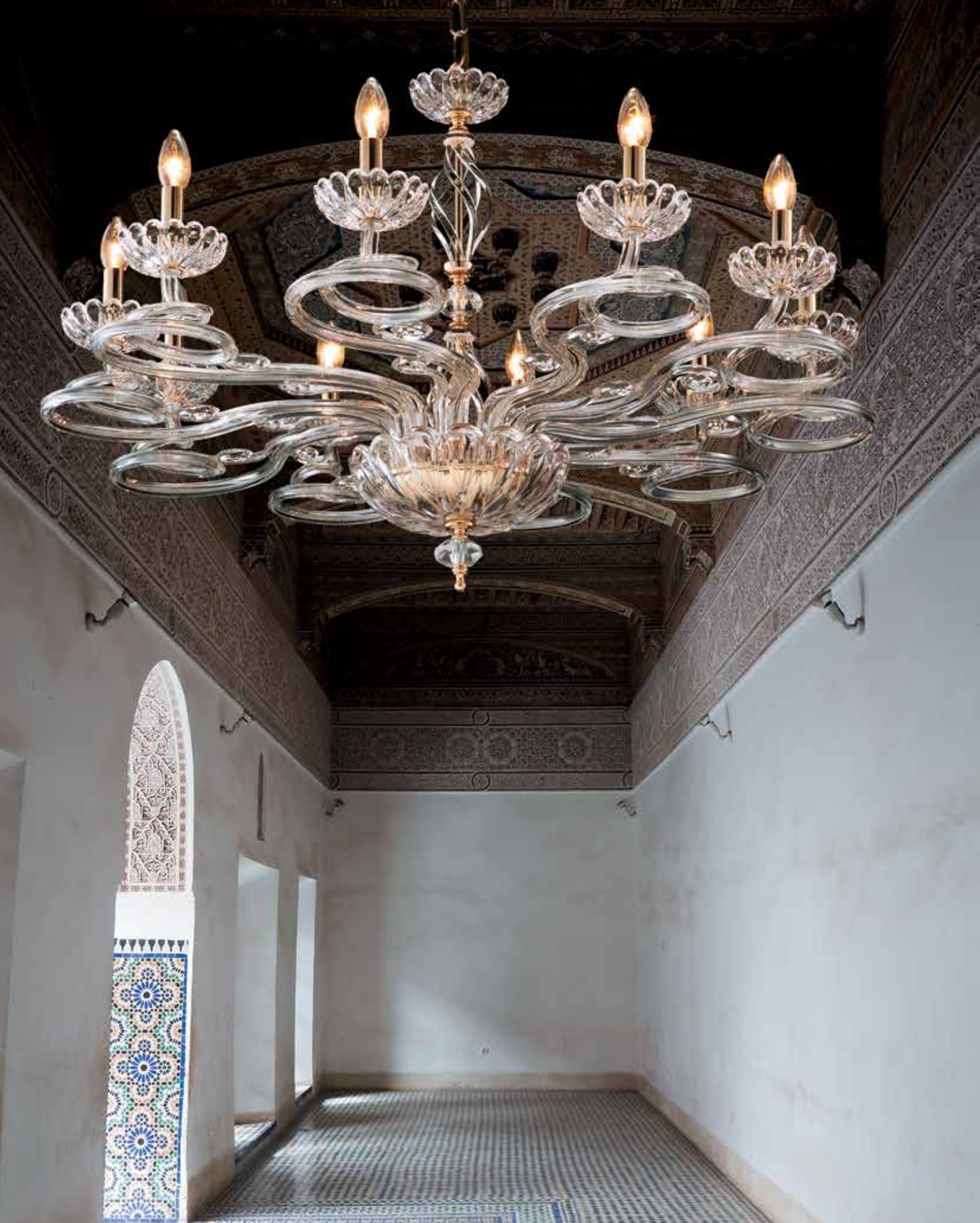
Ivana/10 oro Ø 100 H 75 disponibile cromo