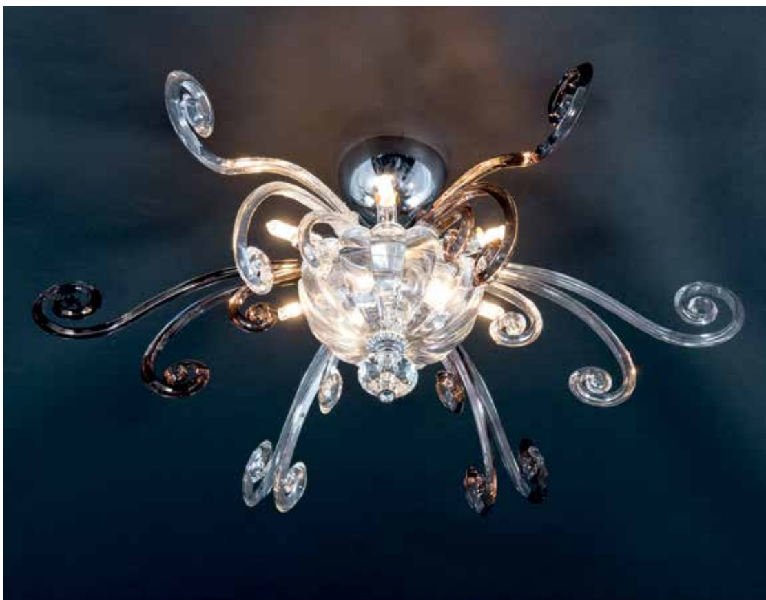
Capri/60 cromo fumè ø 60 H 25