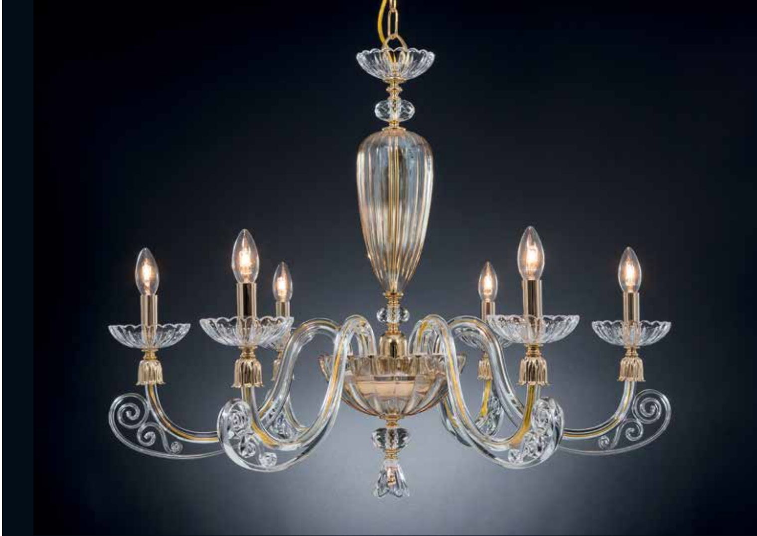
Sofia/6 ambra oro ø 85 H 65