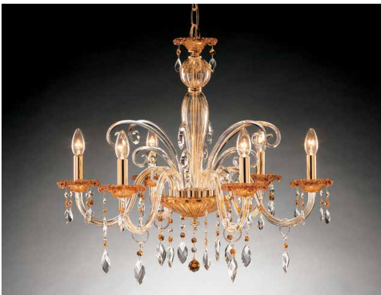
Lisa/6 AM ø 72 H 65 disponibile cristallo, oro, cromo