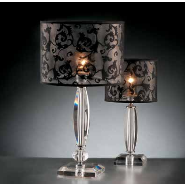
Martina/LG cromo NN ø 30 H 55 Martina/LP cromo NN ø 20 H 41