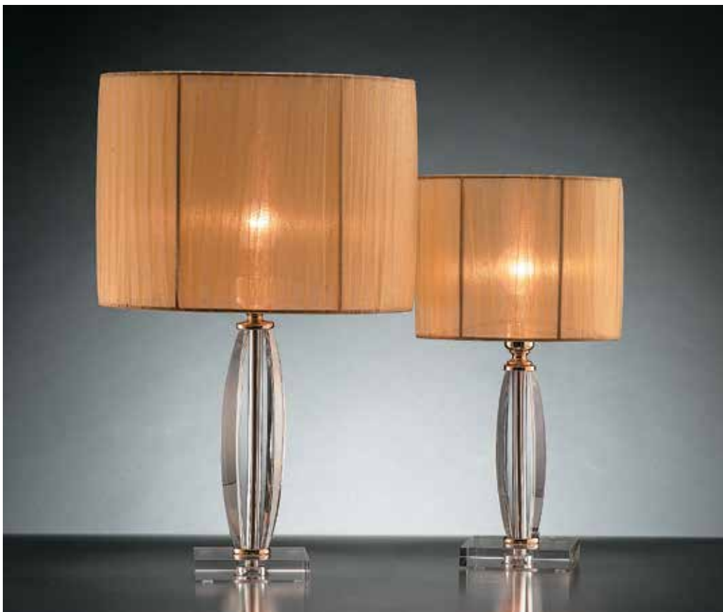
Perugia/LG oro CFAO