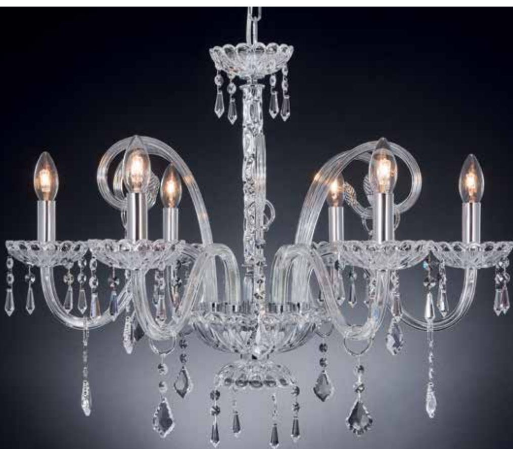
Carmelina/6 cromo ø 70 H 55 disponibile oro