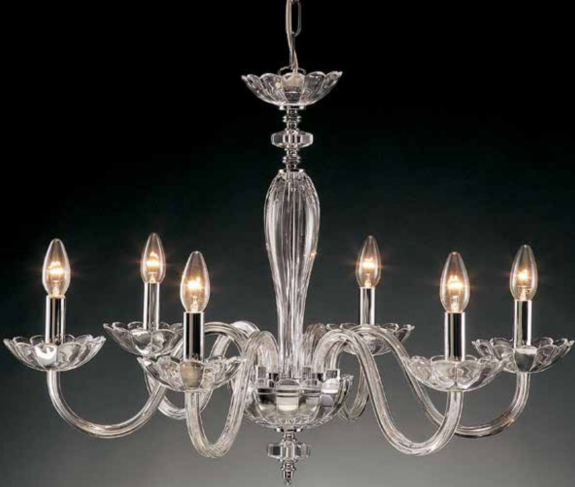
Rosita/6 cromo ø 70 H 55 disponibile oro