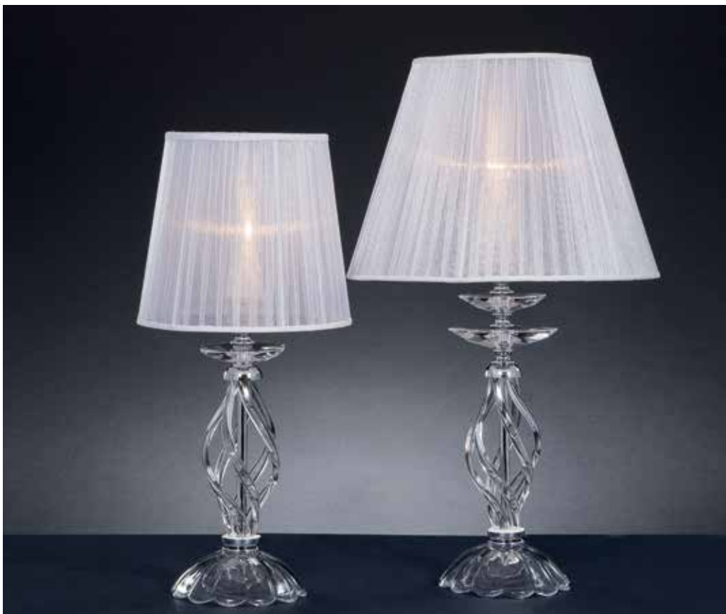
Ares/LG cromo FAS bianco ø 30 H 52 Ares/LP cromo FAS bianco ø 20 H 42