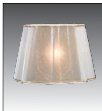
GATTO finitura oro argento