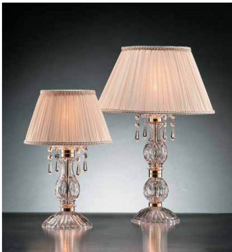
1315/LG IPL ø 36 H 50 1315/LP IPL ø 25 H 40 disponibile cromo