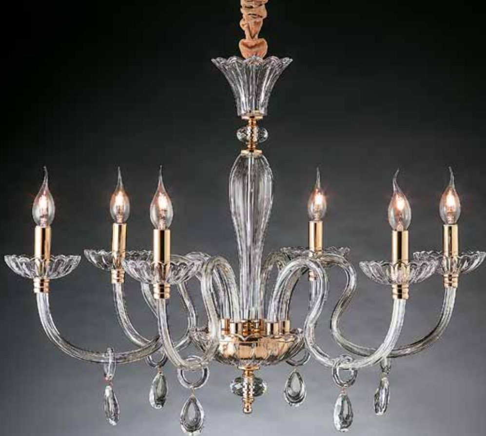
Donata/6 oro ø 80H 60 disponibile cromo