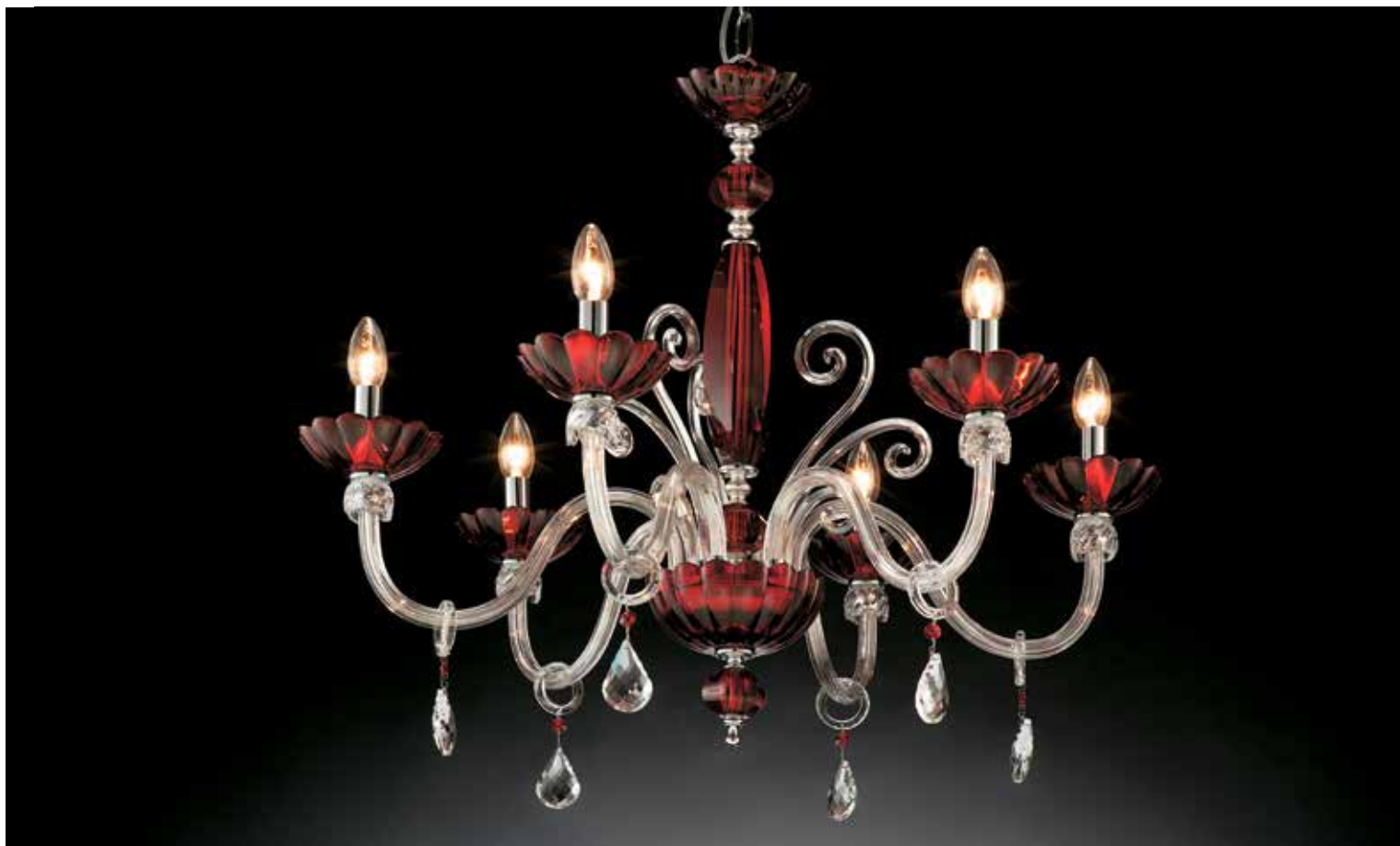
Dorotea/6 rosso/cromo ø 75 H 70