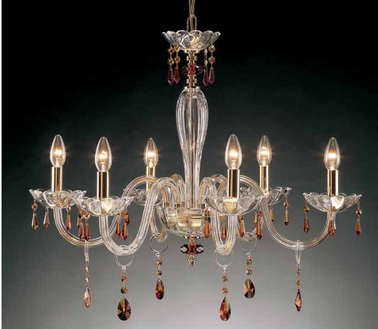
Rossella/6 oro/ambra ø 70 H 65 disponibile cromo + colori