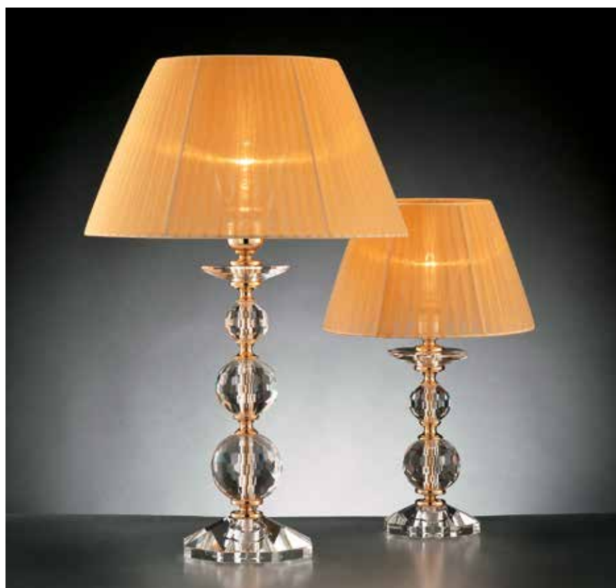
Elena/LG oro IFAO ø 37 H55 Elena/LP oro IFAO ø 25 H40