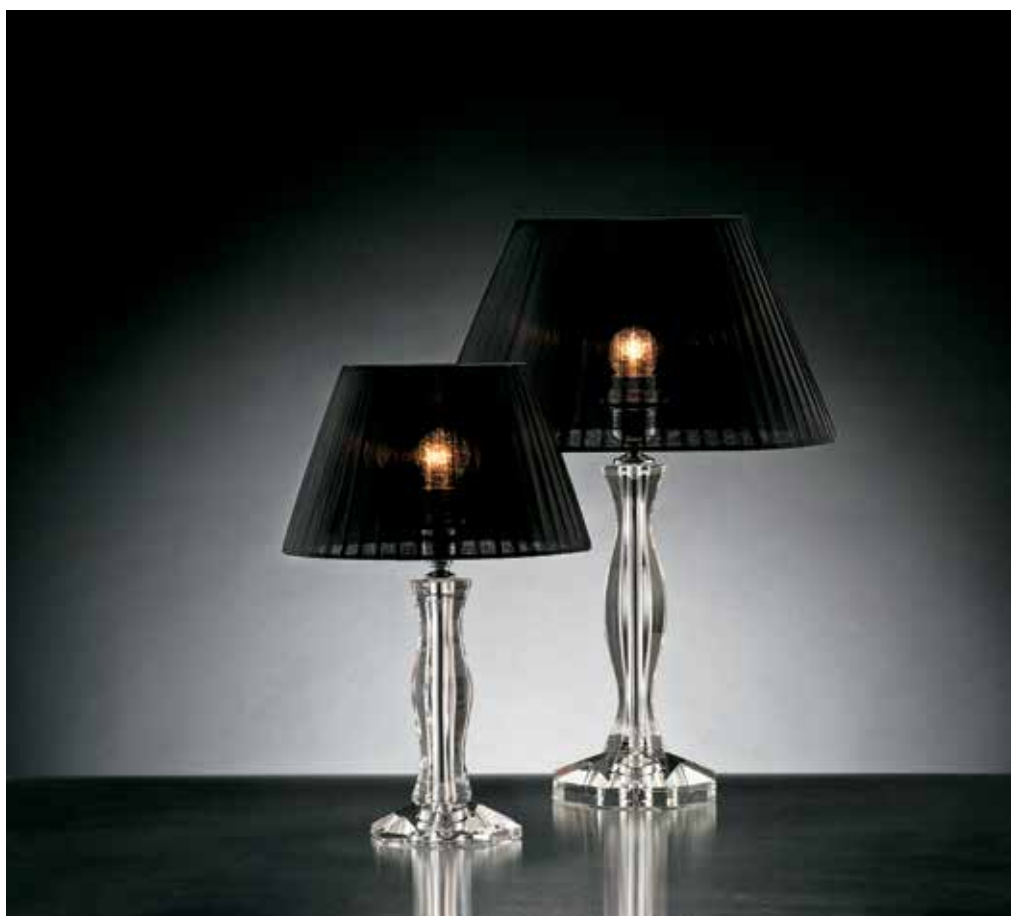
Brenda/LG cromo - IFAO nero ø 36 H 53 Brenda/LP cromo - IFAO nero ø 25 H 40 disponibile oro