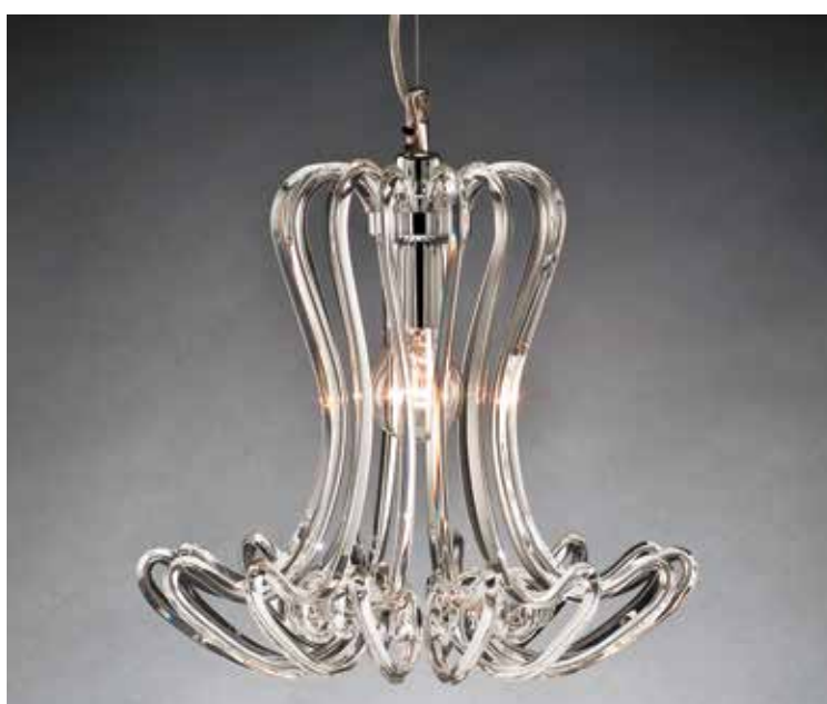
Shade/S cromo Ø 35 H 30 disponibile oro