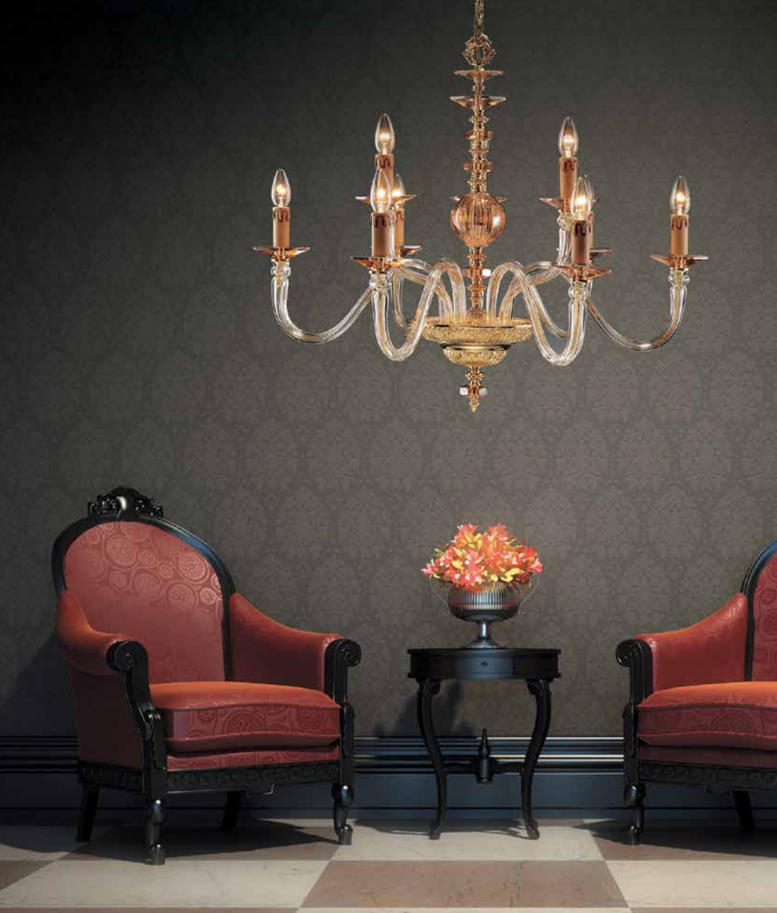
Anita/6+3 ambra ø 85 H 70