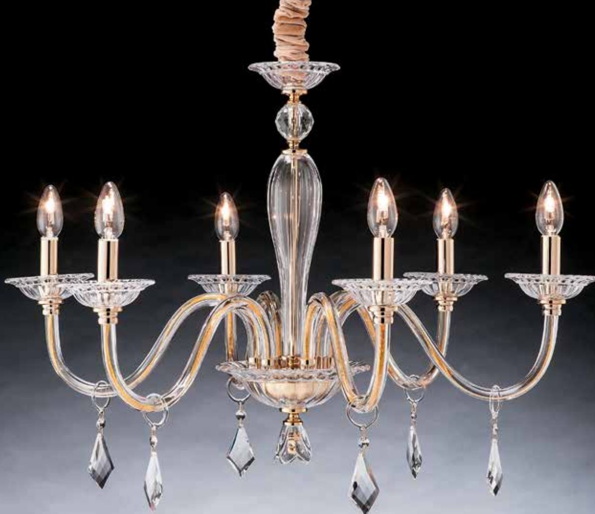
Onda/6 oro ø 75 H 60 disponibile cromo