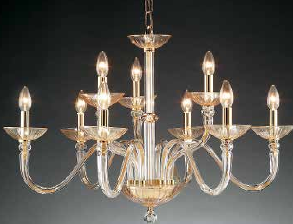
Matisse/6+3 ambra oro ø 85 H 55