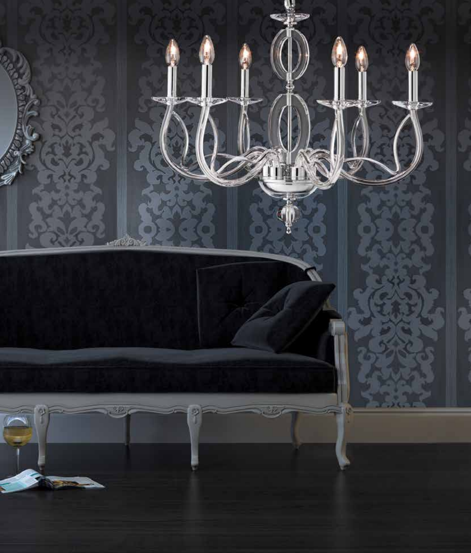
Ovada/6 cromo ø 70 H 65 disponibile oro