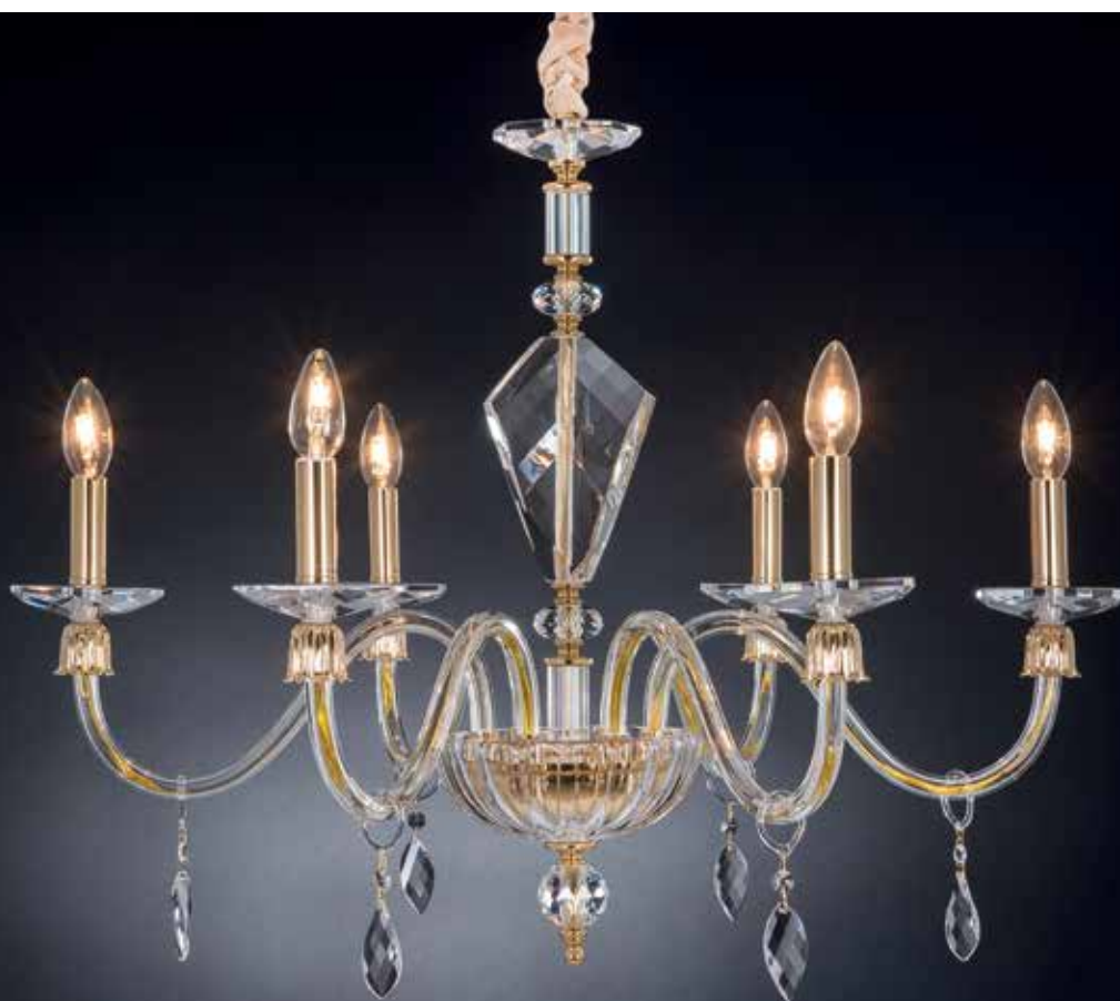
Lucrezia/6 oro ø 80 H 60 disponibile cromo