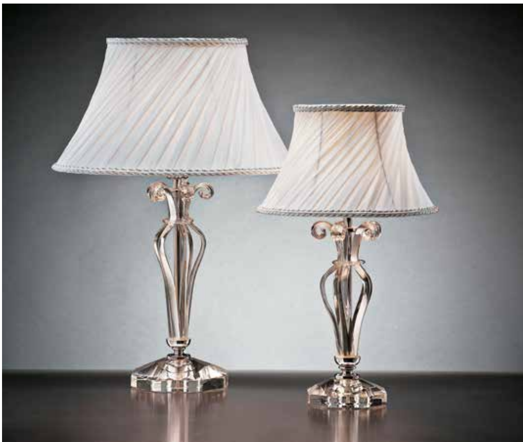
Dany/LG cromo OBL ø 36 H 50 Dany/LP cromo OBL ø 25 H 40 disponibile oro