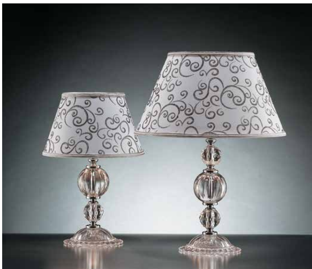
Onda/LG cromo GALLO ø 36 H 50 Onda/LP cromo GALLO ø 25 H 40 disponibile oro