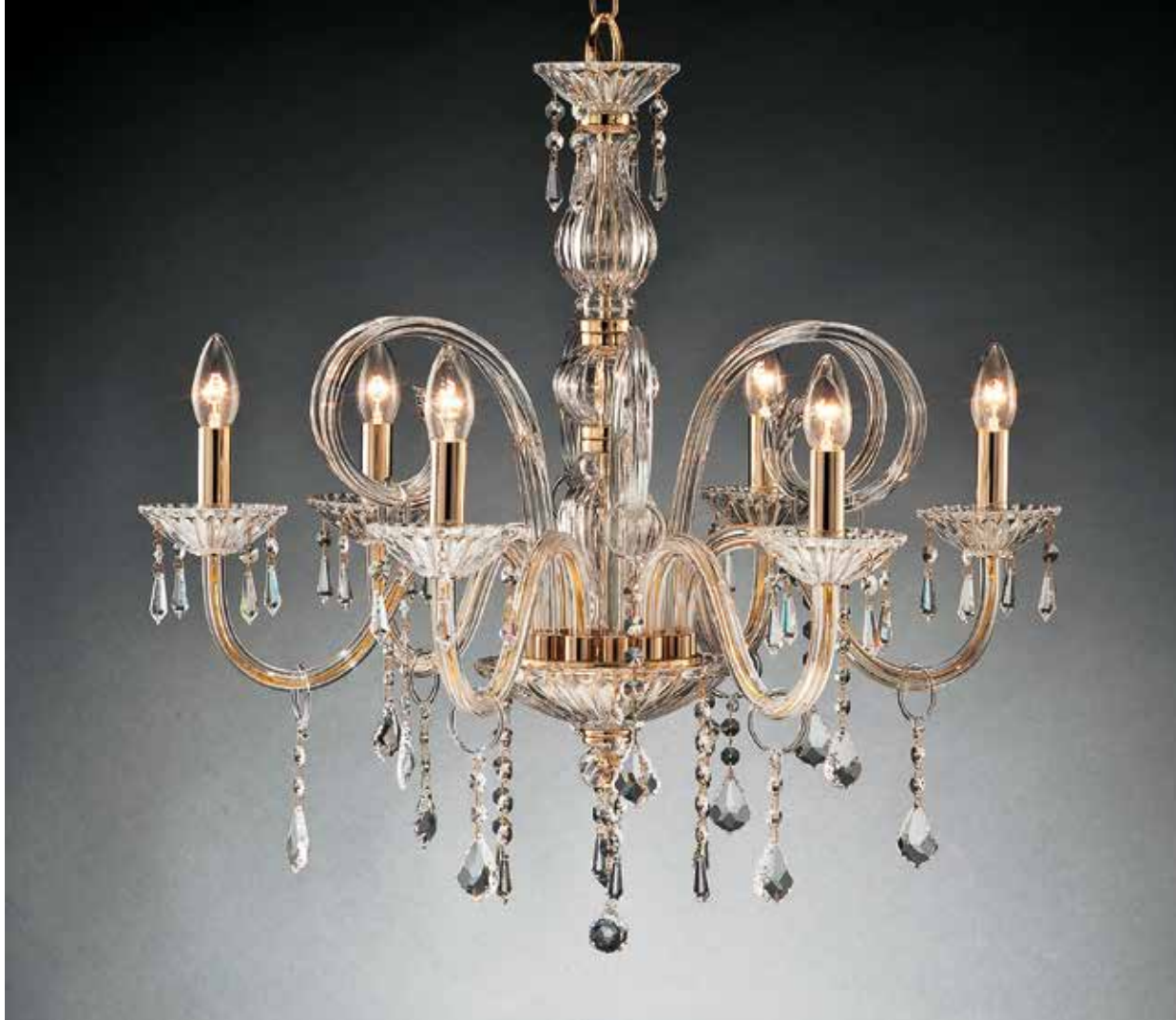
Adria/6 oro ø 70 H 70 disponibile cromo