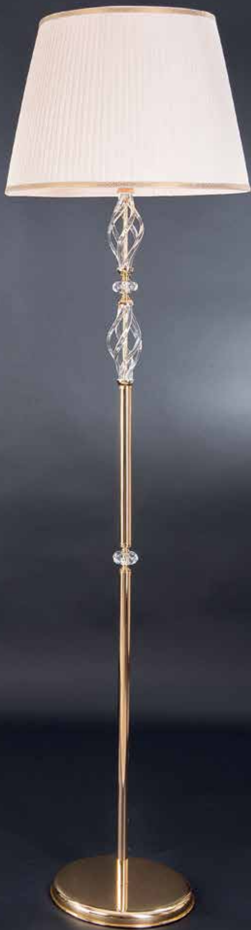
ZUELA/PT oro IFA ø 50 H 175 disponibile cromo