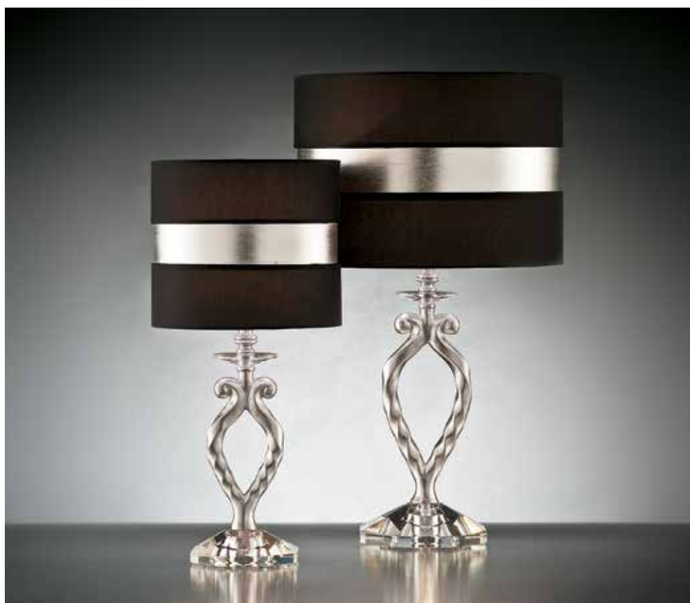
Aisha/LG foglia argento ø 30 H 50 Aisha/LP foglia argento ø 20 H 42