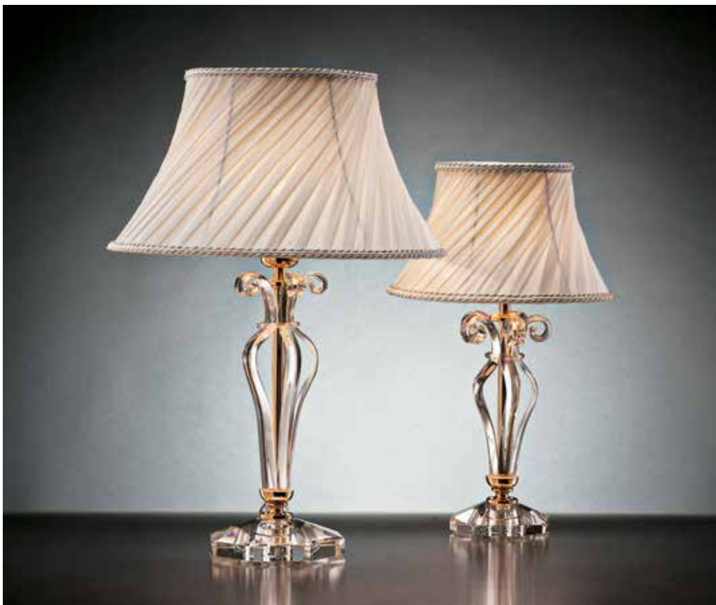
Matilde/LG oro OBL ø 36 H 50 Matilde/LP oro OBL ø 25 H 40