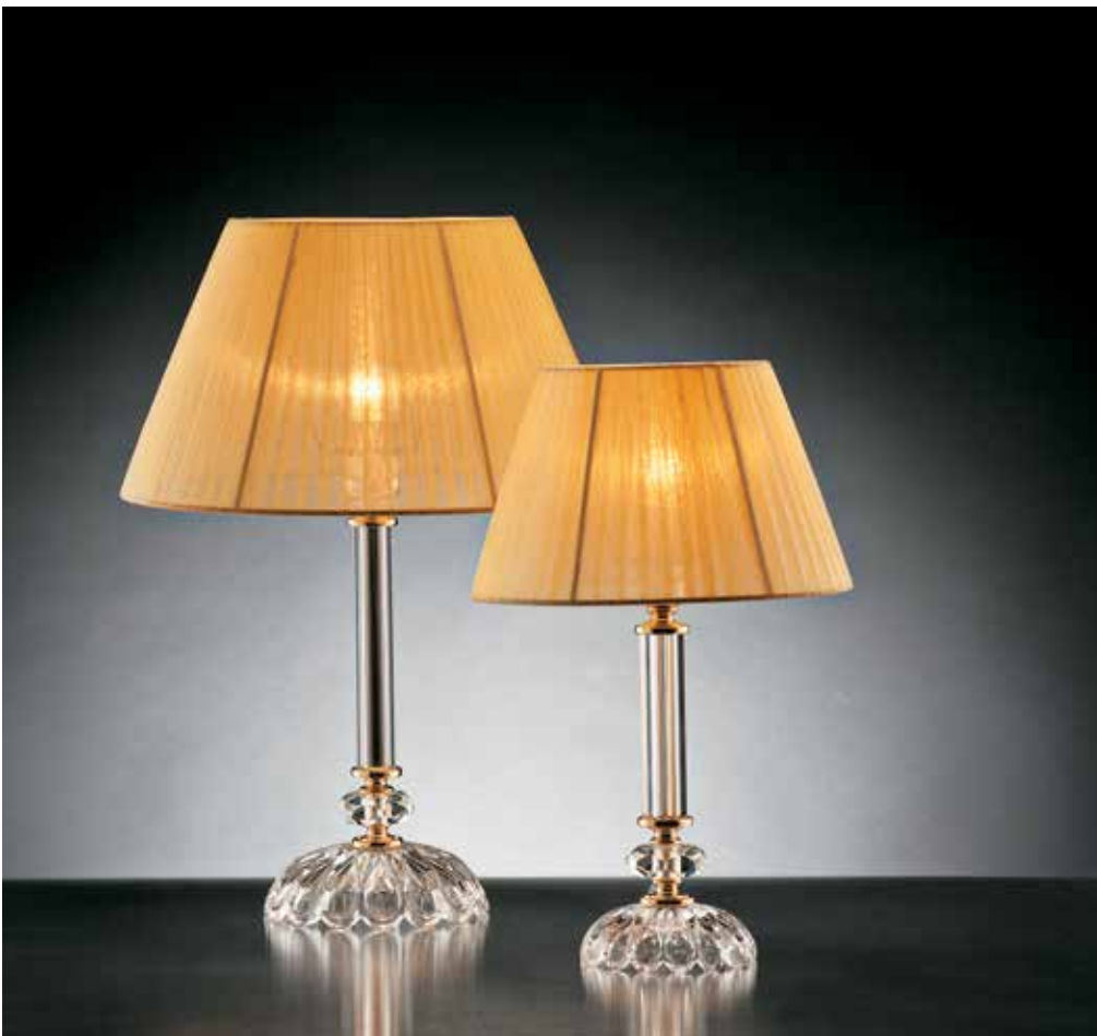
Cassiopea/LG oro IFAO ø 36 H 50 Cassiopea/LP oro IFAO ø 25 H 40 disponibile cromo