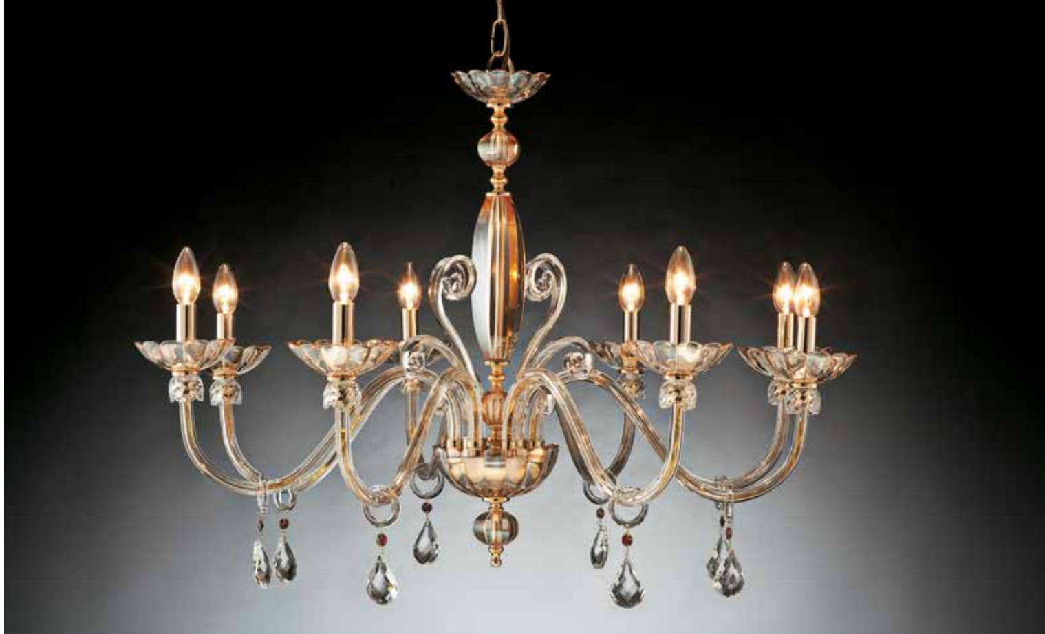
Dorotea/8 ambra oro ø 95 H 75 disponibile cristallo