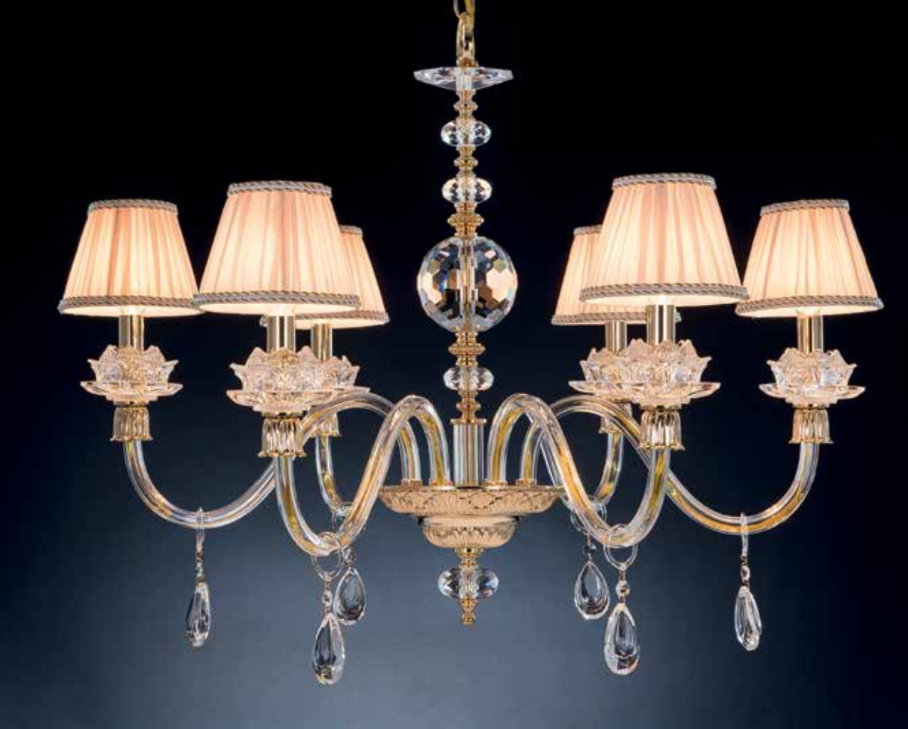
Arabella/6 oro ø 80 H 66