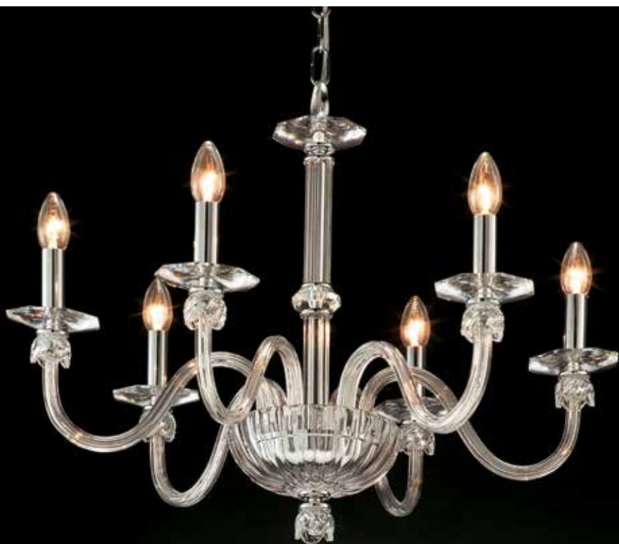
Ada/6 cromo Ø 75 H 65