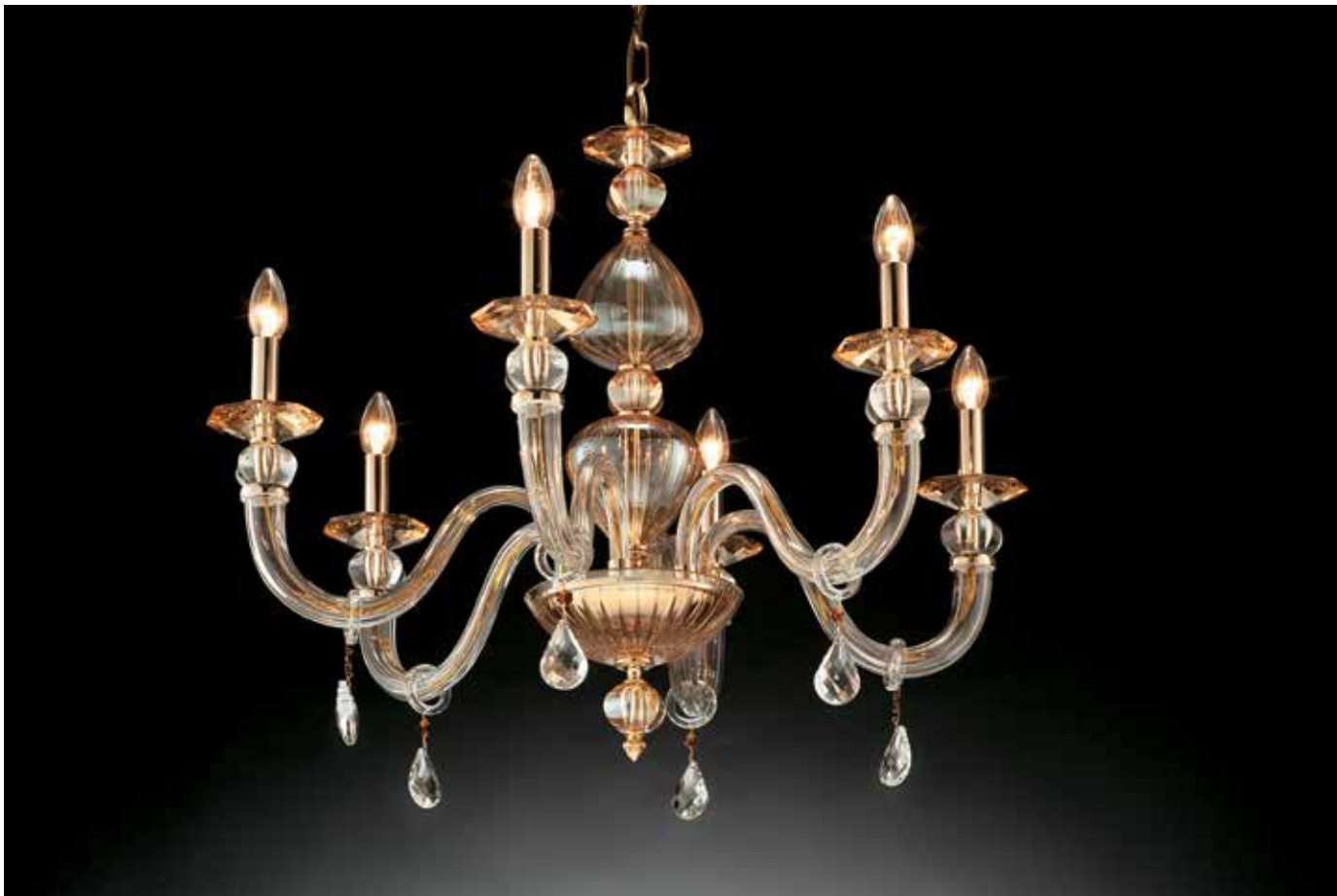
Egizia/6 ambra/oro ø 85 H 70 disponibile cristallo