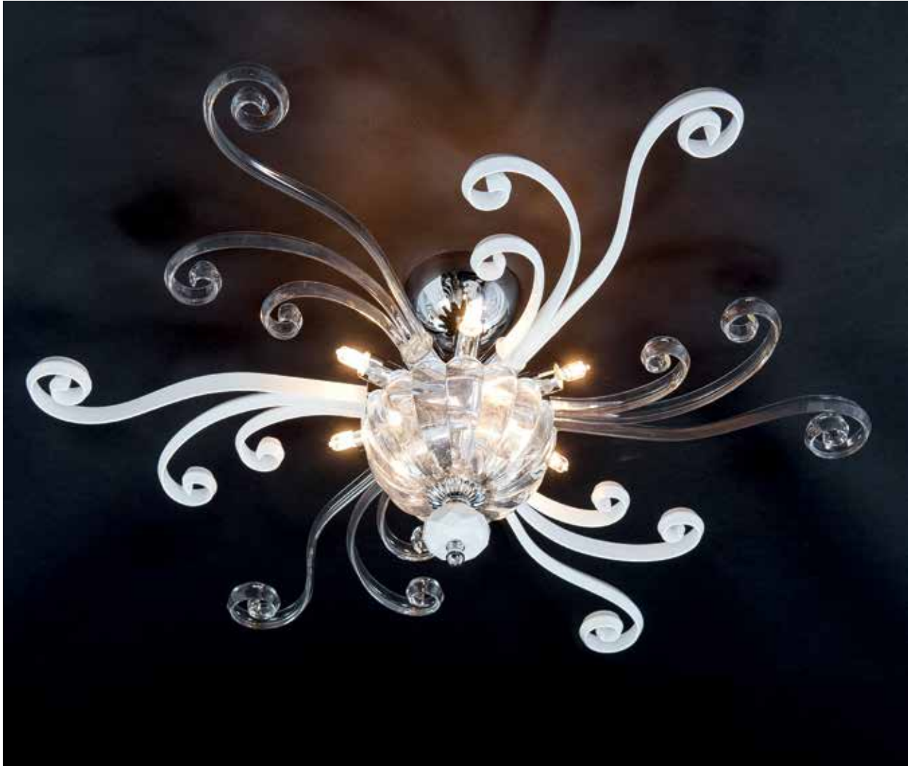
Ischia/70 cromo bianco ø 70 H 25