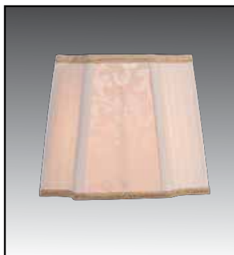
CORNICE finitura bianco avorio