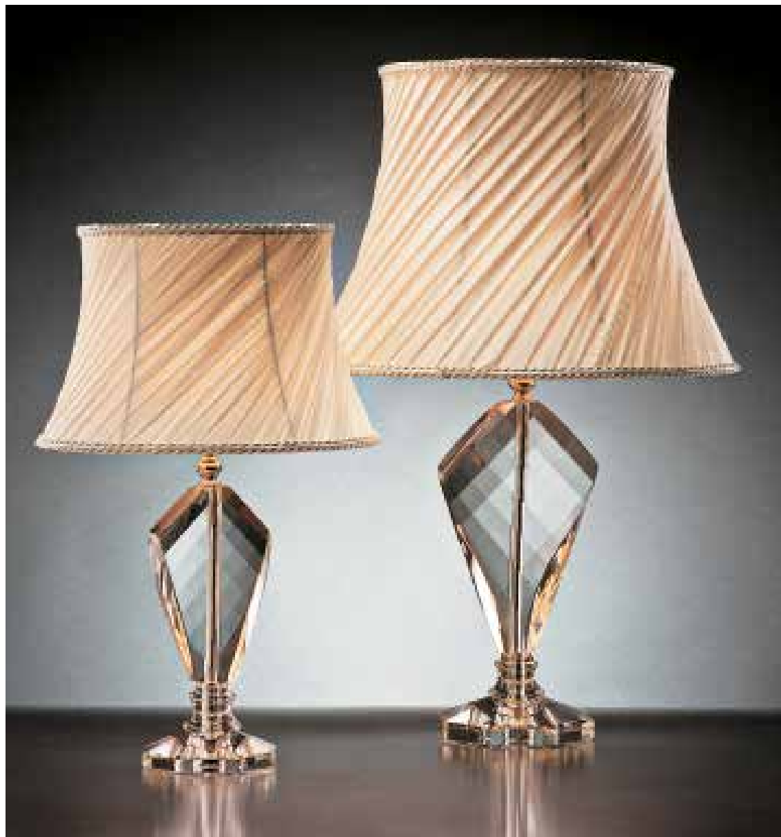
Lilly/LG oro OBL ø 50 H 75 Lilly/LP oro OBL ø 30 H 49