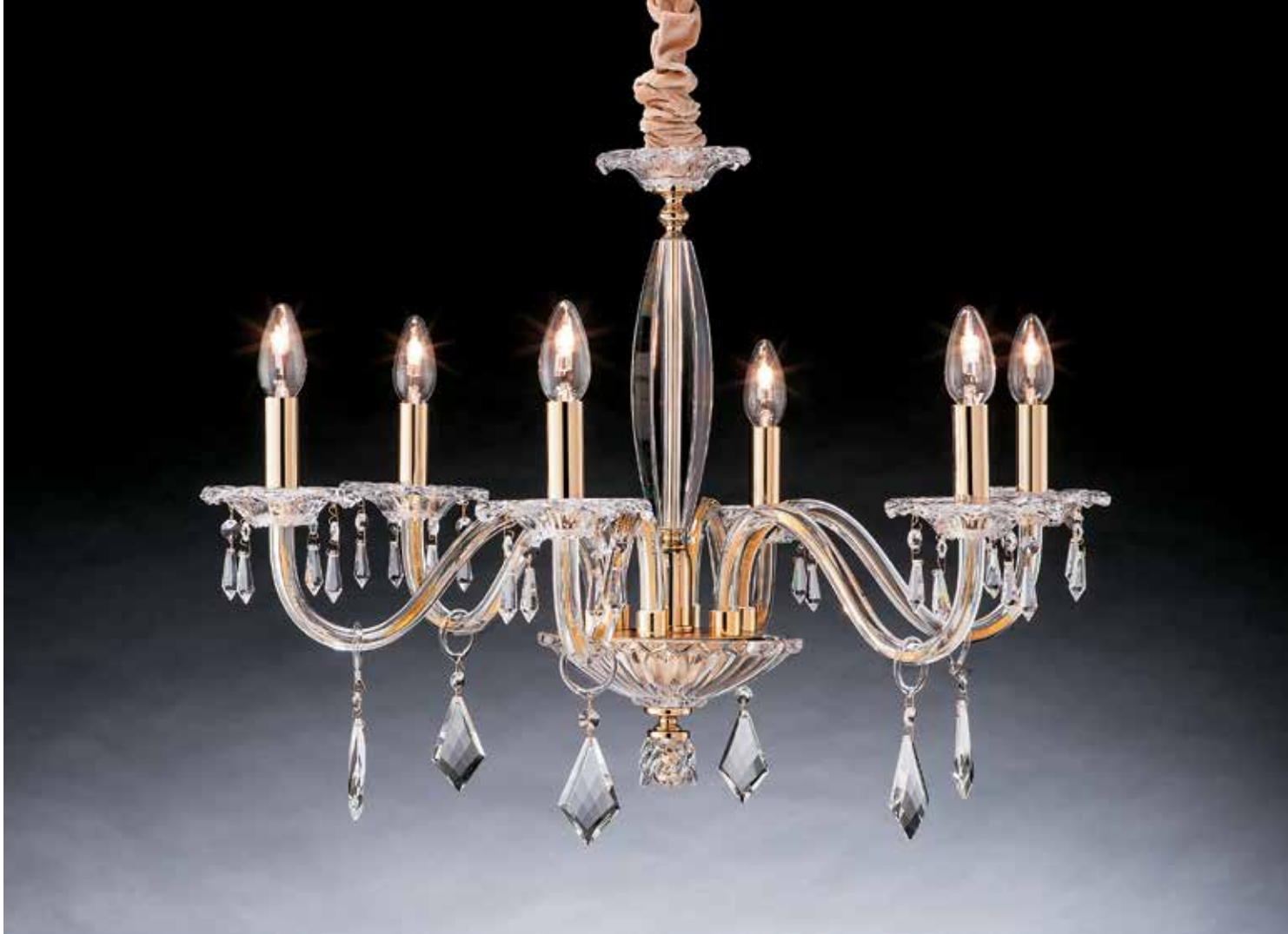
Venice/6 oro ø 70 H 55 disponibile cromo