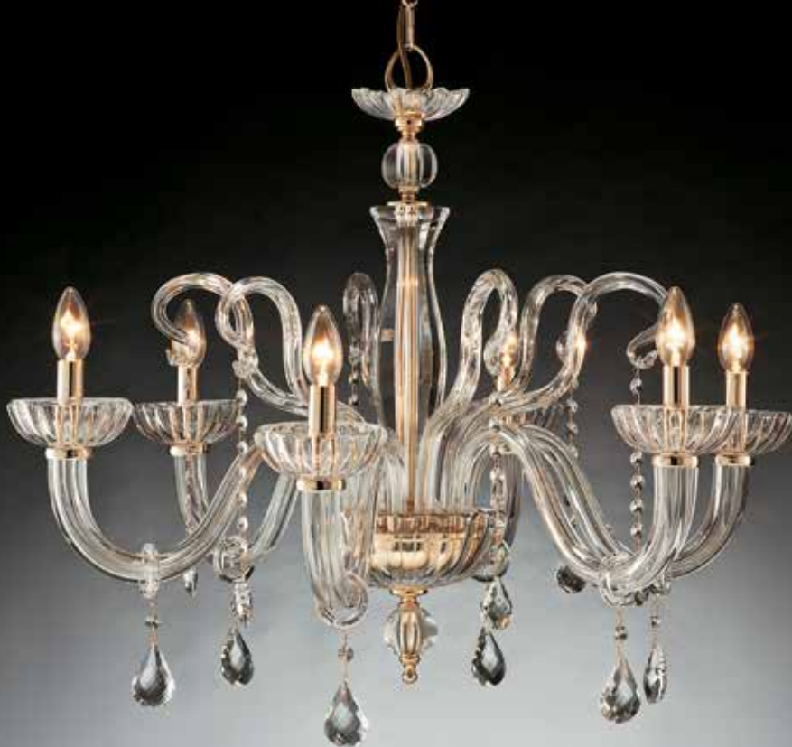
Brenda/6 oro ø 76 H 65 disponibile cromo