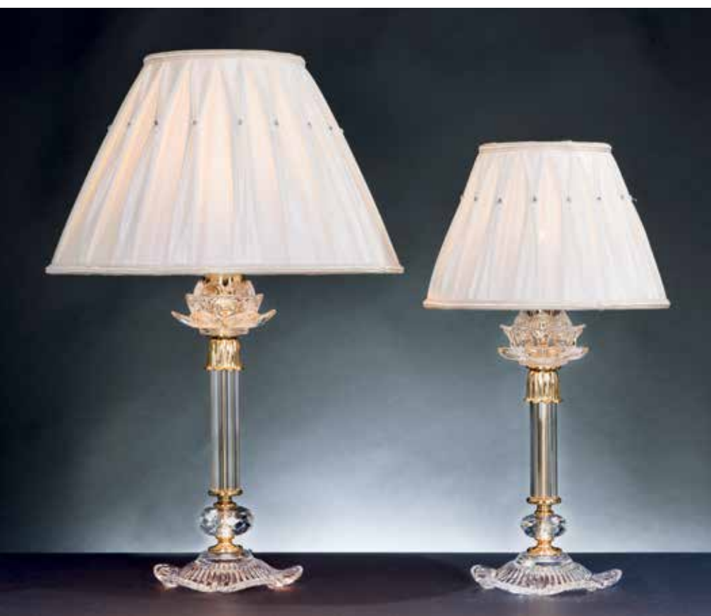
Raffaella/LG oro crystal ø 36 H 56 Raffaella/LP oro crystal ø 25 H 46