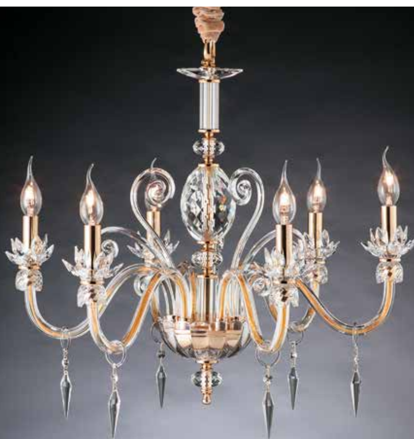
Elvira/6 bis oro Ø 68 H 63 disponibile cromo