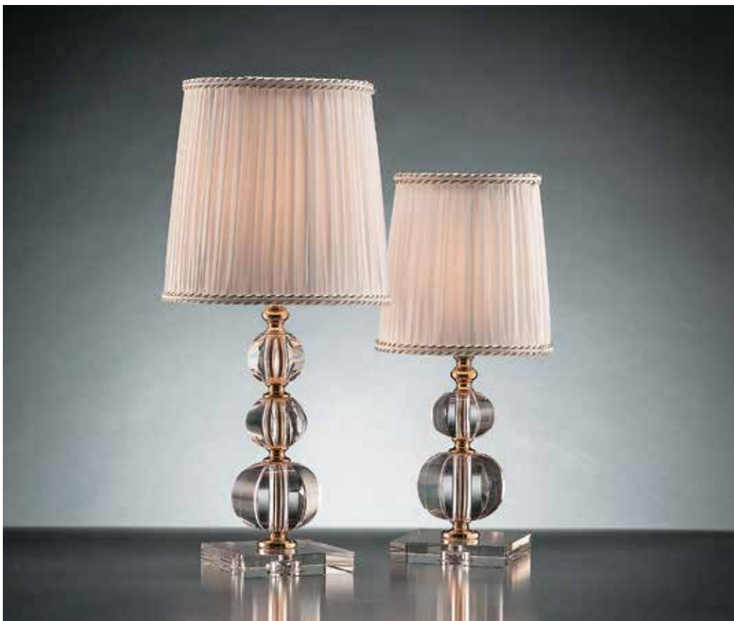
Venice/LG oro VPL ø 20 H 45 Venice/LP oro VPL ø 16 H 36 disponibile cromo