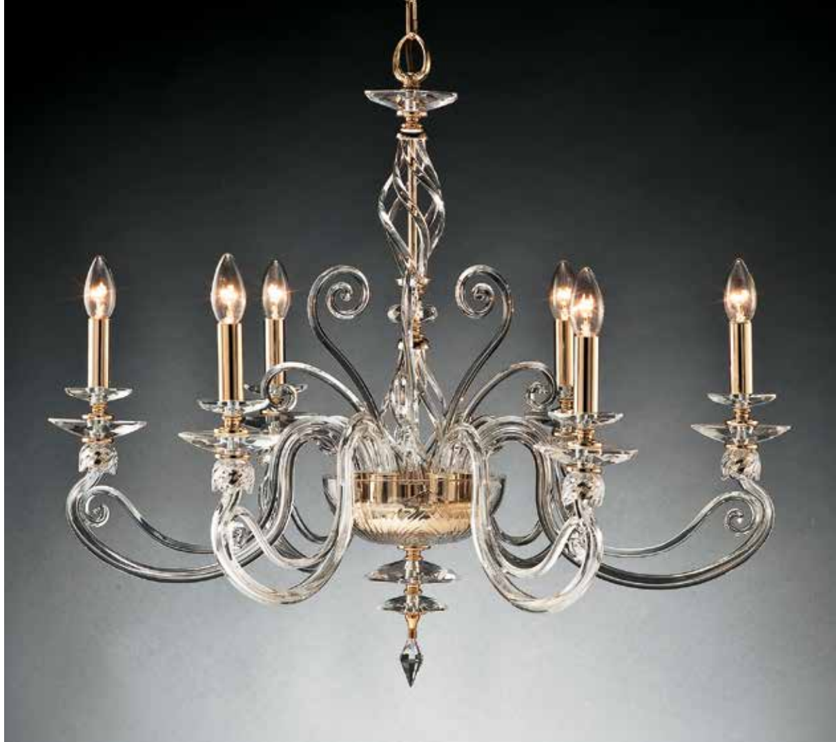
Zuela/6 oro ø 85 H 65 disponibile cromo