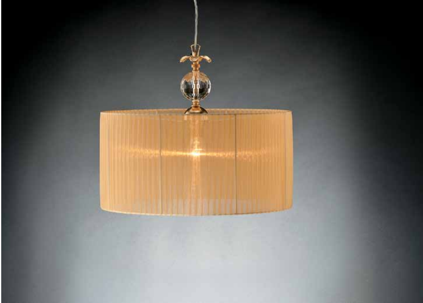
Cathy/S50 oro Ø 50 H45