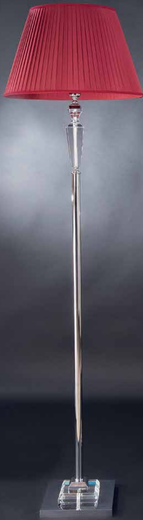
CLOE/PT cromo ø 50 H 175 disponibile oro/oro francese