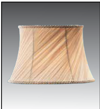
OBL finitura avorio/oro bianco/argento