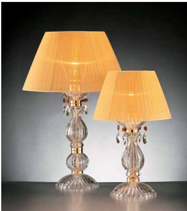
Adria/LG oro IFAO ø 37 H 55 Adria/LP oro IFAO ø 25 H 40 disponibile cromo