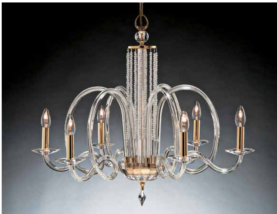
Penelope/6 oro ø 80 H 75 disponibile cromo