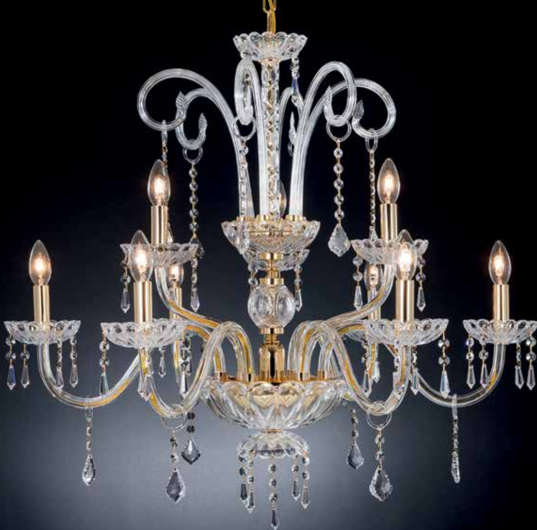
Carmelina/6+3 oro ø 88 H 85 disponibile cromo