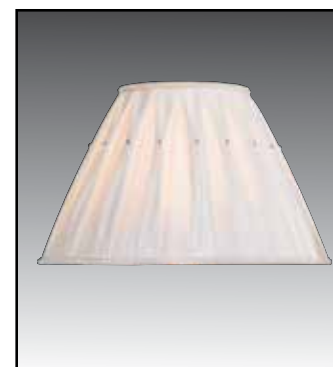
CRYSTAL finitura avorio/oro bianco/argento