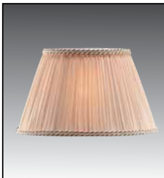
IPL finitura avorio/oro bianco/argento