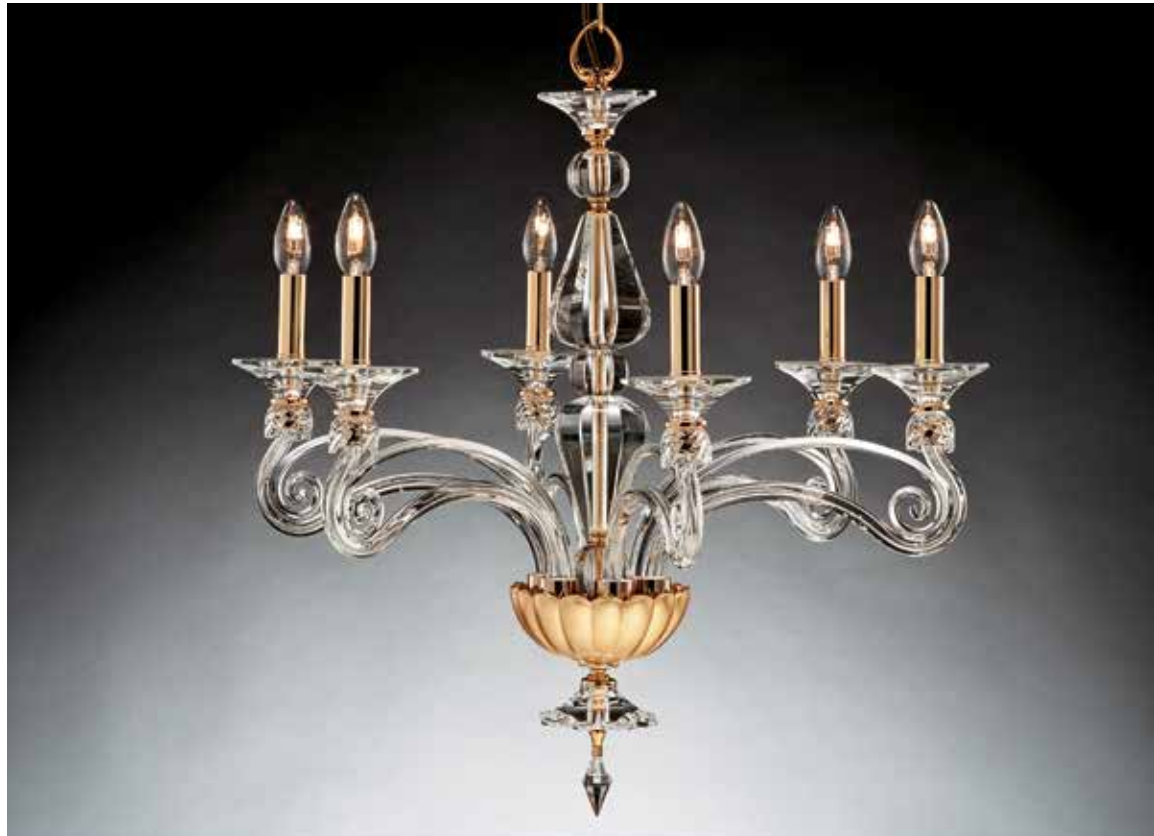
Alessandra/6 foglia oro ø 75 H 75