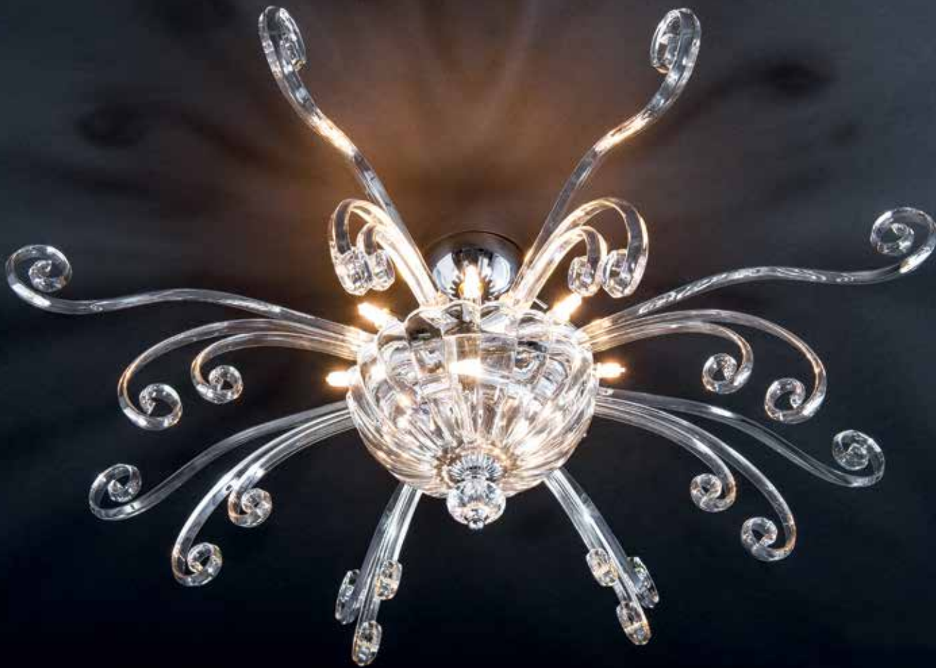
Capri/80 cromo ø 80 H 30 disponibile oro