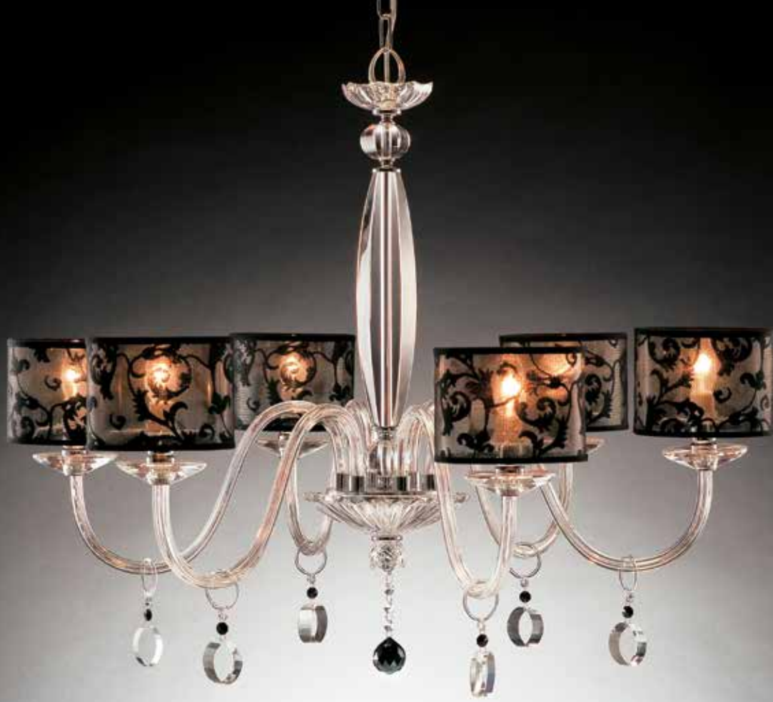
Martina/6 cromo con paralumi NN ø 105 H 85 disponibile oro con paralumi bianco