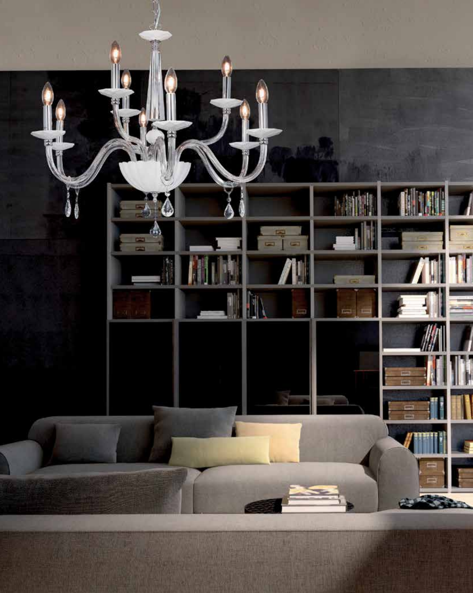
Marò/6+3 cromo bianco ø 82 H 68 disponibile oro cristallo bianco tortora