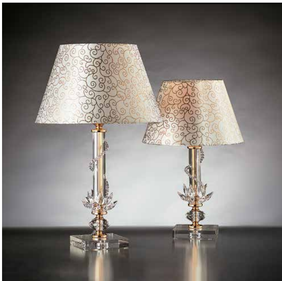
Rosetta/LG oro GALLO ø 36 H 55 Rosetta/LP oro GALLO ø 25 H 45 disponibile cromo