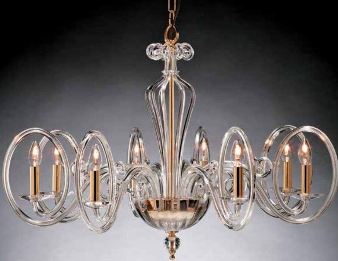
Cassandra/8 oro Ø 110 H 75