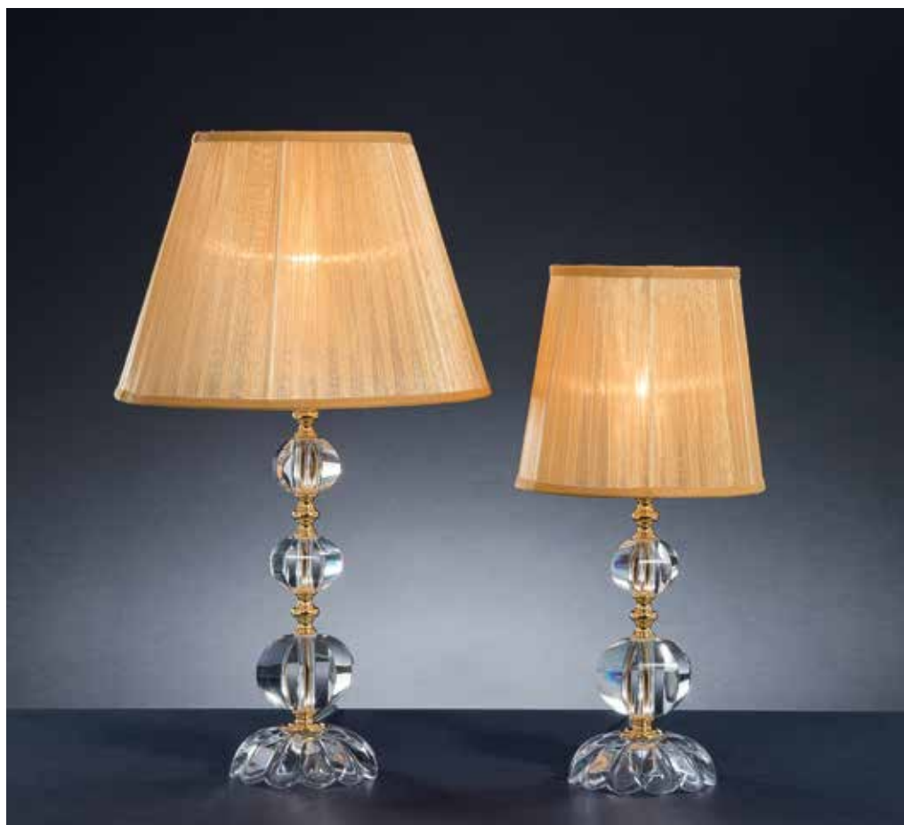
Zeus/LG oro FAS oro ø 30 H 52 Zeus/LP oro FAS oro ø 20 H 42