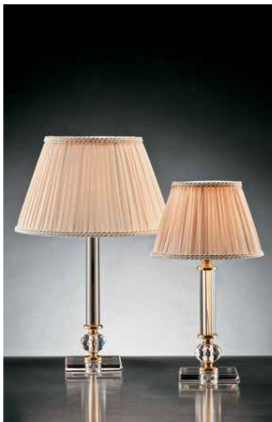
Ada/LG oro IPL Ø 30 H 46 Ada/LP oro IPL Ø 20 H 38