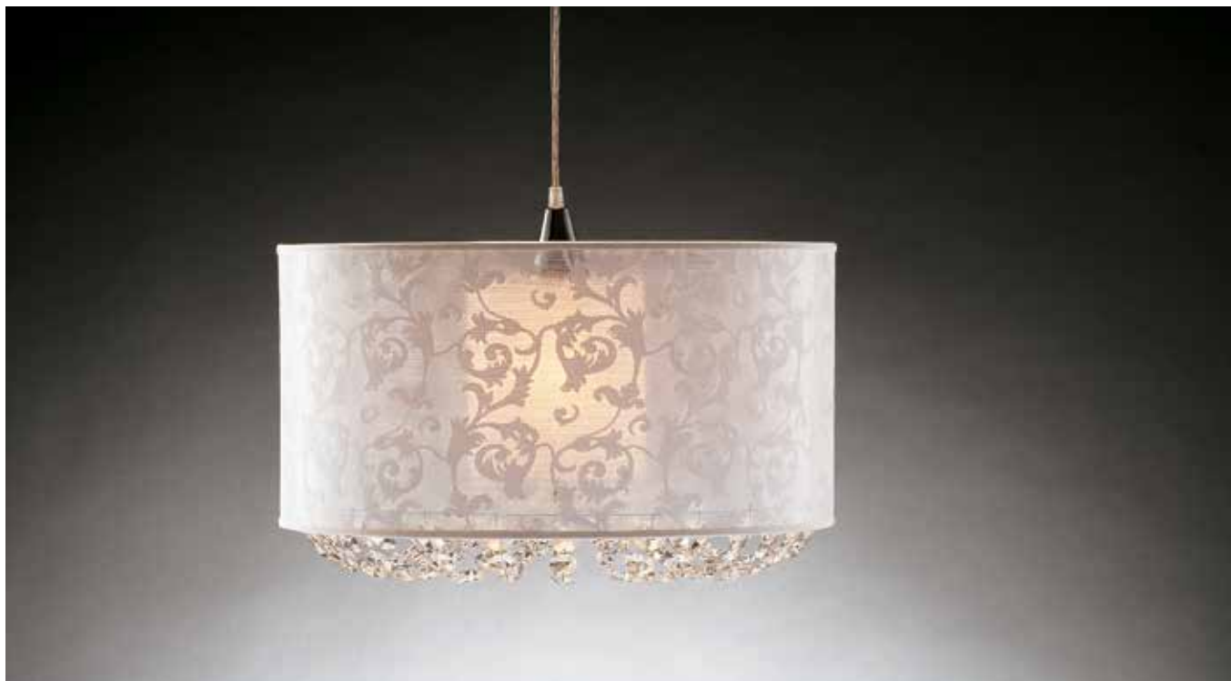
Anastasia/S50 bianco ø 50 H 35