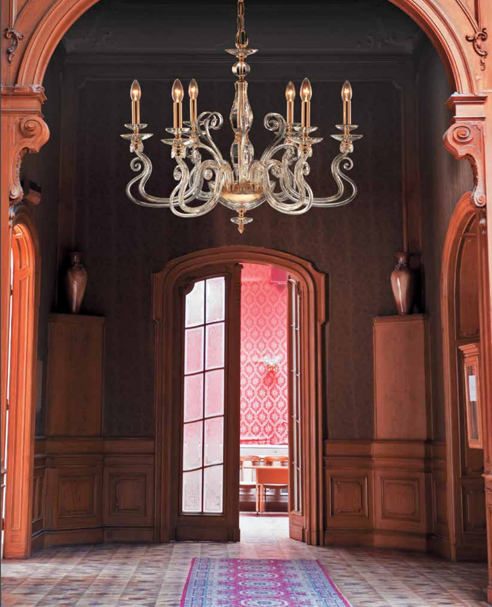
Aurora/6 oro ø 85 H 70 disponibile cromo