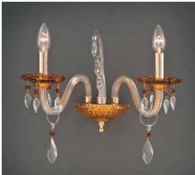
Lisa/AP2 H 34 L 32 SP 25 disponibile cristallo o cromo