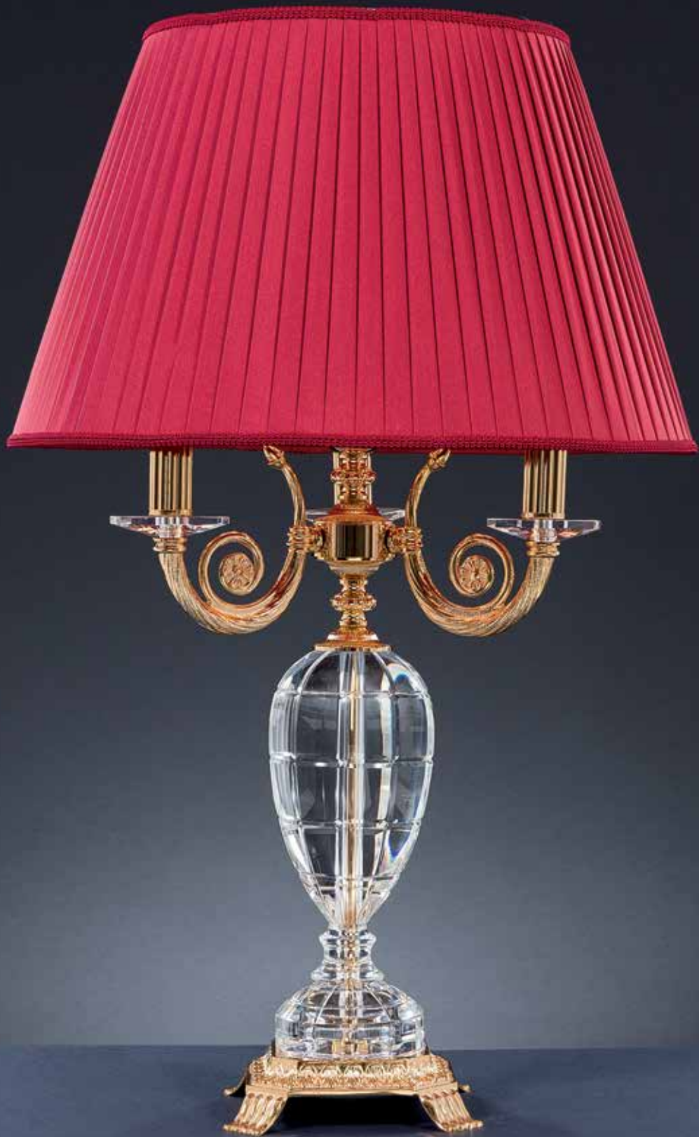
Vulcano/LG oro ø 50 H 78