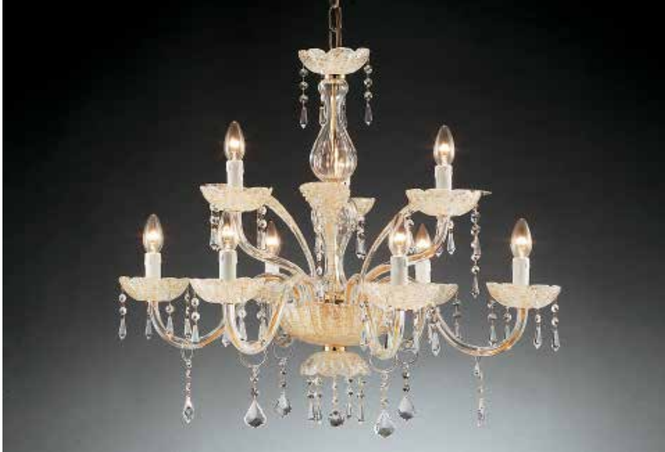
Claudia/6+3 ambra ø 75 H 70 disponibile cristallo