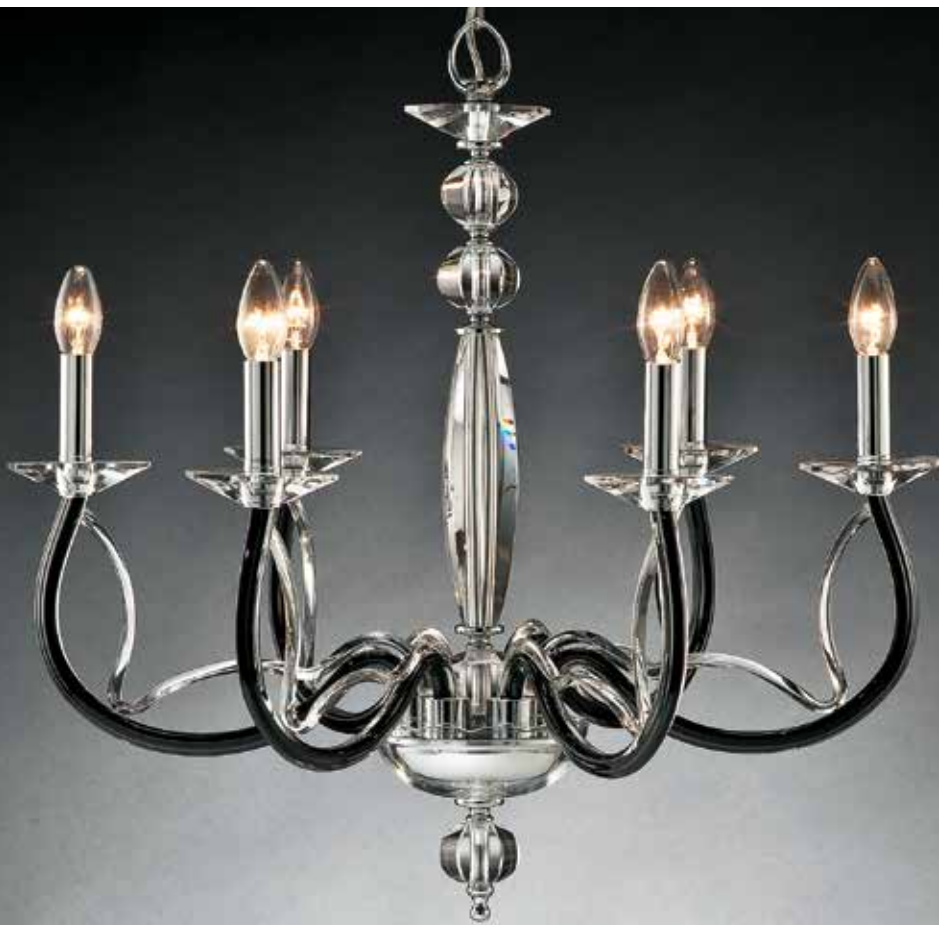
Chiara/6 nero ø 70 H 65