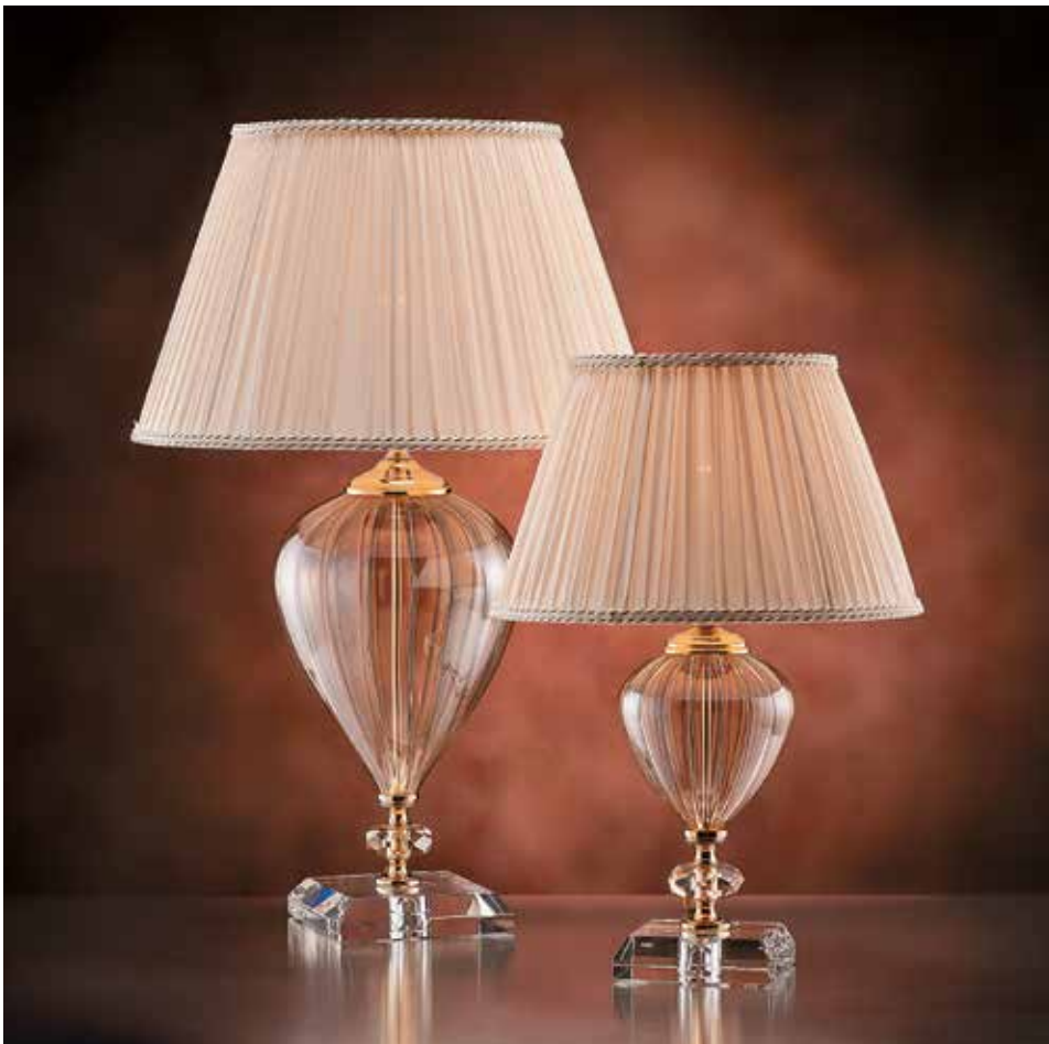
Etrusca/LG oro IPL Ø 40 H 65 Etrusca/LP oro IPL Ø 30 H 45