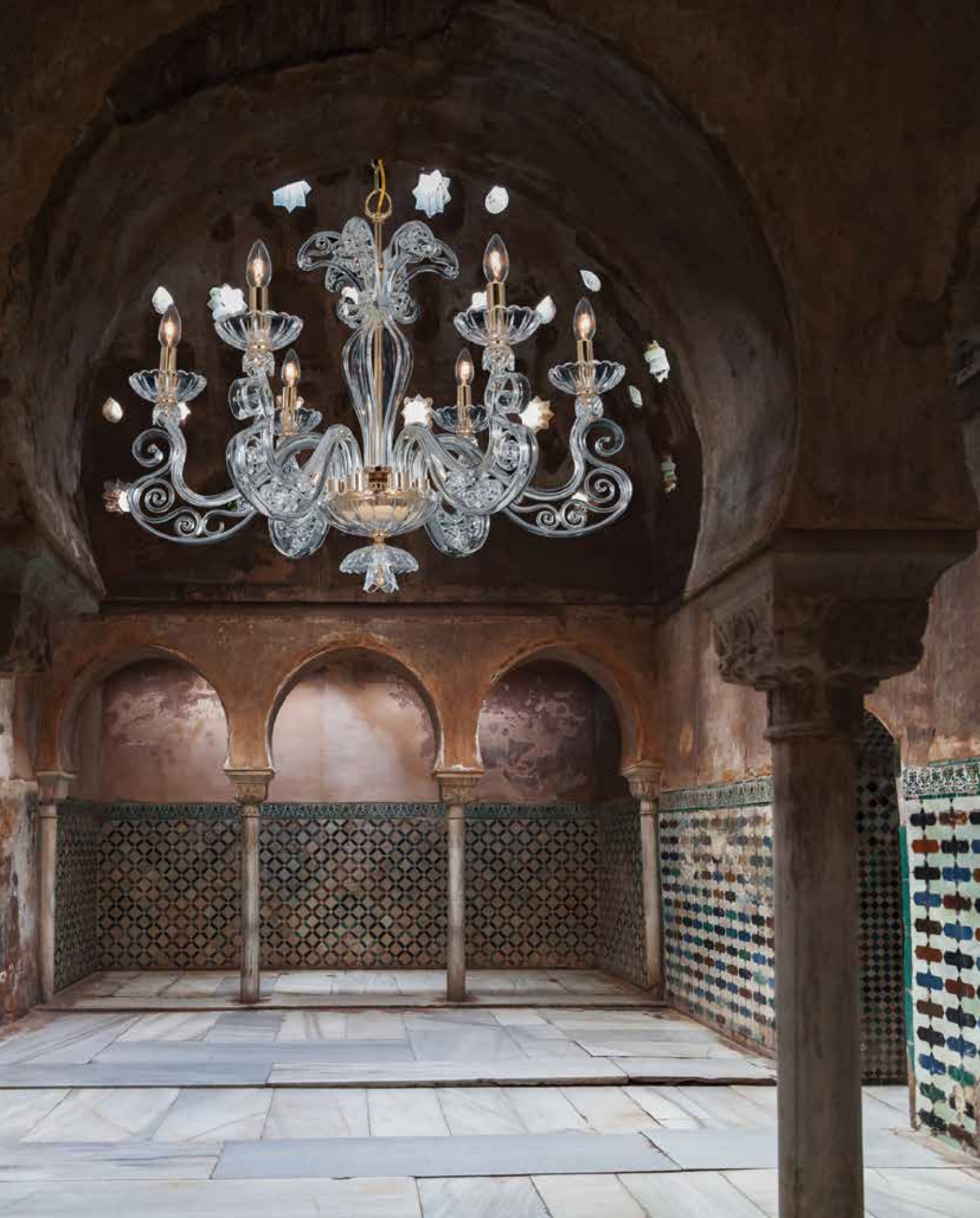
Dafne/6 oro ø 85 H 65 disponibile cromo