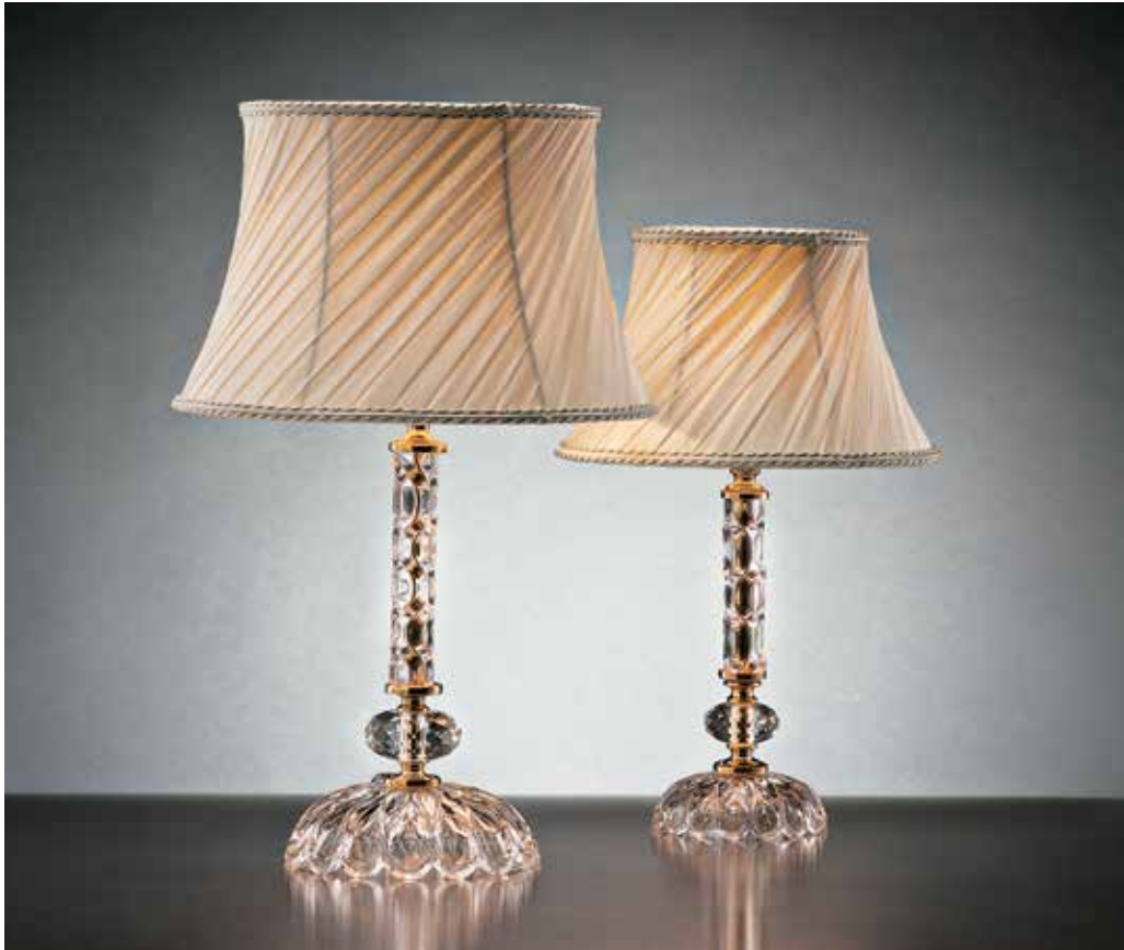
Melissa/LG oro OBL