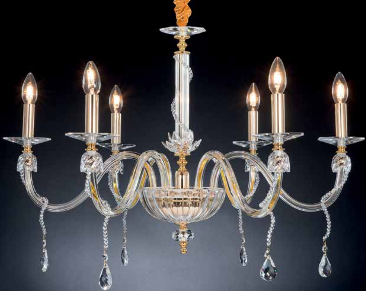
Rosetta/6 Bis oro ø 80 H 55 disponibile cromo