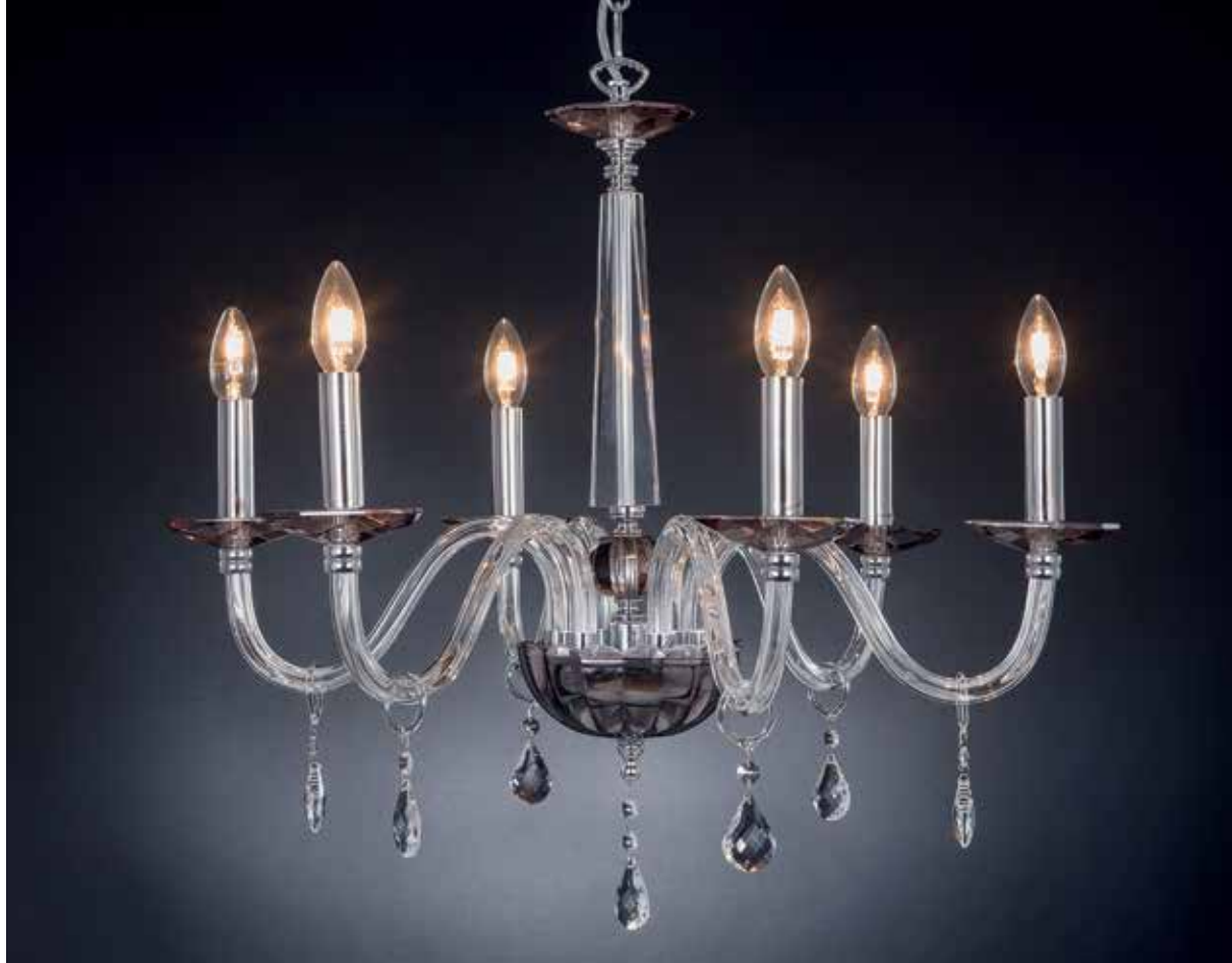
Marò/6 cromo fumè Ø 70 H 60