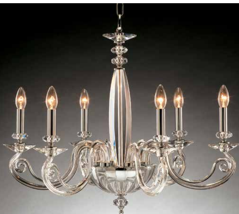
Morena/6 cromo ø 85 H 70 disponibile oro