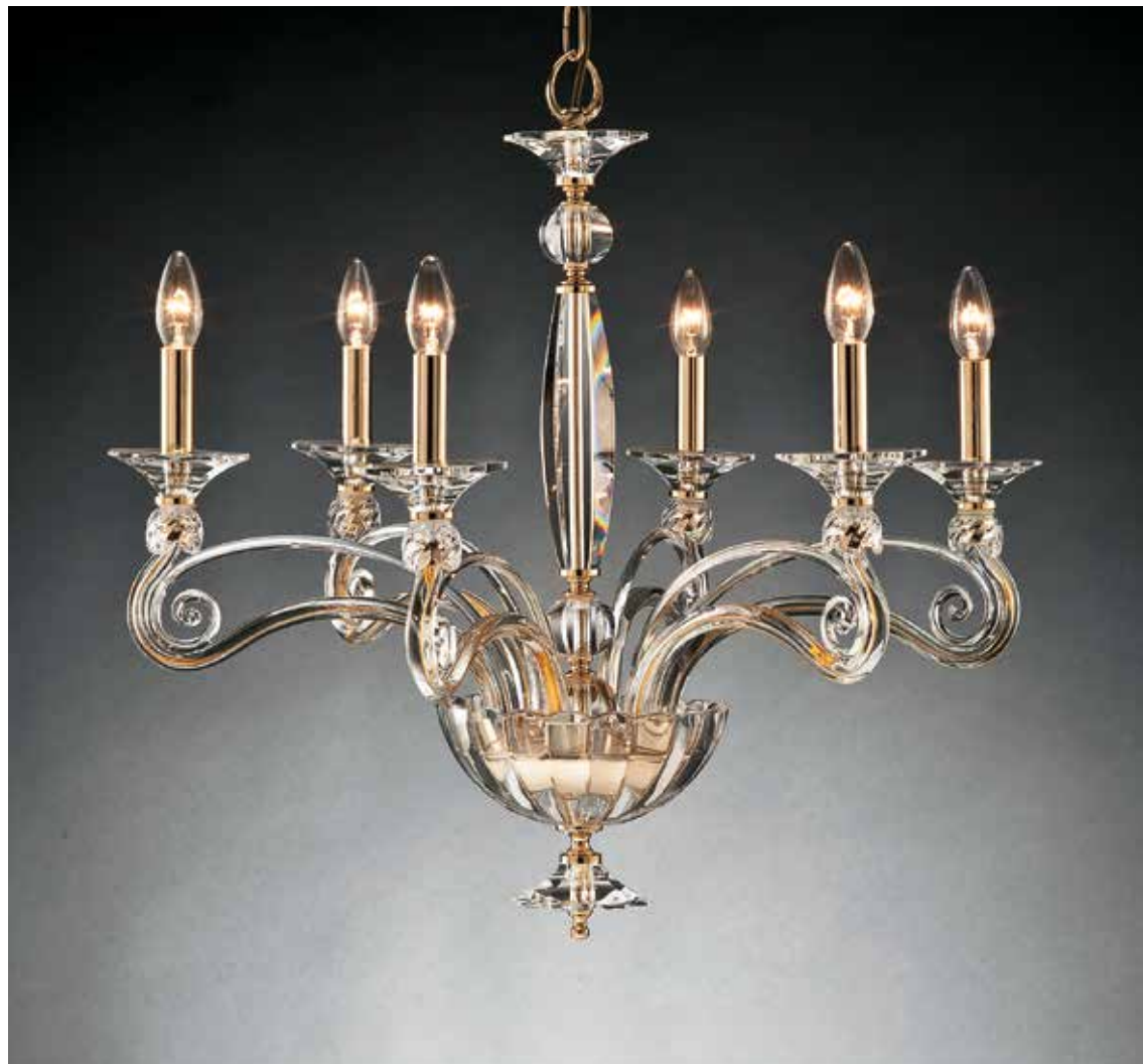
Vanessa/6 oro ø 75 H 65 disponibile cromo