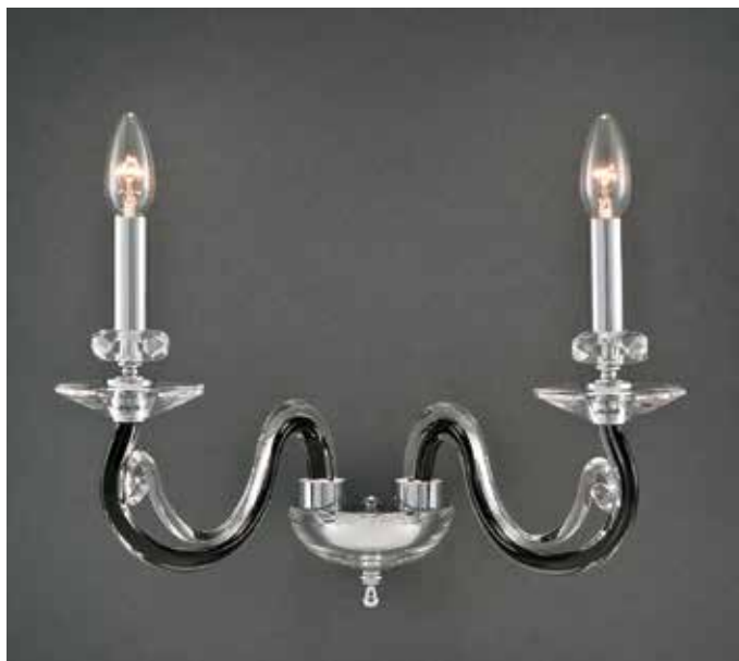
Morena/AP2 nero H 30 L 33 SP 22 disponibile bianco, cristallo, oro o cromo