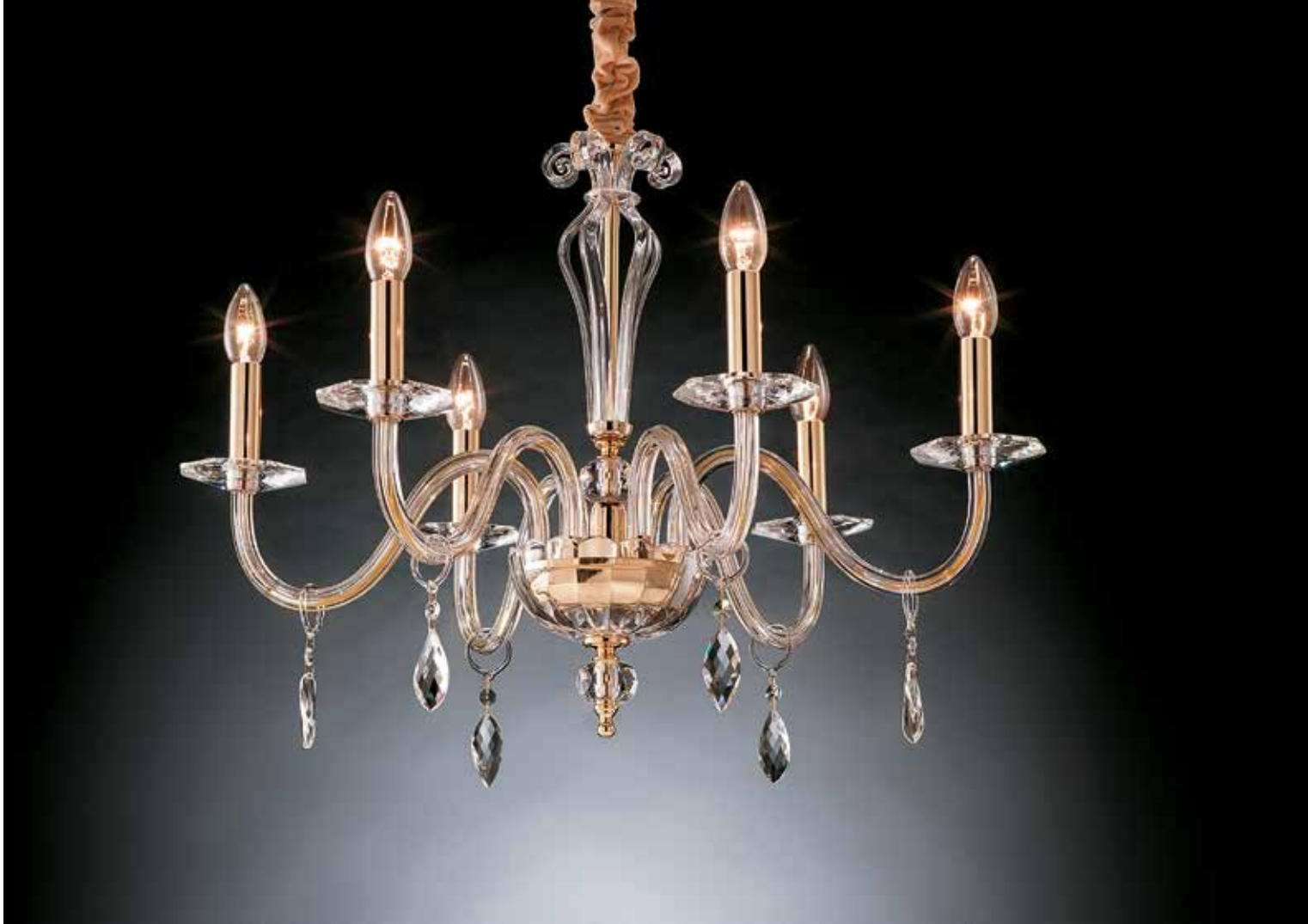
Dany/6 oro ø 68 H 55 disponibile cromo