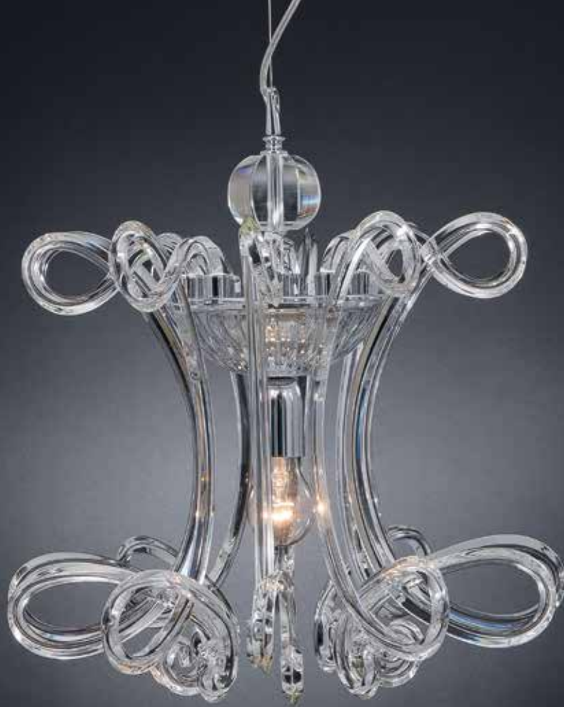
Sandra/10 cromo ø 53 H 50 disponibile oro