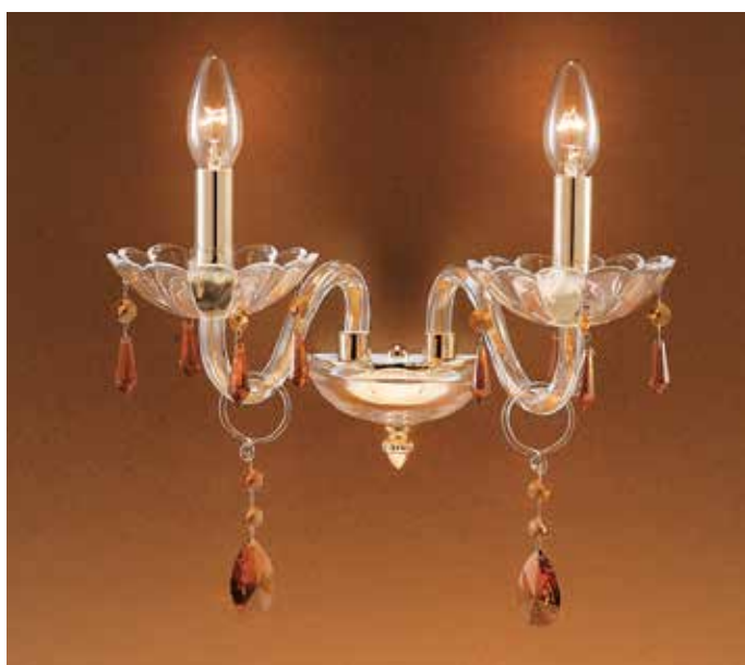
Rossella/A2 oro/ambra H 20 L 35 SP 27