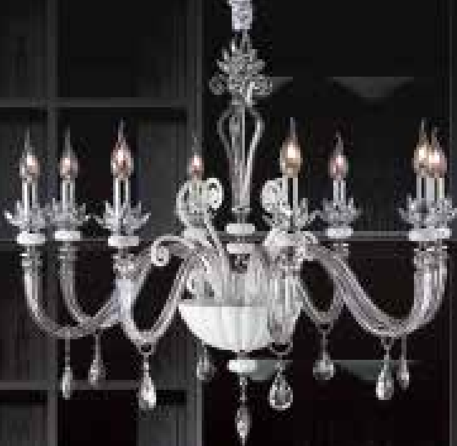
Adriana/8 cromo bianco ø 83 H 70 disponibile oro