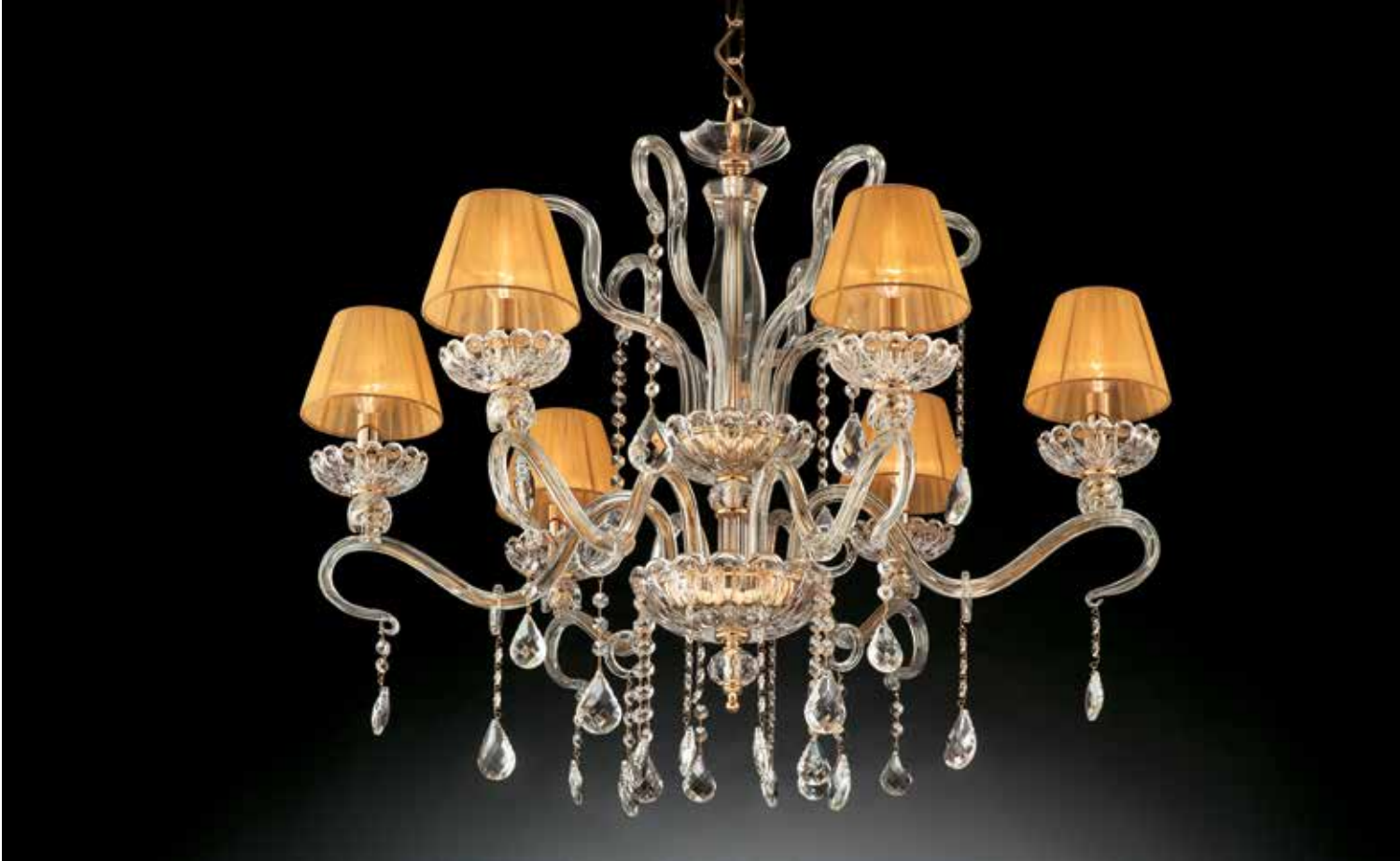
Cassiopea/6 oro ø 82 H 75 disponibile cromo