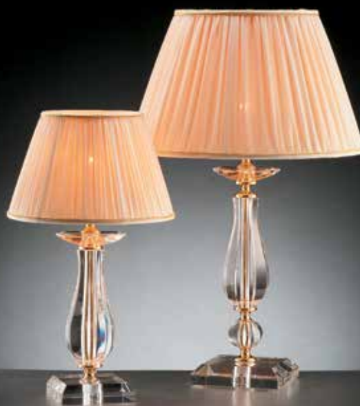
Aurora/LG oro INT ø 36 H 58 Aurora/LP oro INT ø 25 H 43