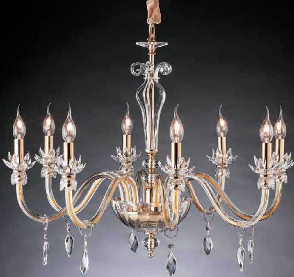
Dany/8 bis oro Ø 82 H 68 disponibile cromo