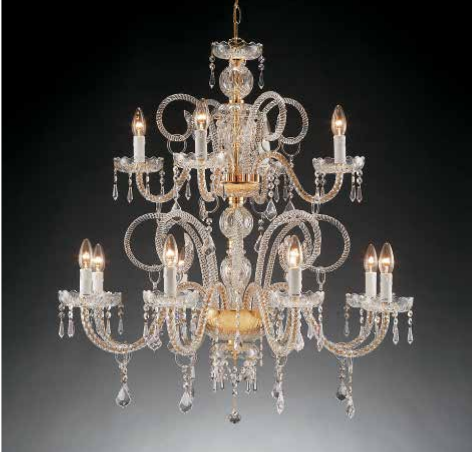
1301/8+4 T ø 85 H 100 disponibile liscio