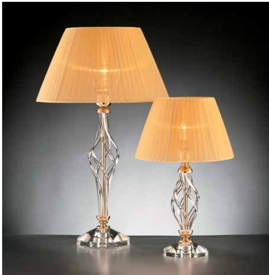
Zuela/LG oro IFAO oro ø 37 H 60 Zuela/LP oro IFAO oro ø 25 H 40 disponibile cromo