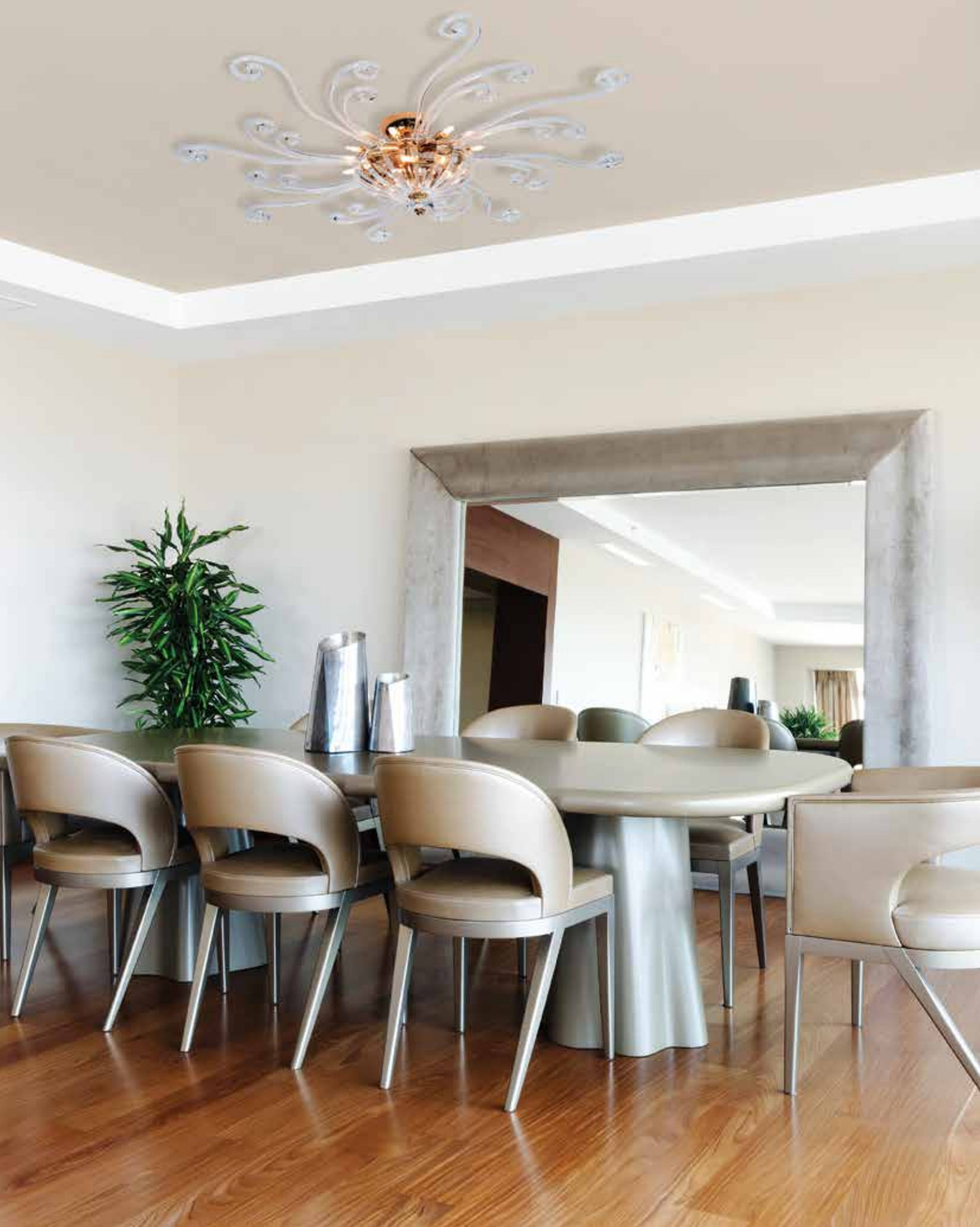
Ischia/80 cristallo oro ø 80 H 30 disponibile cromo