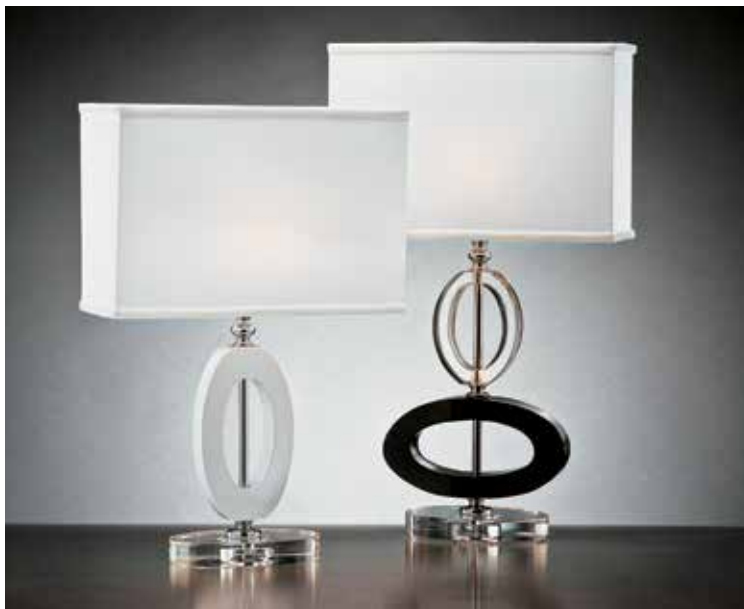
Ovada/LG RT - nero ø 31 H 53 Ovada/LP RT - bianco ø 31 H 47