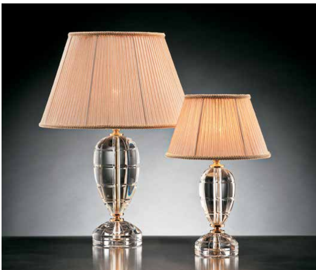
Bologna/ LG oro IPLM Ø 40 H 57 Bologna/ LP oro IPLM Ø 25 H 40