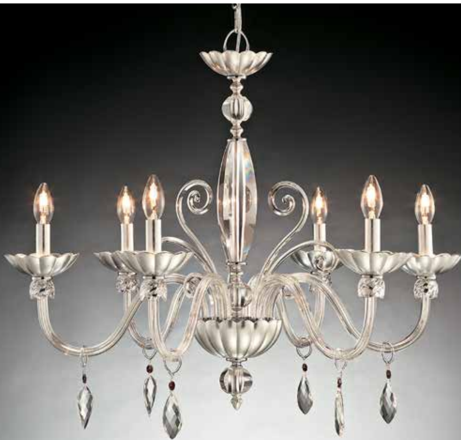
Guenda/6 foglia argento Ø 80 H 65