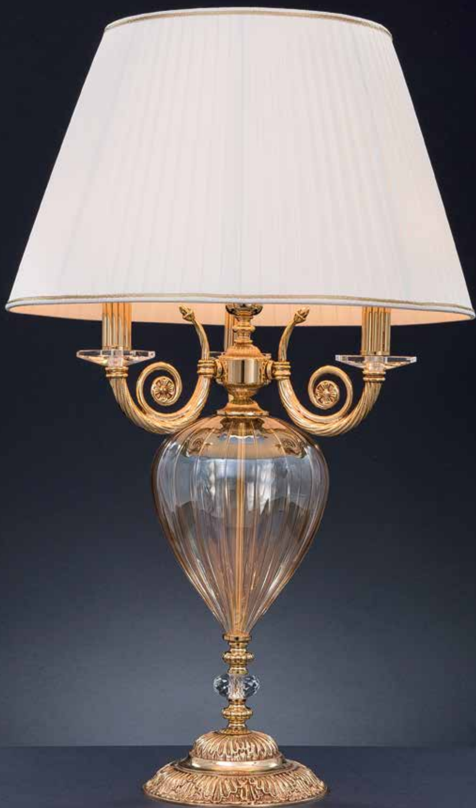
Lipari/LG ambra oro francese ø 50 H 80