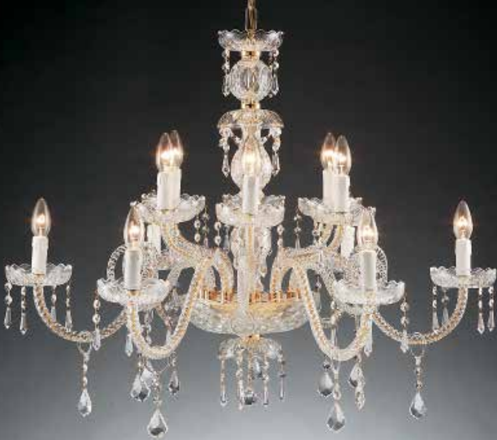
1315/6+6 - T ø 90 H 70 disponibile liscio, oro o cromo