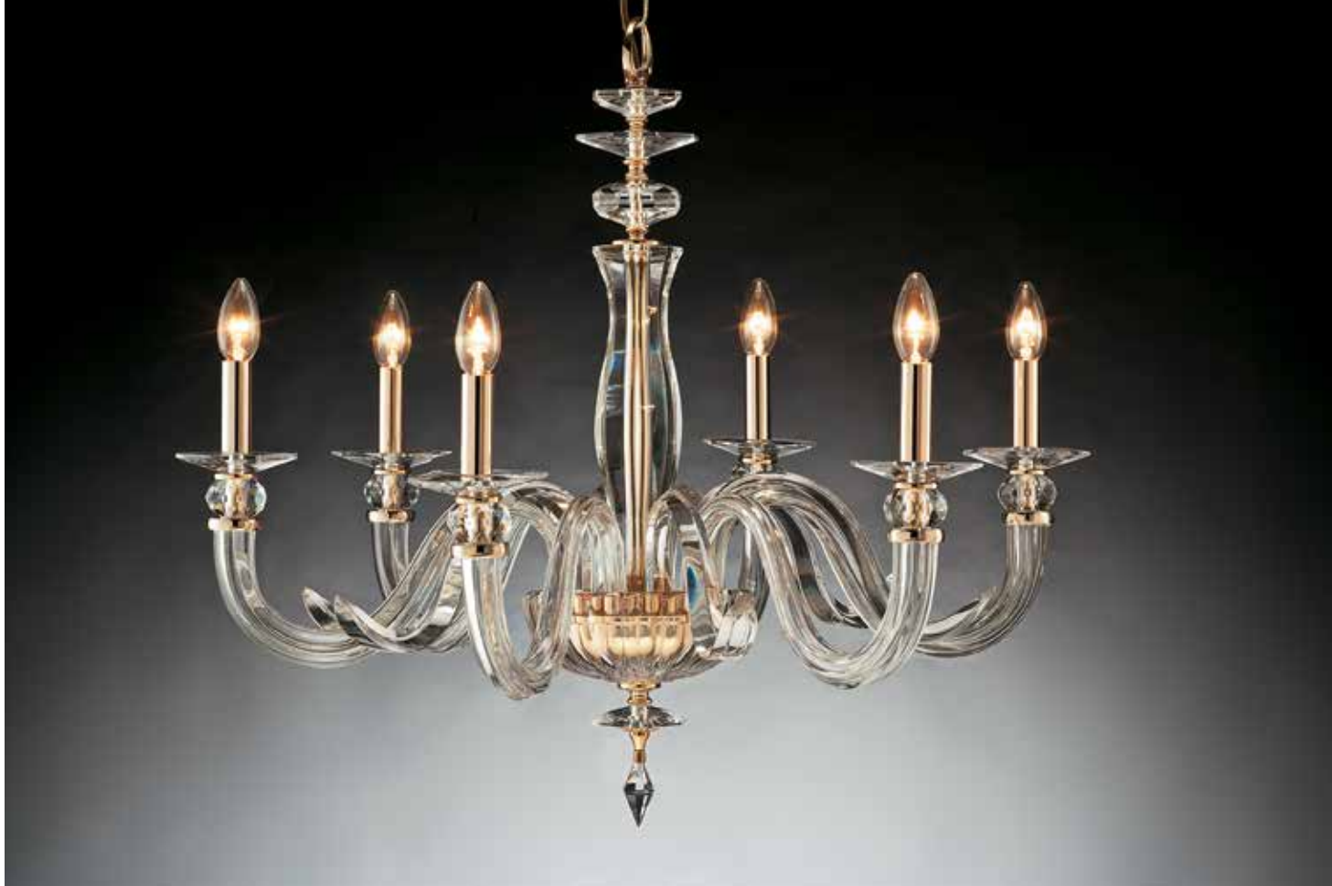
Isotta/6 oro ø 75 H 70 disponibile cromo