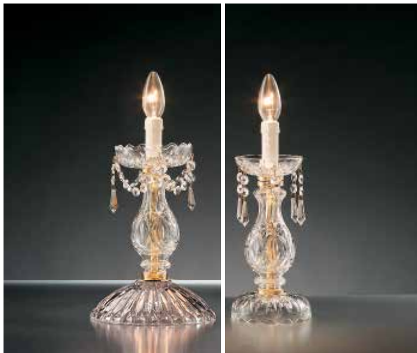
1301/L1 ø 17 H 30 LU100 ø 12 H 30