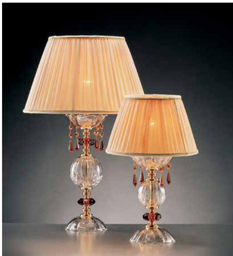
Rossella/LG INT ambra ø 36 H 55 Rossella/LP INT ambra ø 25 H 40