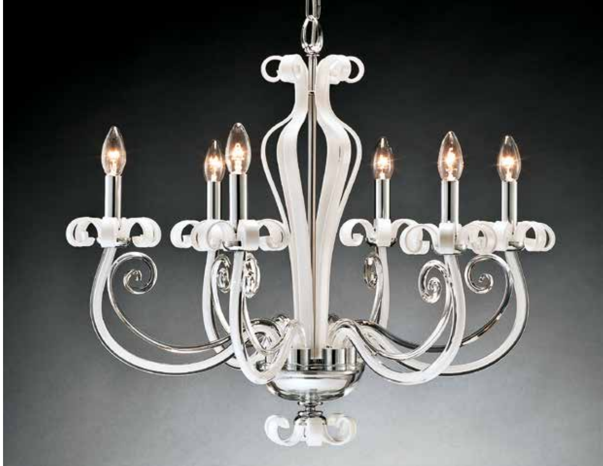
Sandy/6 bianco ø 72 H 65