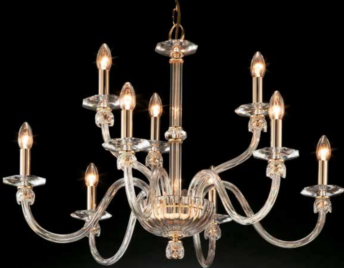
Ada/6+3 oro Ø 85 H 60