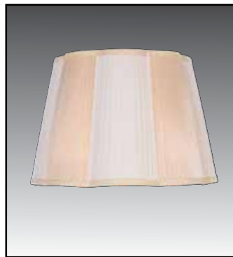
MARGHERITA finitura bianco avorio bicolore