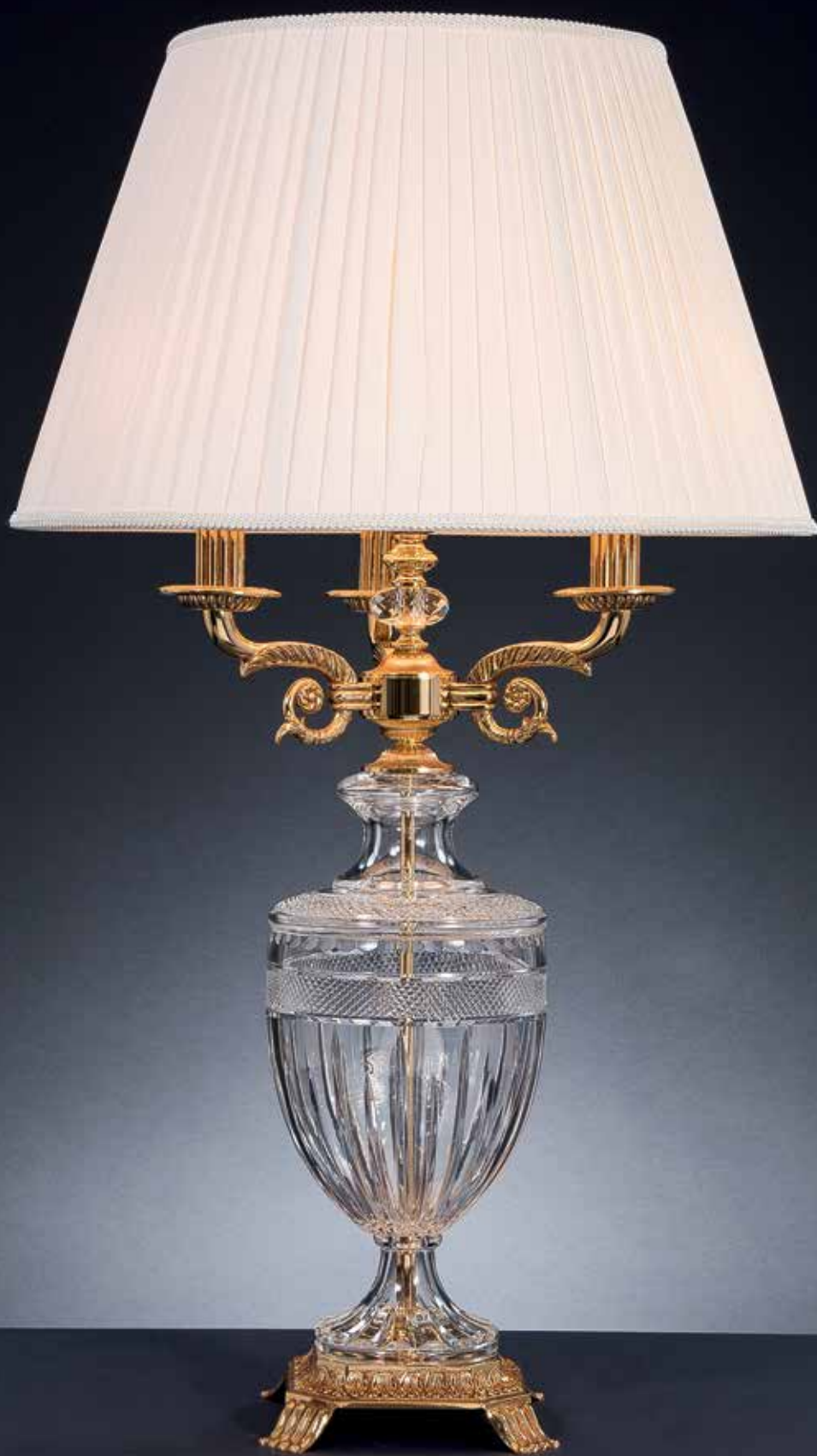
Salina/LG oro francese Ø 50 H 85