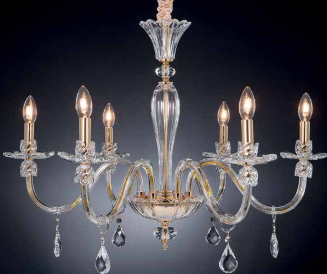
Dalila/6 oro ø 80 H 65 disponibile cromo