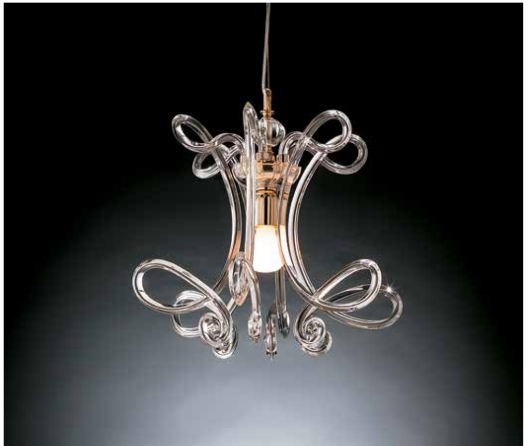
Sandra/S oro ø 45 H 45