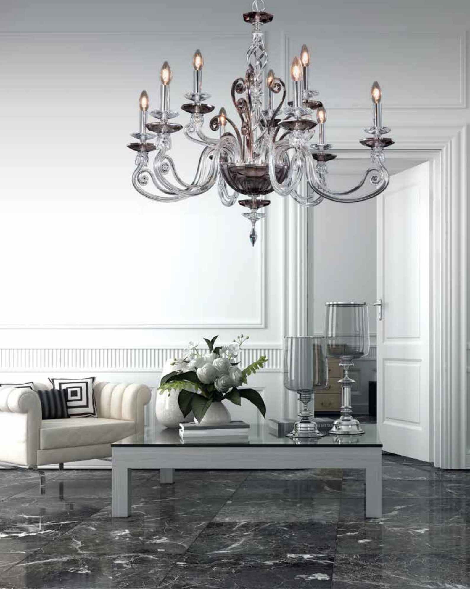
Zuela/6+3 cromo fumè ø 90 H 80 disponibile cromo/oro bianco/tortora