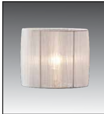
CFAO finitura bianco/avorio/nero/ oro/glicine