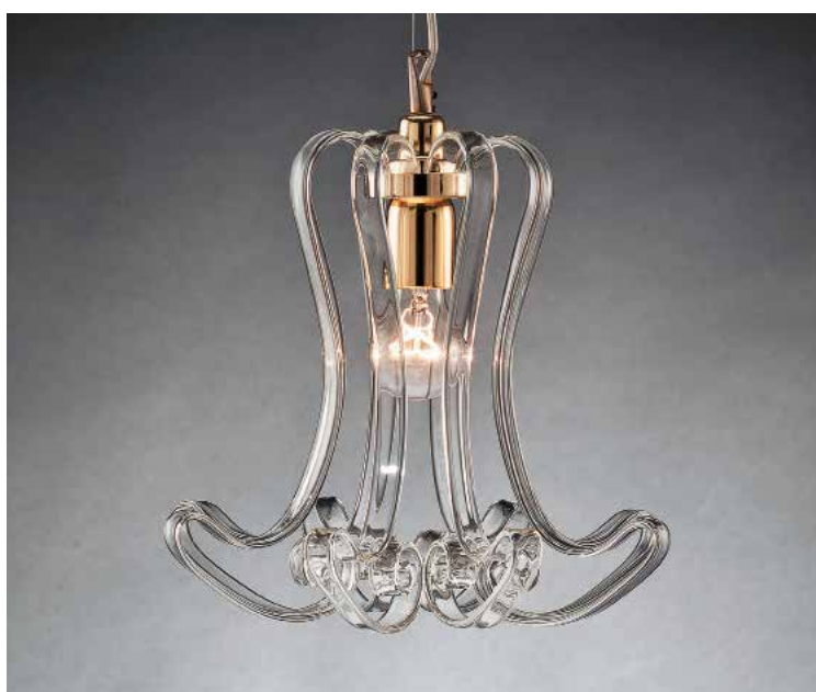
Sara/S oro Ø 35 H 30 disponibile cromo