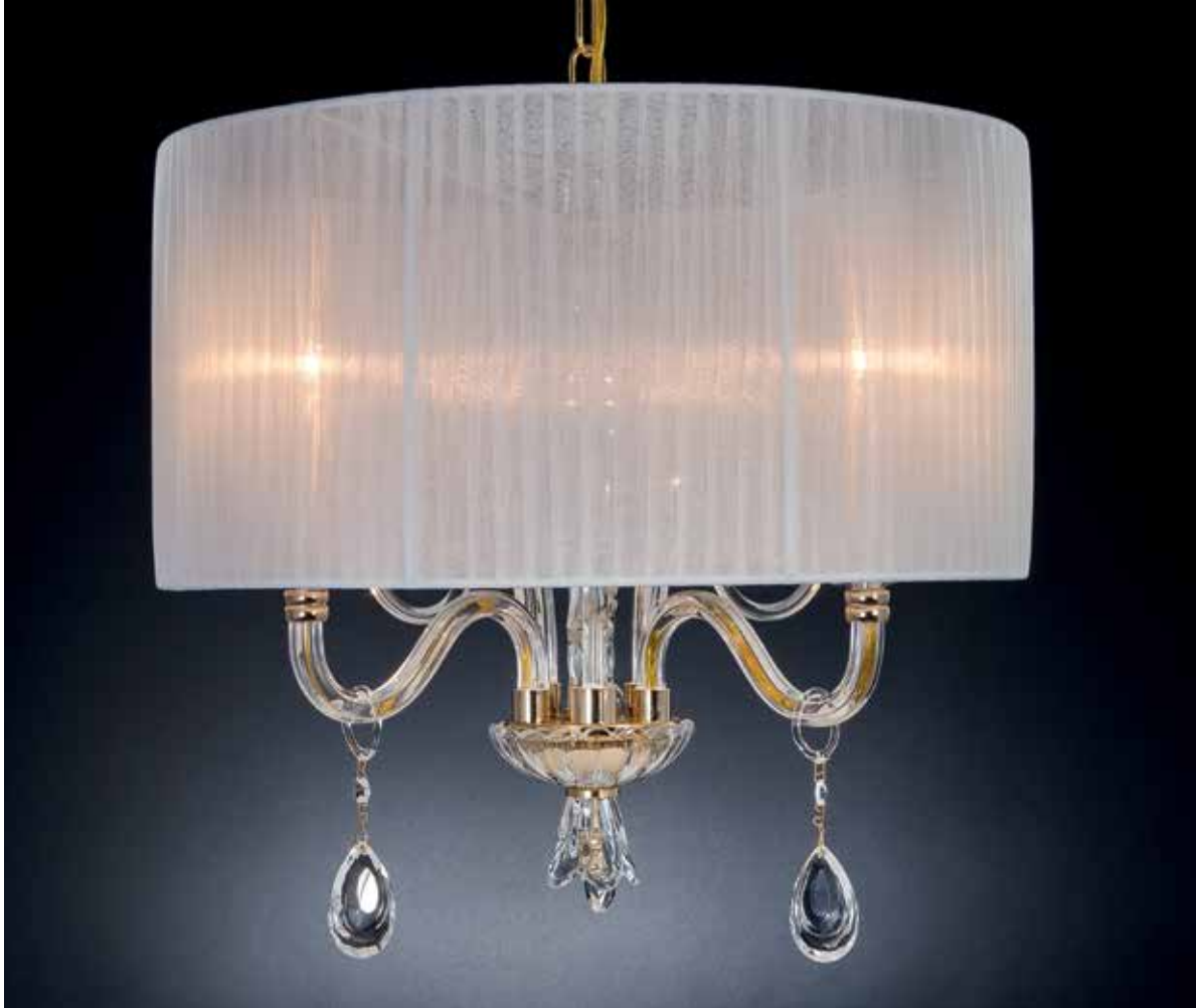
Veive/S oro bianco ø 50 H 48