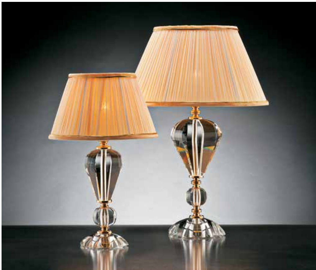
Mantova/LG oro INT Ø 36 H 54 Mantova/LP oro INT Ø 25 H 42