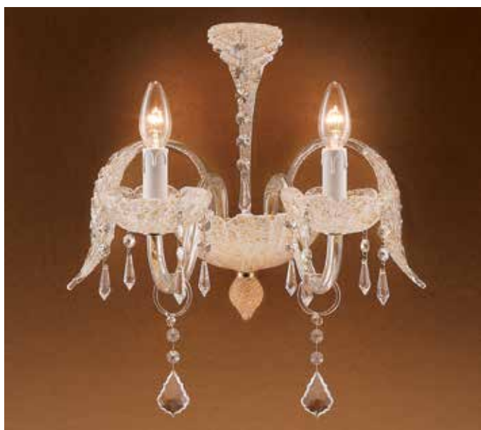
Stefy/A2 ambra H 45 L 37 SP 28