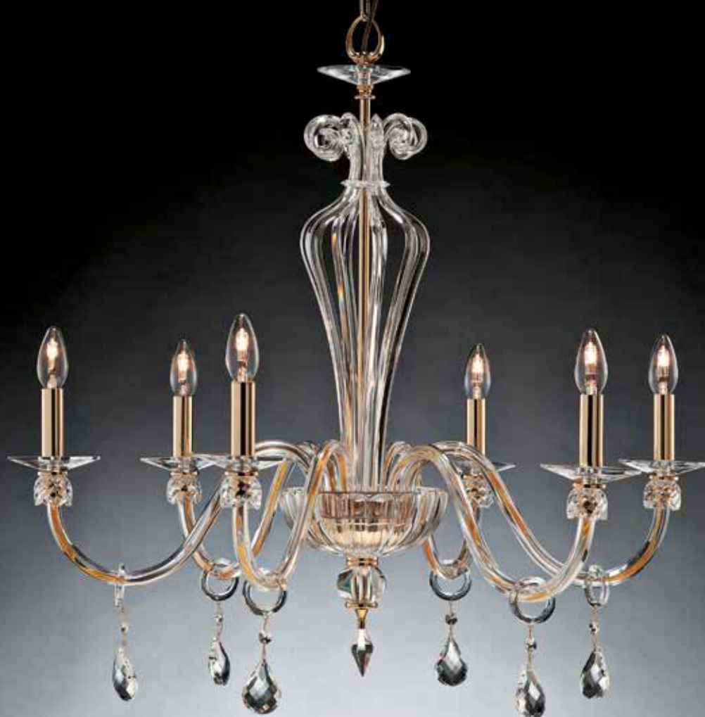
Daria/6 oro ø 80 H 75 disponibile cromo