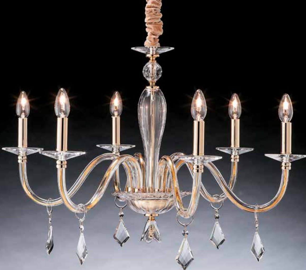
Prisma/6 oro ø 75 H 60 disponibile cromo