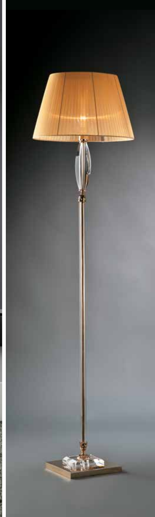
Eleonora/PT oro IFAO oro Ø 45 H 178