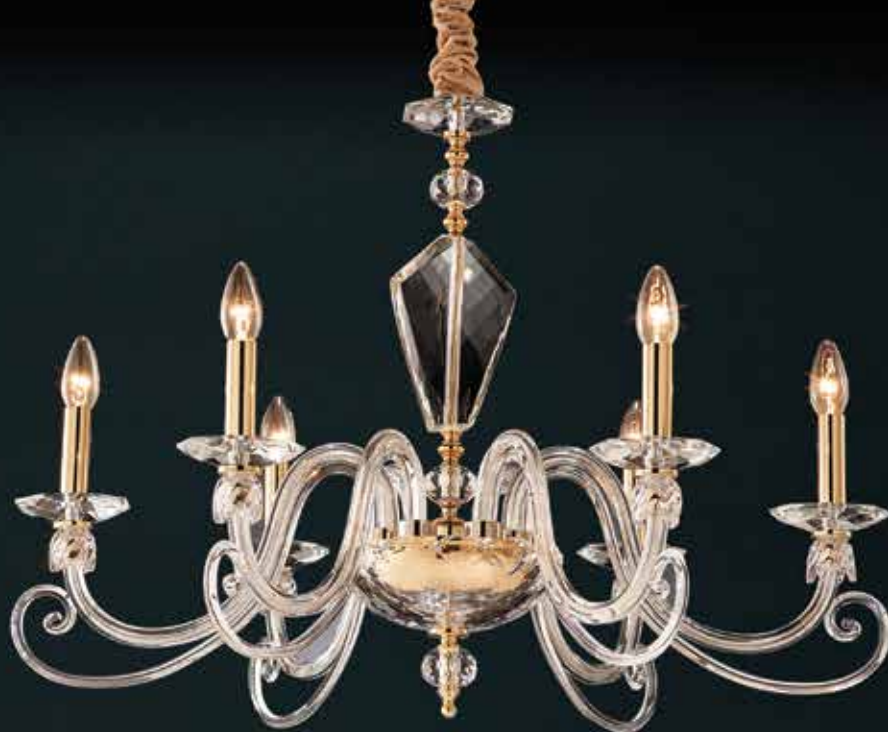
Lilly/6 oro ø 82 H 65 disponibile cromo