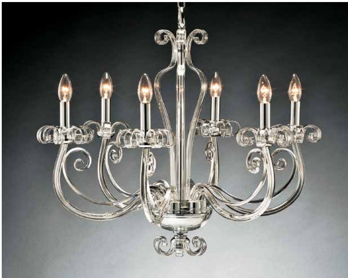
Sandy/6 cromo ø 72 H 65 disponibile oro