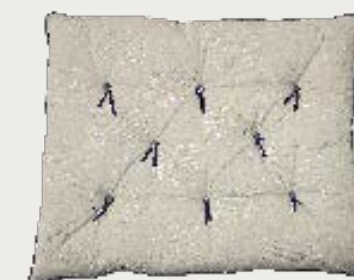
art. A18 105 x 84