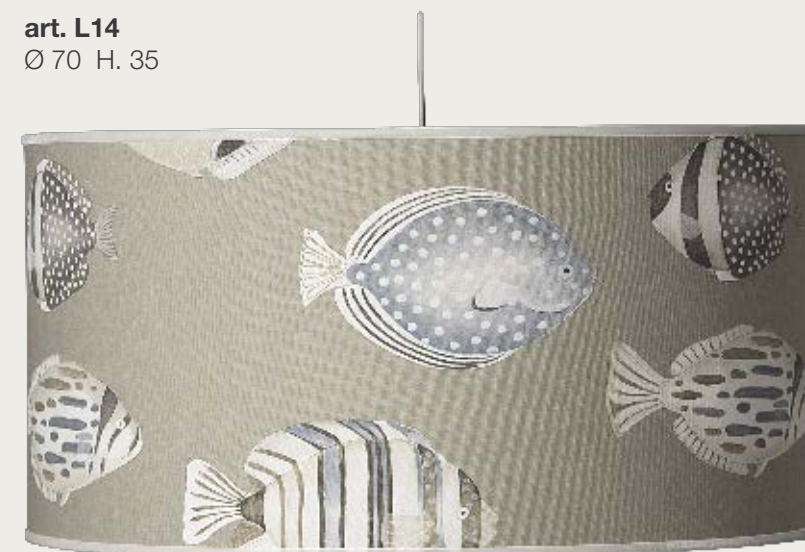
art. L14 Ø 70 H. 35