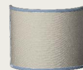
art. L15 25,5 x 20