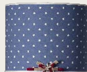
art. L11 Ø 70 H. 35