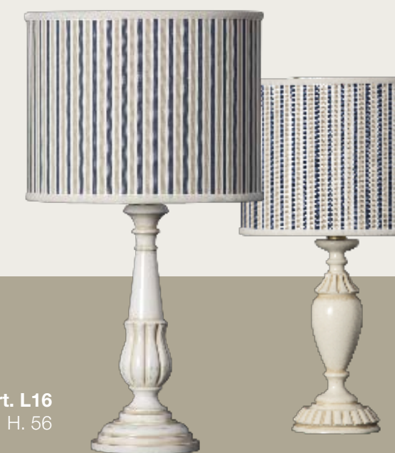
art. L16 Ø 25,5 H. 56