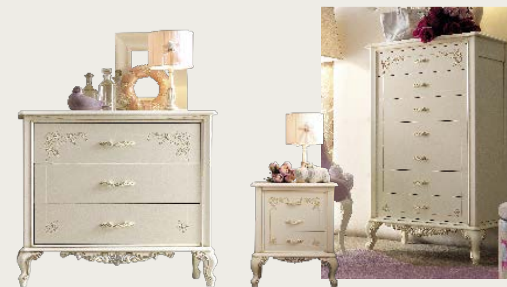
art. 23 C

Armadio 3 ante · 3 doors wardrobe L. 184 P. 61 H. 213