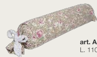
art. A24 L. 110 Ø 20