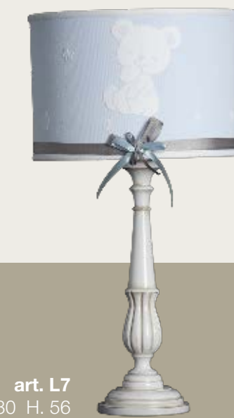
art. L7 Ø 30 H. 56