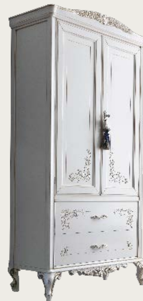
art. 20 B

Letto tessuto K55 · Bed fabric K55 L. 142 P. 210 H. 138 - (120 x 200)