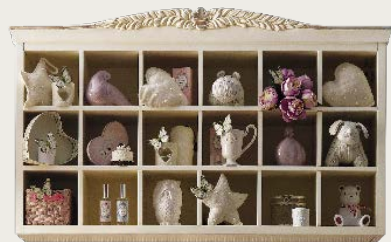
art. 16 C Teca · Showcase L. 108 P. 32 H. 76