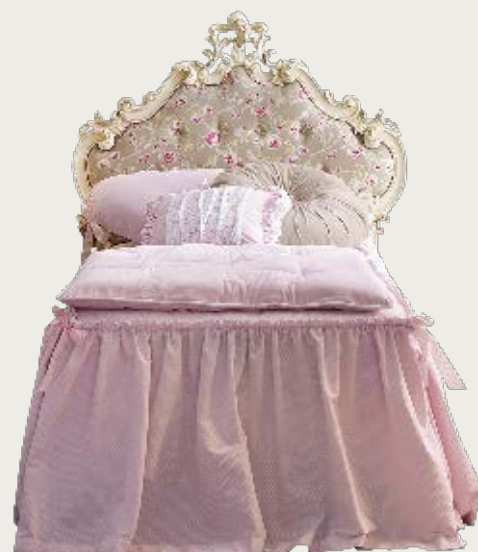
art. 11 C

Letto tessuto K50 · Bed fabric K50 L. 113 P. 212 H. 135 - (90 x 200)