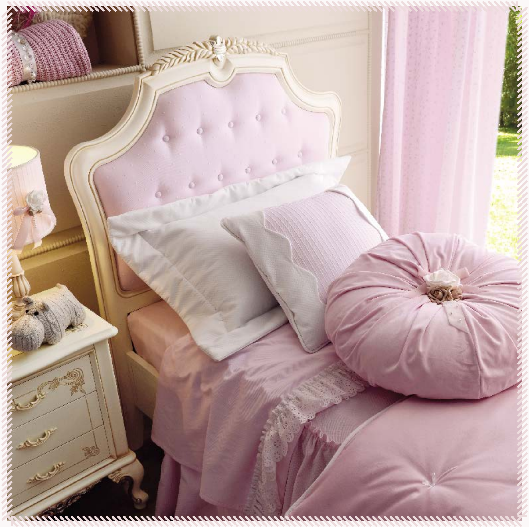
art. 14 C