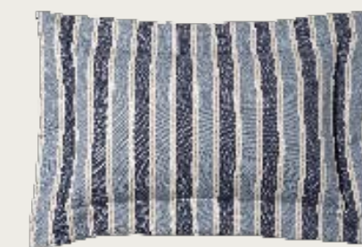
art. A19 98 x 68