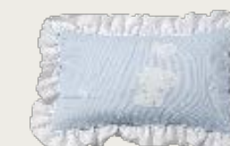
art. A11 60 x 37