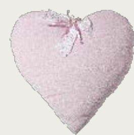
art. A22 60 x 65