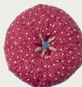
art. A16 Ø 60