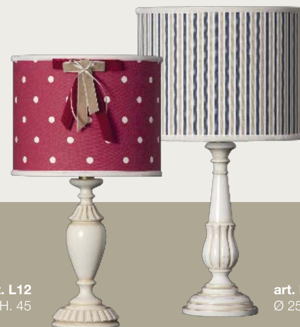
art. L12 Ø 25,5 H. 45