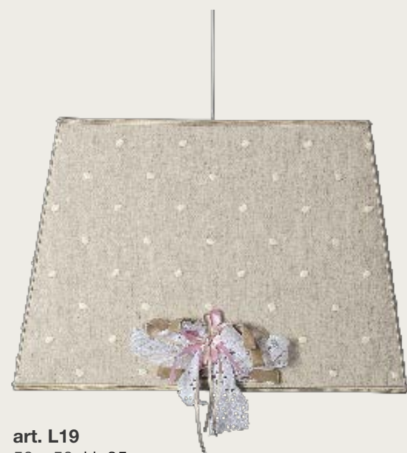
art. L19 50 x 50 H. 35