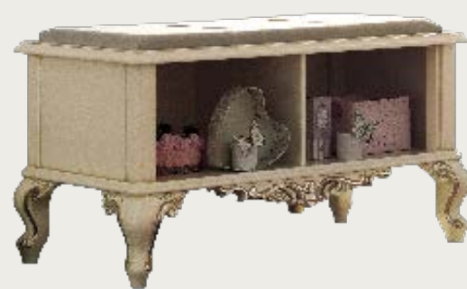
art. 29 C Panchetta in tessuto K58 · Bench in fabric K58 L. 102 P. 46 H. 55