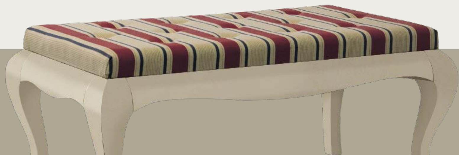
art. 1170 C Panchetta in tessuto K54 Bench in fabric K54 L. 114 P. 53 H. 45