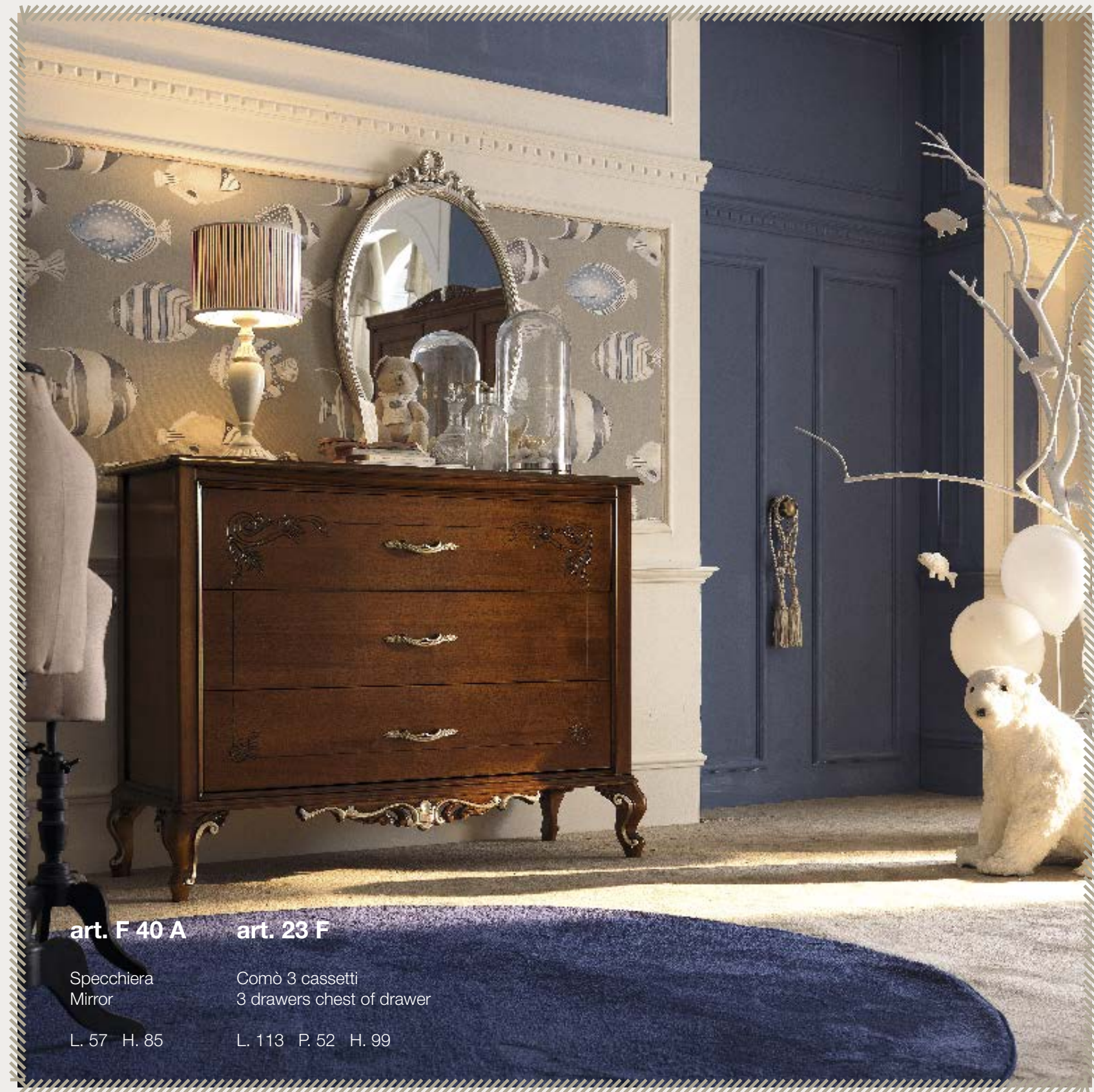
art. F 40 A