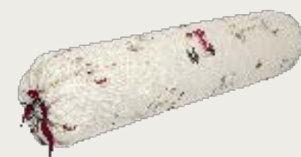
art. A13 L. 100 Ø 20