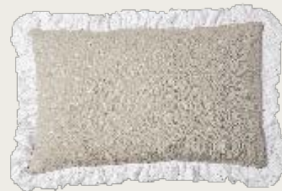
art. A23 88 x 60