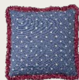
art. A15 53 x 53