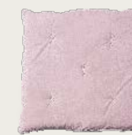
art. A2 90 x 90