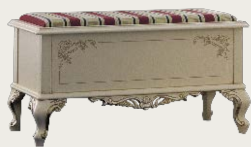
art. 28 C Panchetta chiusa in tessuto K54 Closed bench in fabric K54 L. 102 P. 46 H. 54