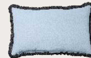
art. A7 83 x 52