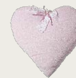
art. A22 60 x 65