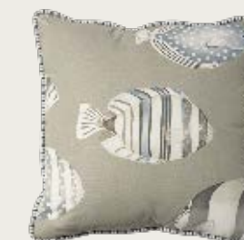
art. A20 48 x 48