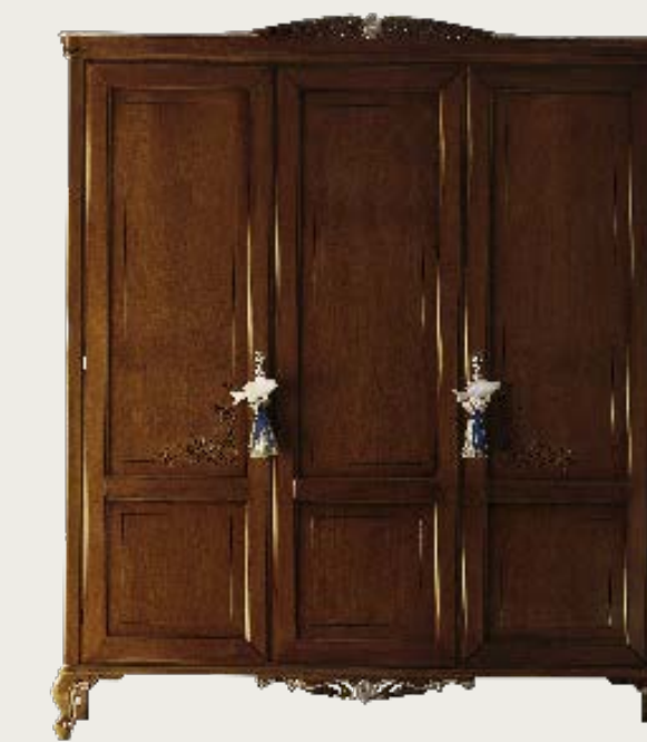
art. 22 F

Armadio 2 ante · 2 doors wardrobe L. 126 P. 61 H. 213