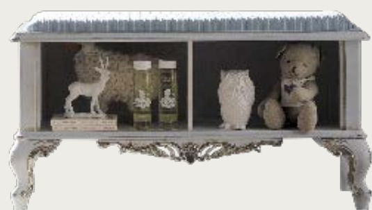
art. 58 B Panchetta in tessuto K52 · Bench in fabric K52 L. 102 P. 46 H. 55