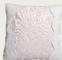
art. A4 48 x 48