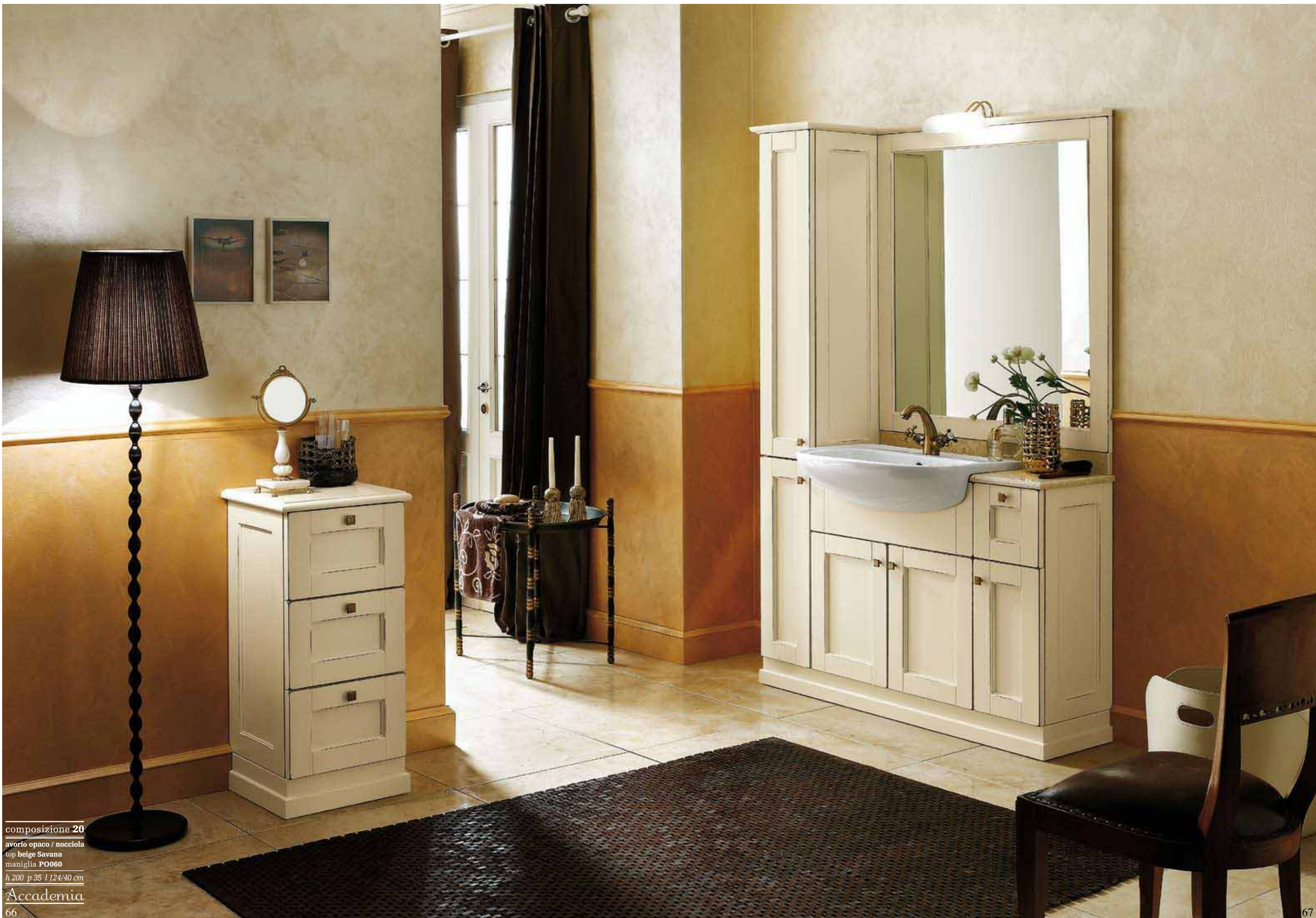
composizione 20 avorio opaco / nocciola top beige Savana maniglia PO060