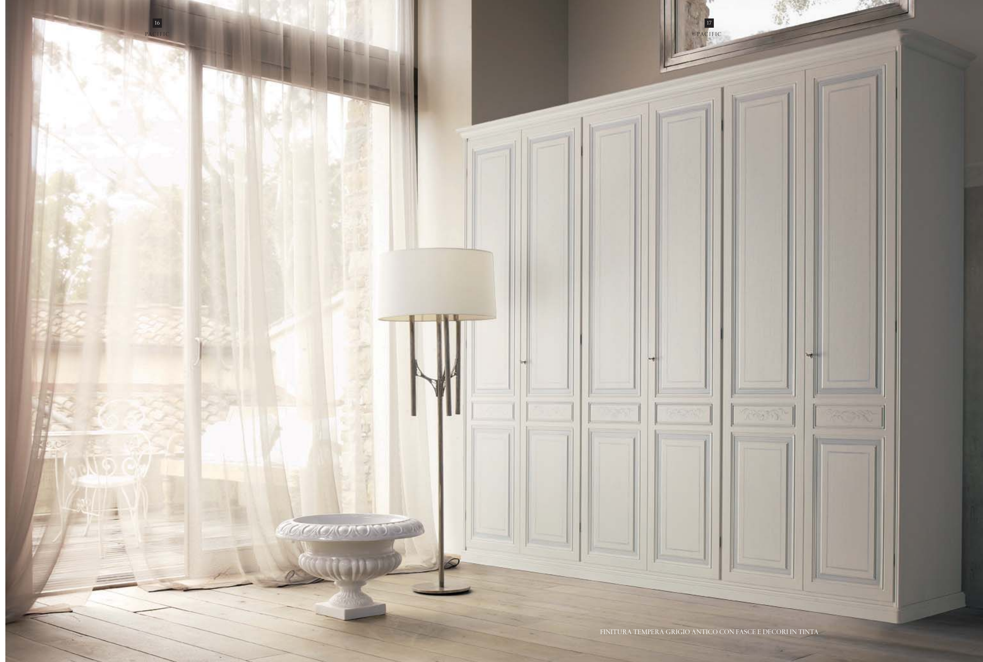
FINITURA TEMPERA GRIGIO ANTICO CON FASCE E DECORI IN TINTA