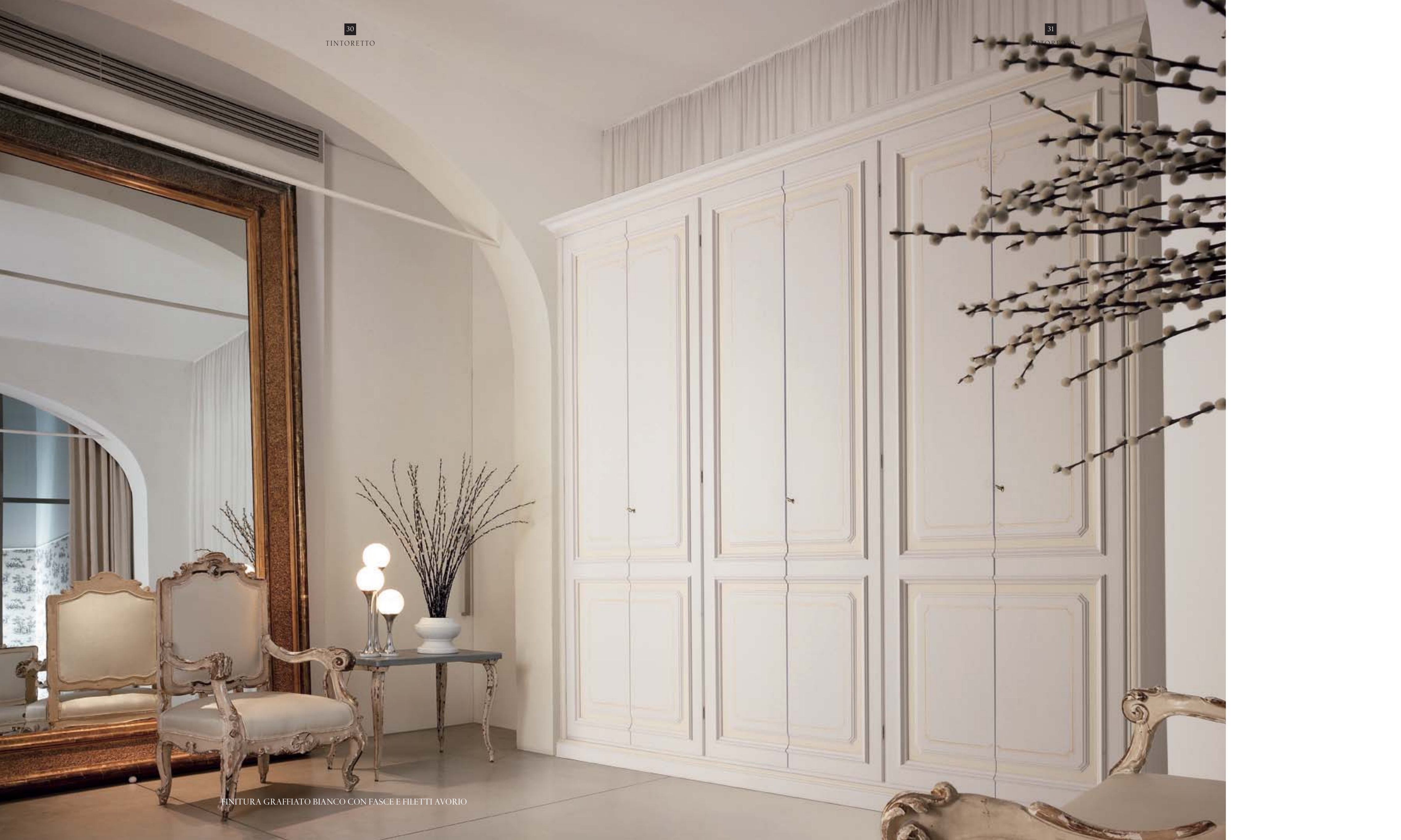
FINITURA GRAFFIATO BIANCO CON FASCE E FILETTI AVORIO