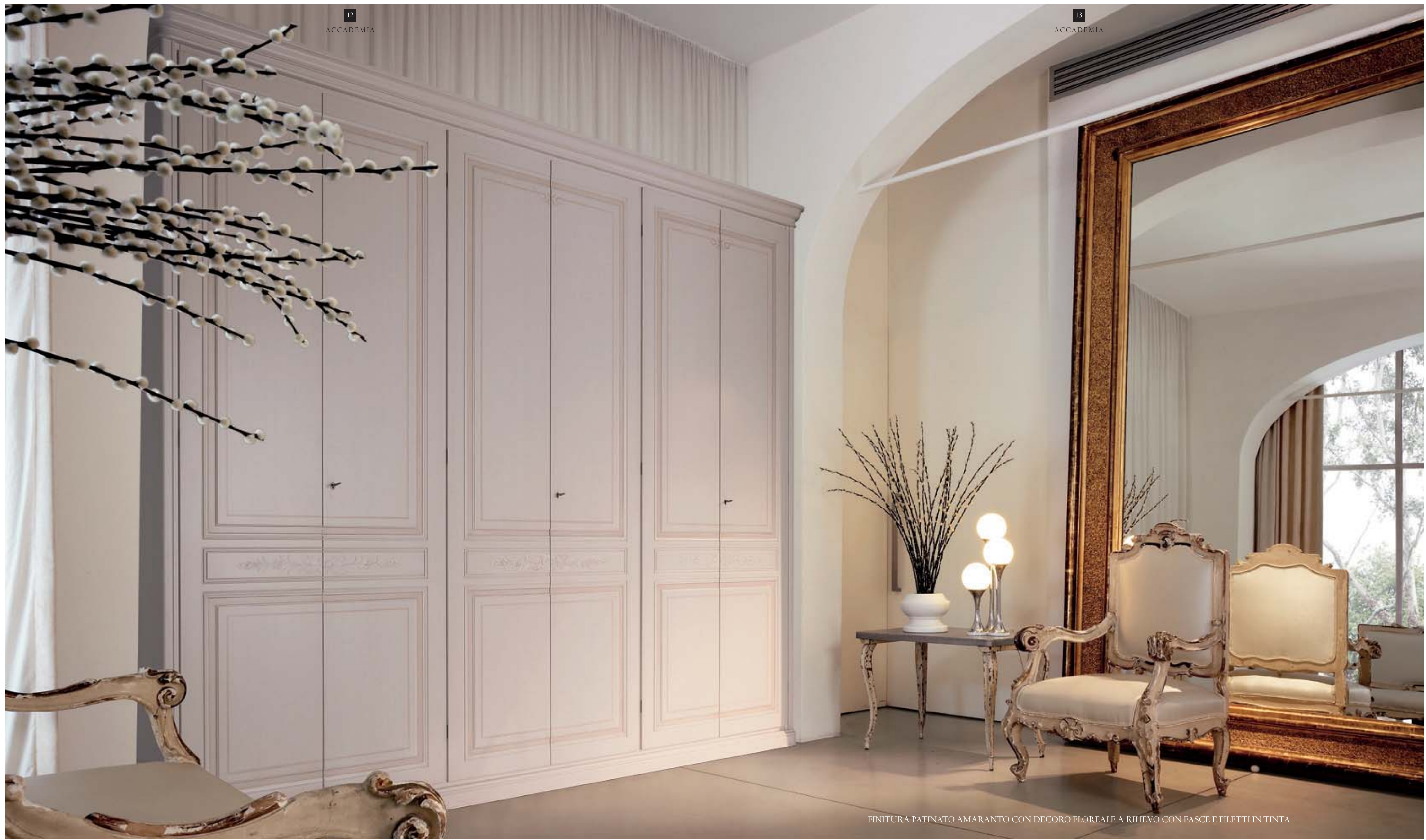
FINITURA PATINATO AMARANTO CON DECORO FLOREALE A RILIEVO CON FASCE E FILETTI IN TINTA