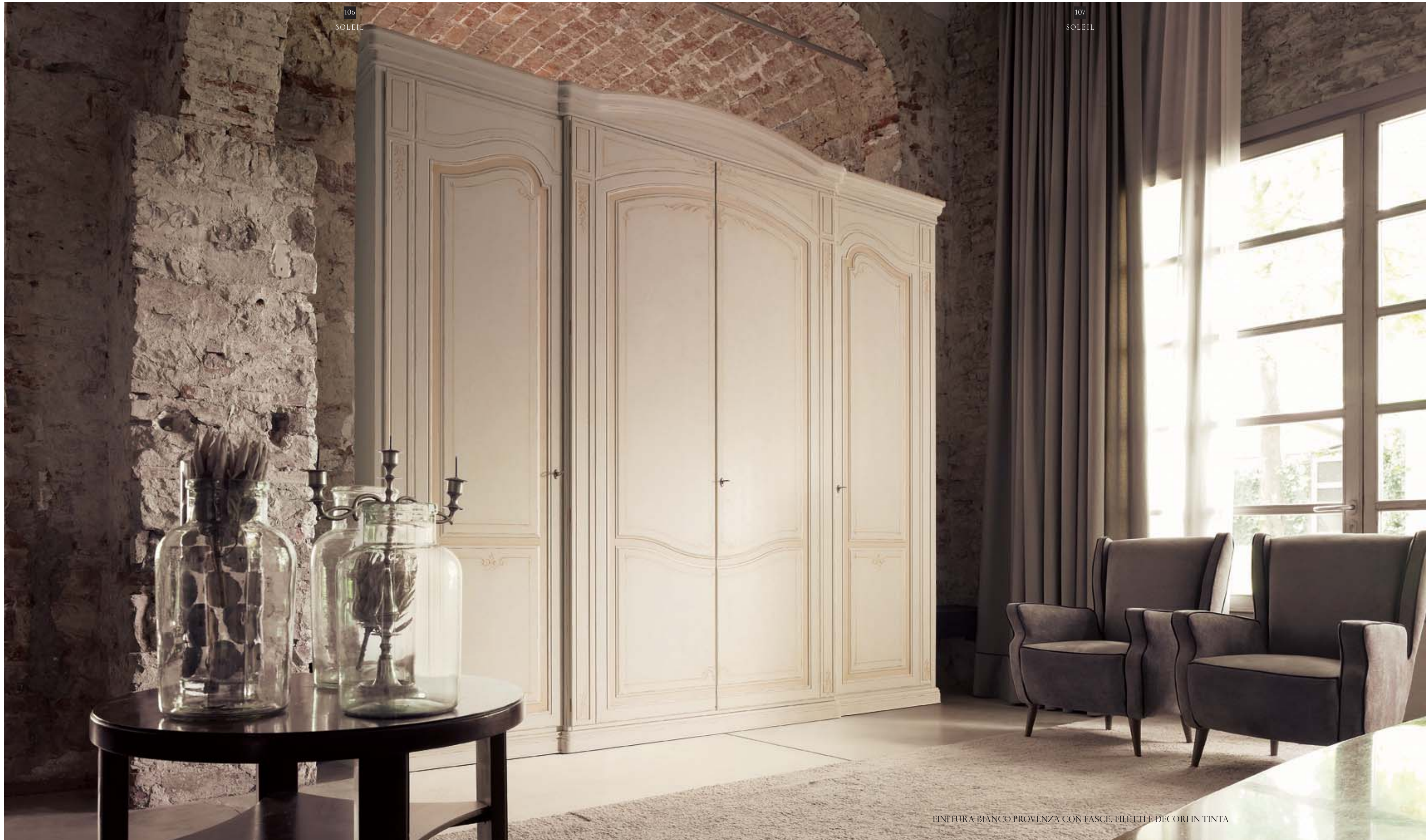
FINITURA BIANCO PROVENZA CON FASCE, FILETTE E DECORI IN TINTA