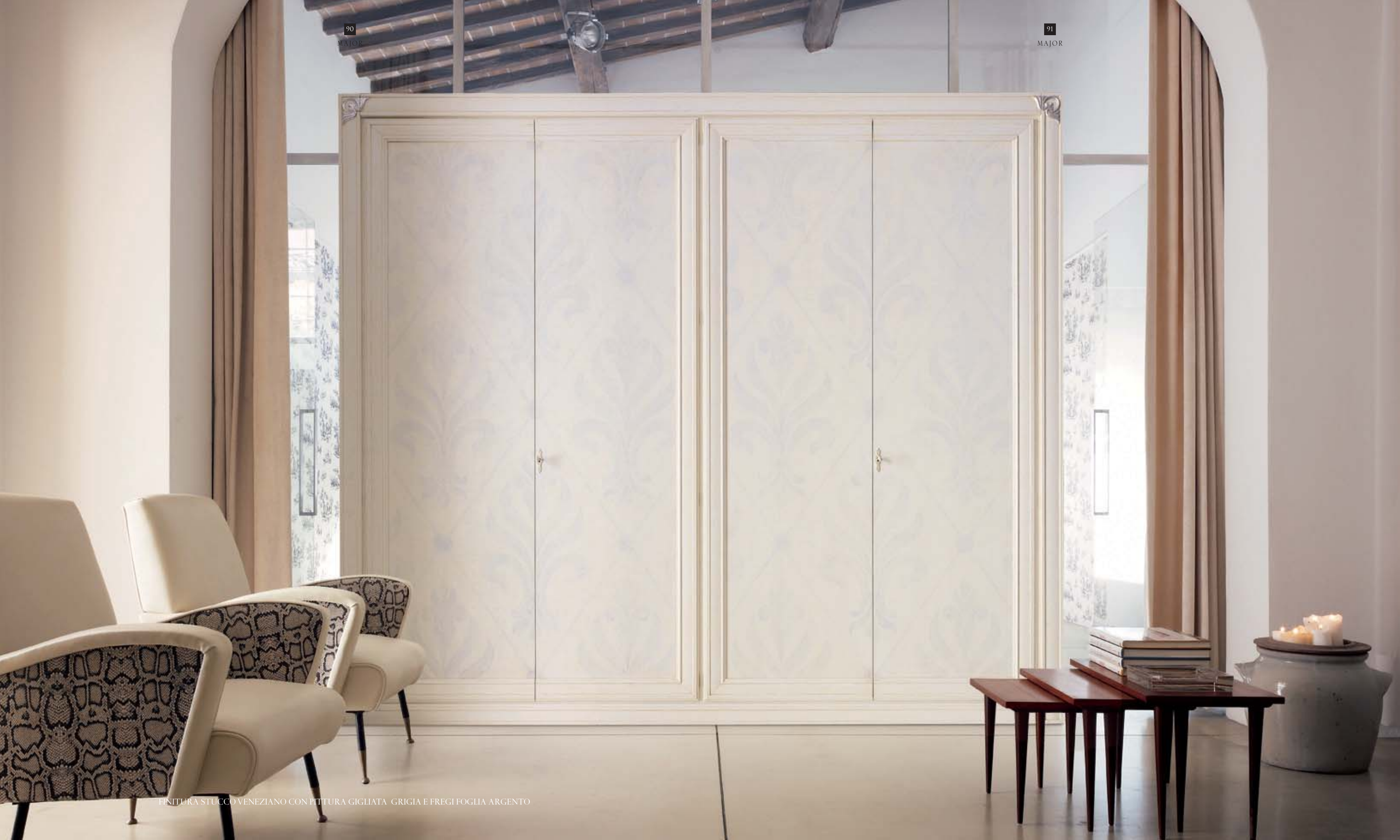
FINITURA STUCCO VENEZIANO CON PITTURA GIGLIATA GRIGIA E FREGI FOGLIA ARGENTO