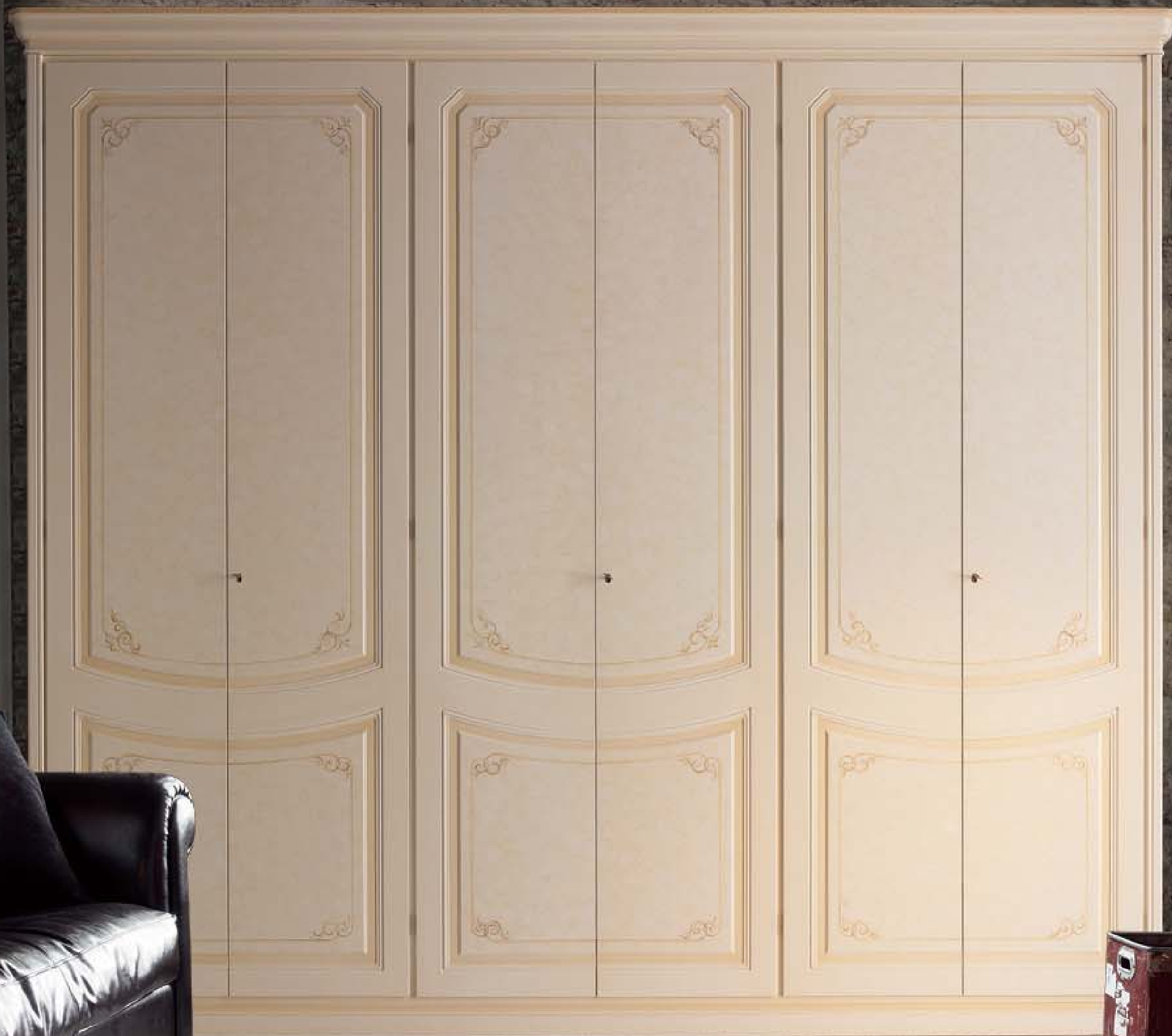
FINITURA PATINATO PESCA CON BOZZE TAMPONATE, FASCIA E FILETTI IN TINTA