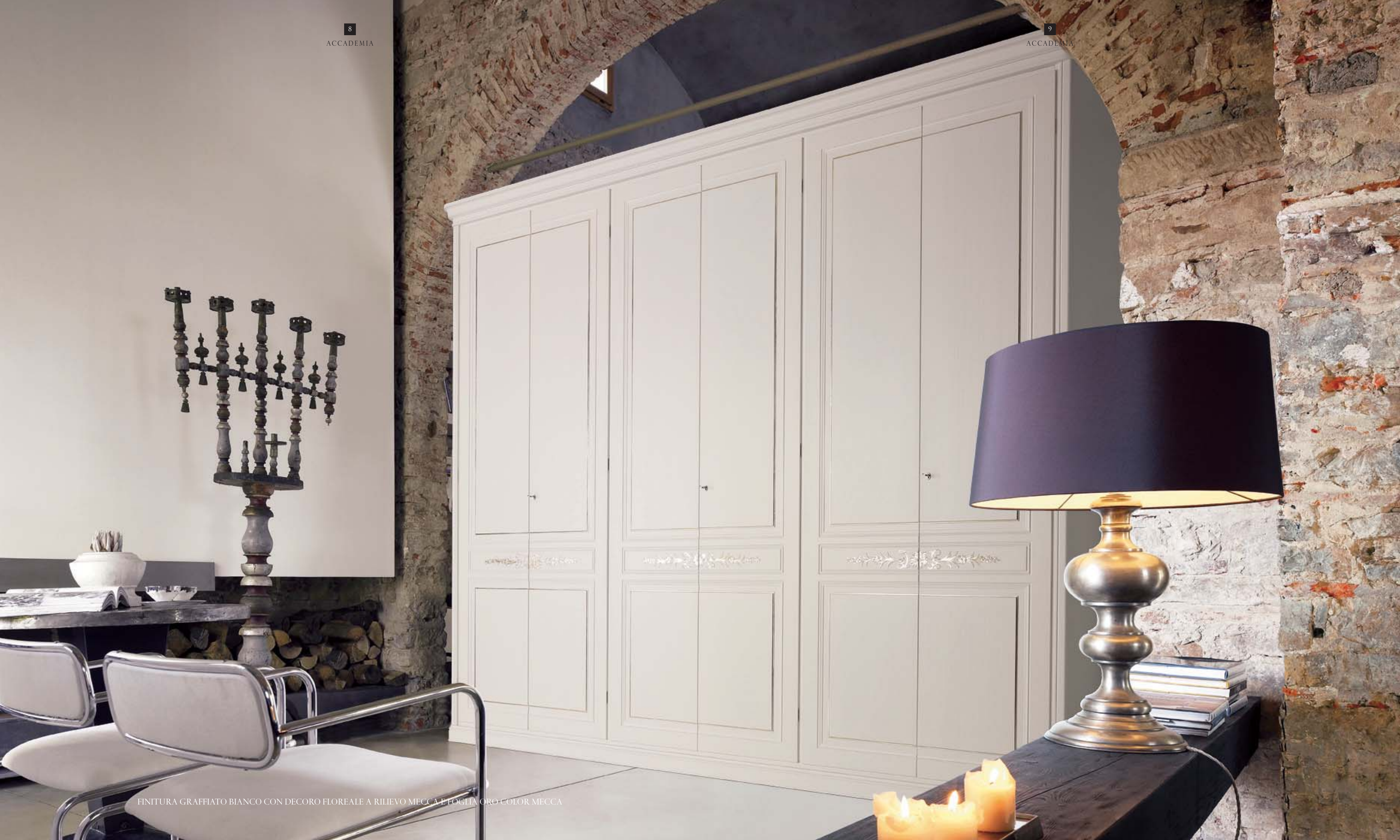
FINITURA GRAFFIATO BIANCO CON DECORO FLOREALE A RILIEVO MECCA E FOGLIA ORO COLOR MECCA