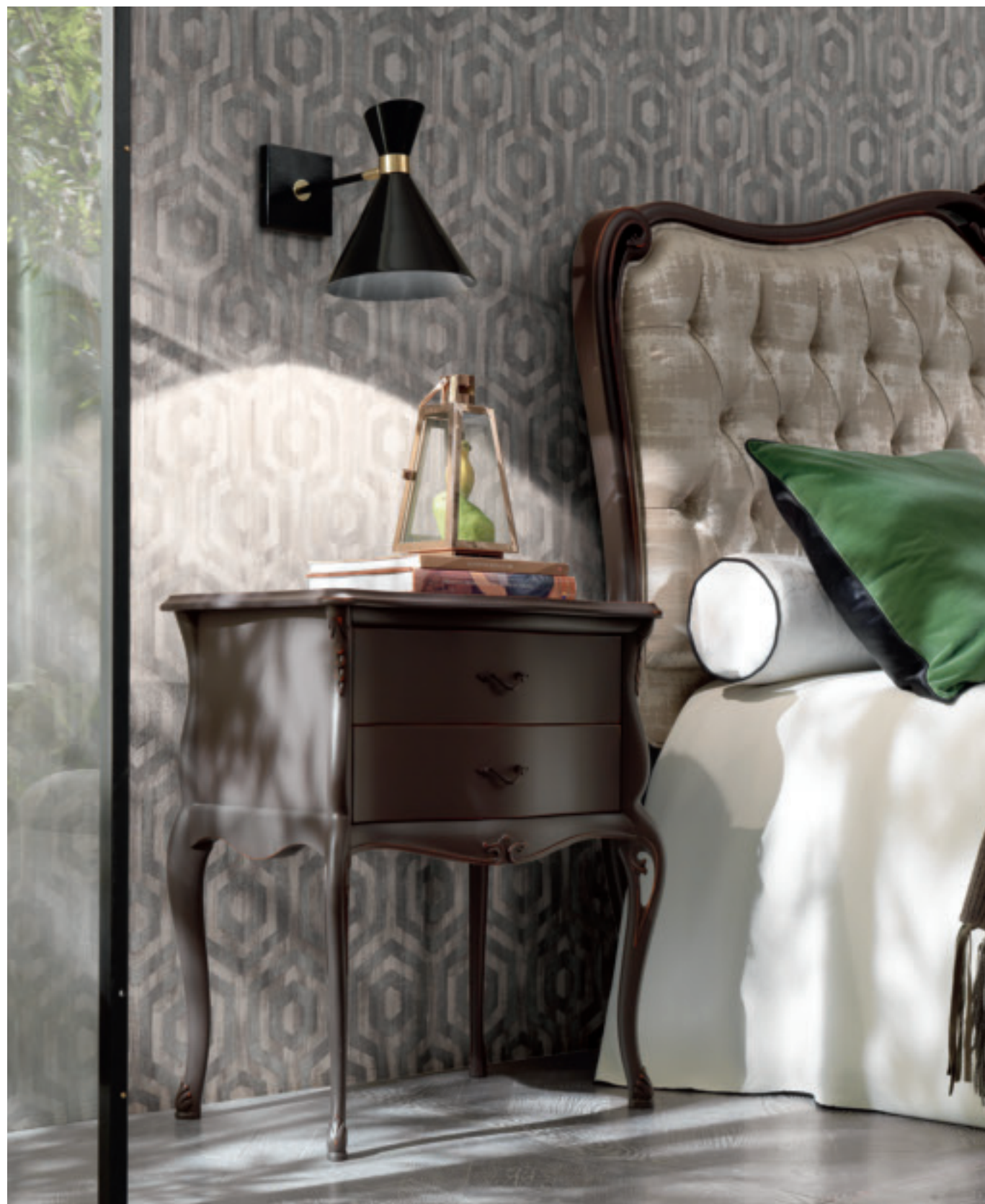
art. 1302 MOKA

Comodino 2 cassetti Night table 2 drawers L. 64 P. 43 H. 74