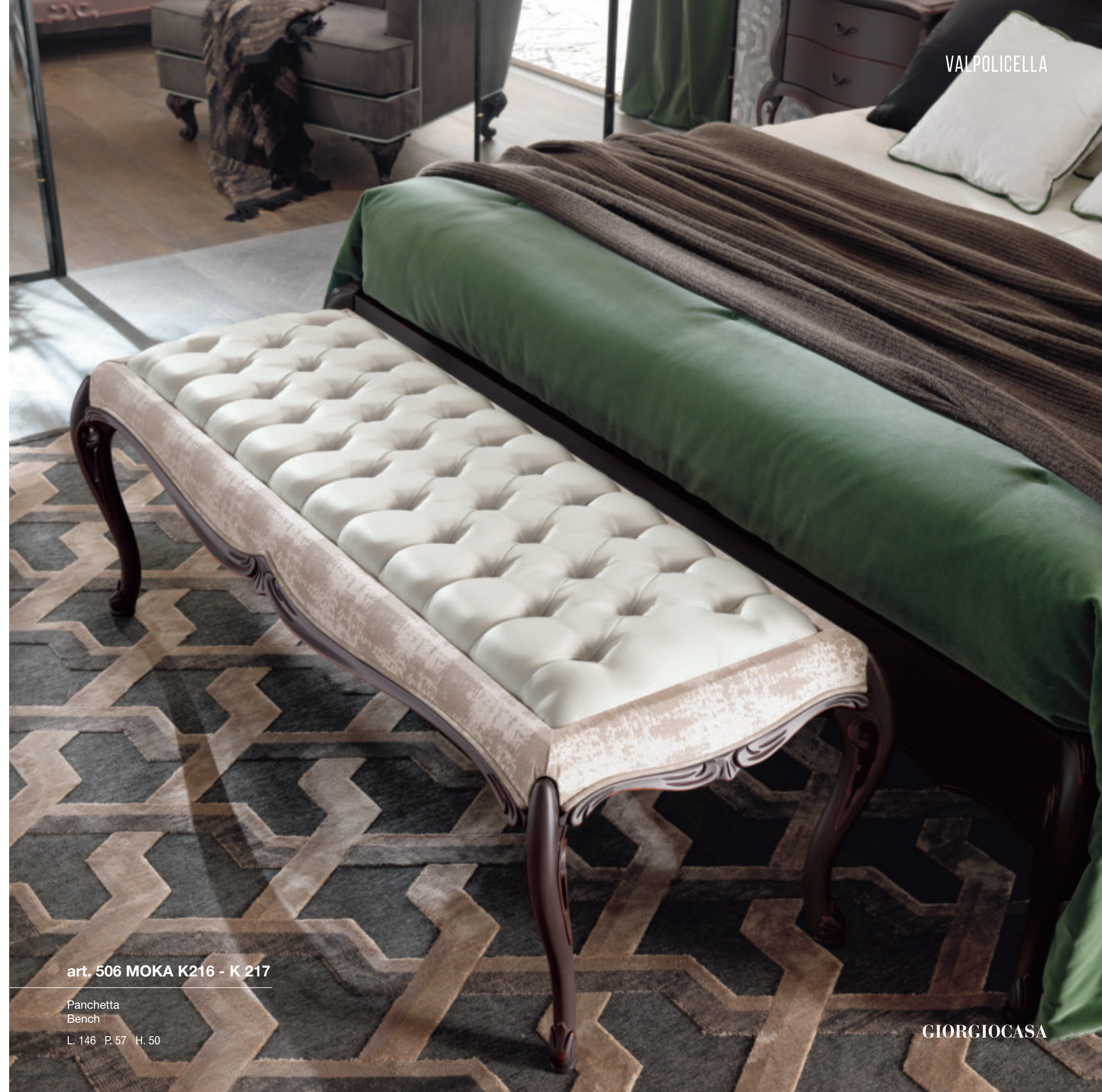
art. 506 MOKA K216 - K 217