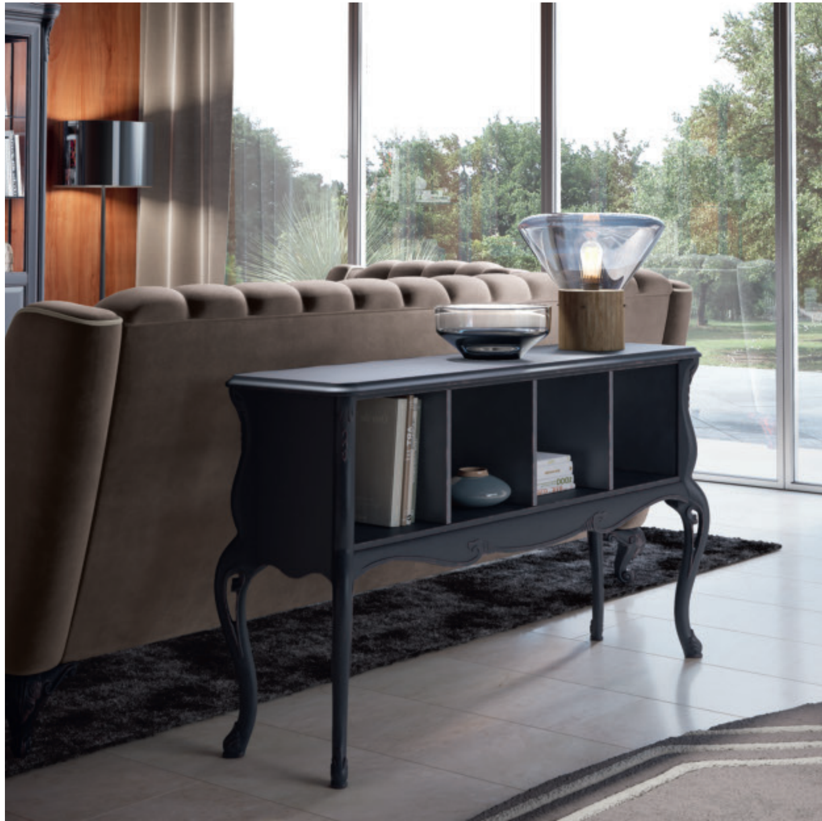
art. 1462 BLU

Consolle a giorno Console with open compartments L. 136 P. 38 H. 79