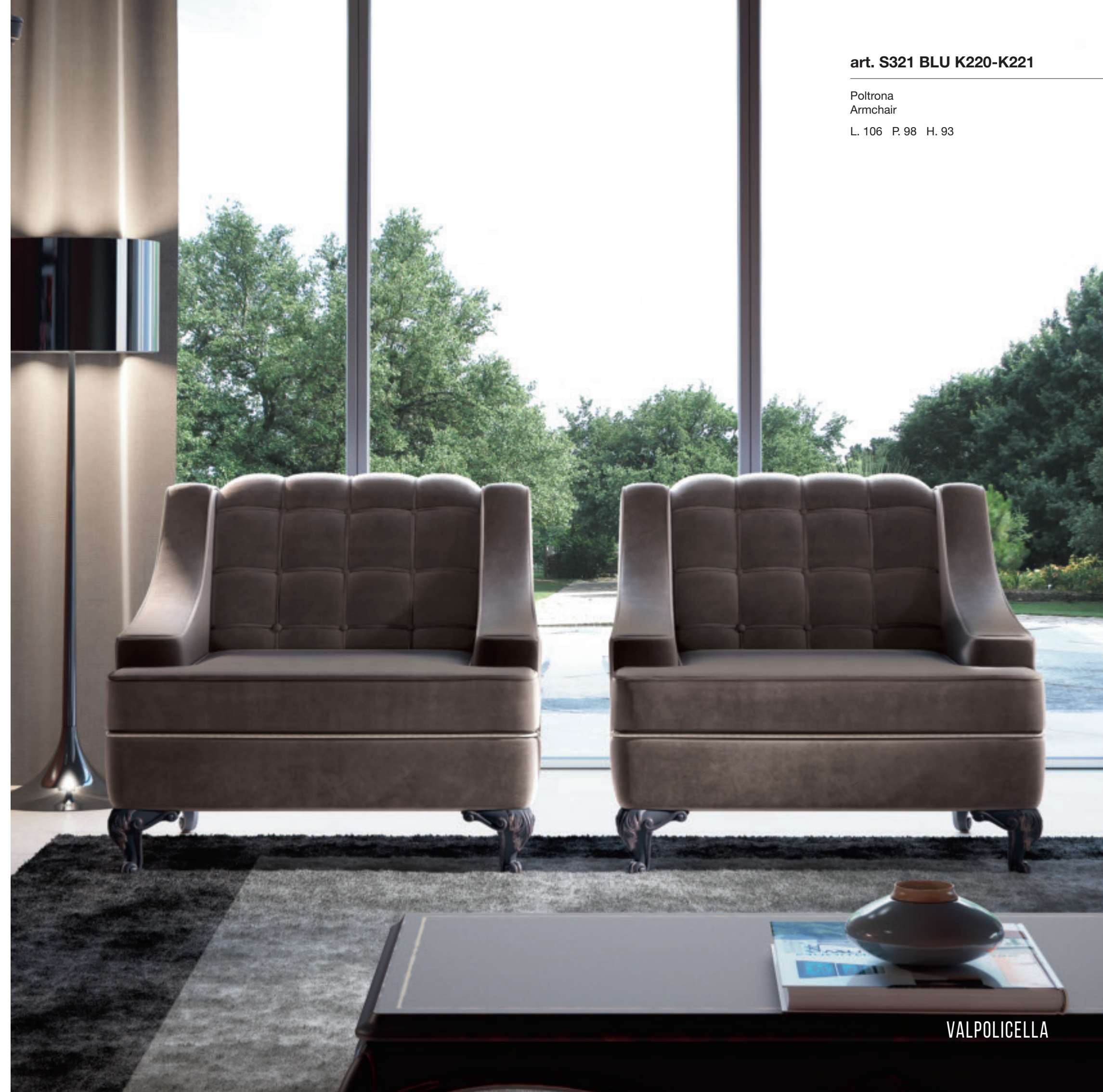
art. S321 BLU K220-K221

Consolle a giorno Console with open compartments L. 136 P. 38 H. 79