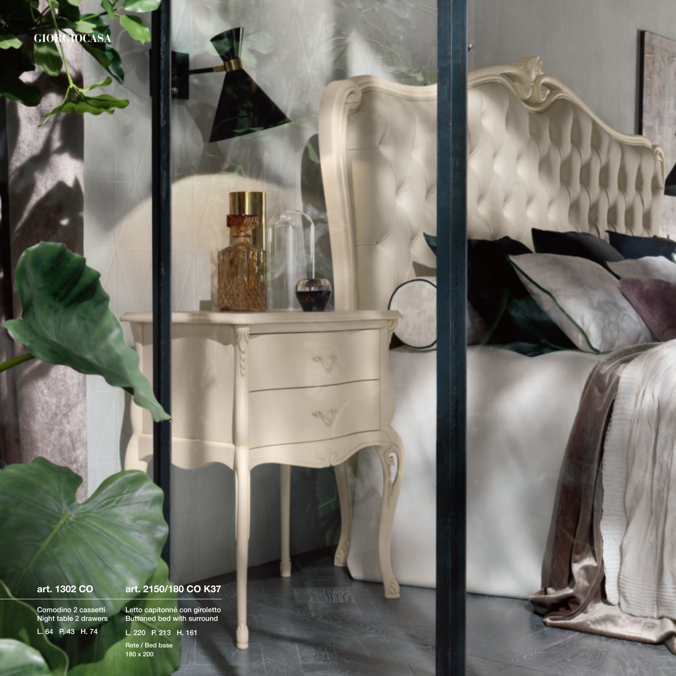
art. 1302 CO

Comodino 2 cassetti Night table 2 drawers