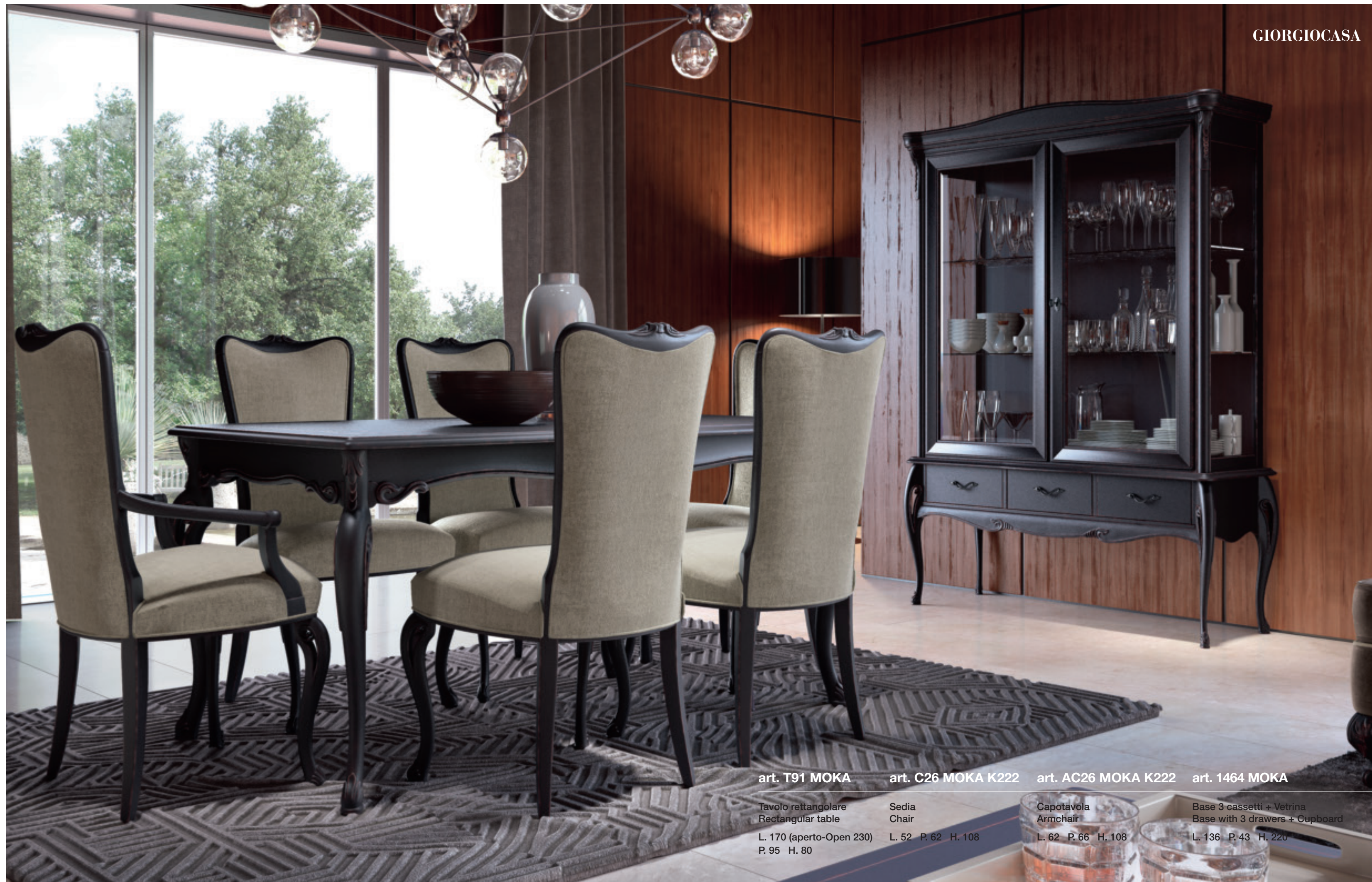
art. T91 MOKA

Tavolo rettangolare Rectangular table L. 170 (aperto-Open 230) P. 95 H. 80