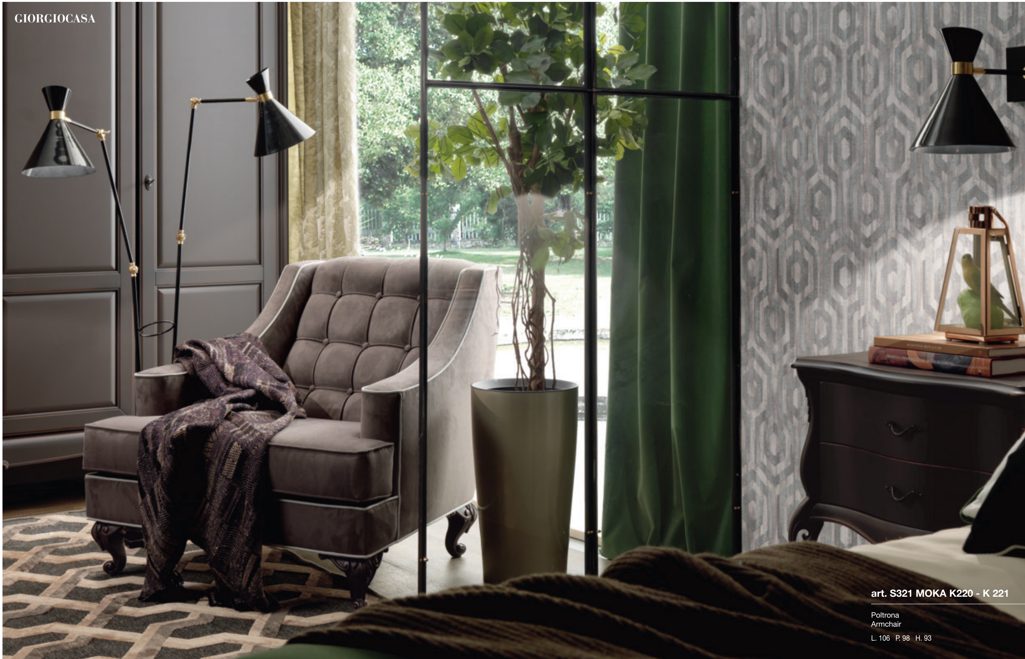
art. S321 MOKA K220 - K 221