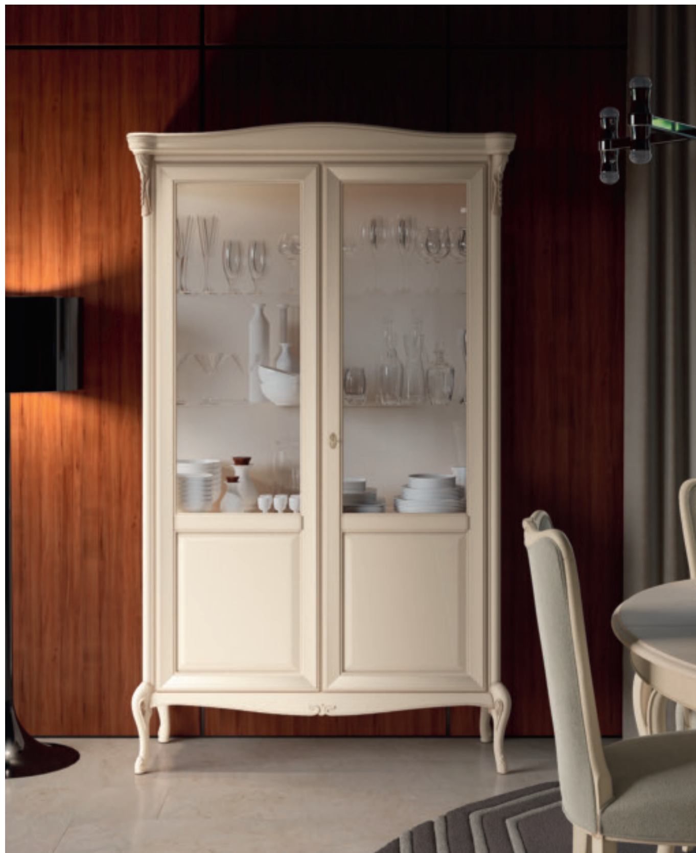
art. 1365 CO

Vetrina 2 ante 2 door cupboard L. 133 P. 48 H. 220