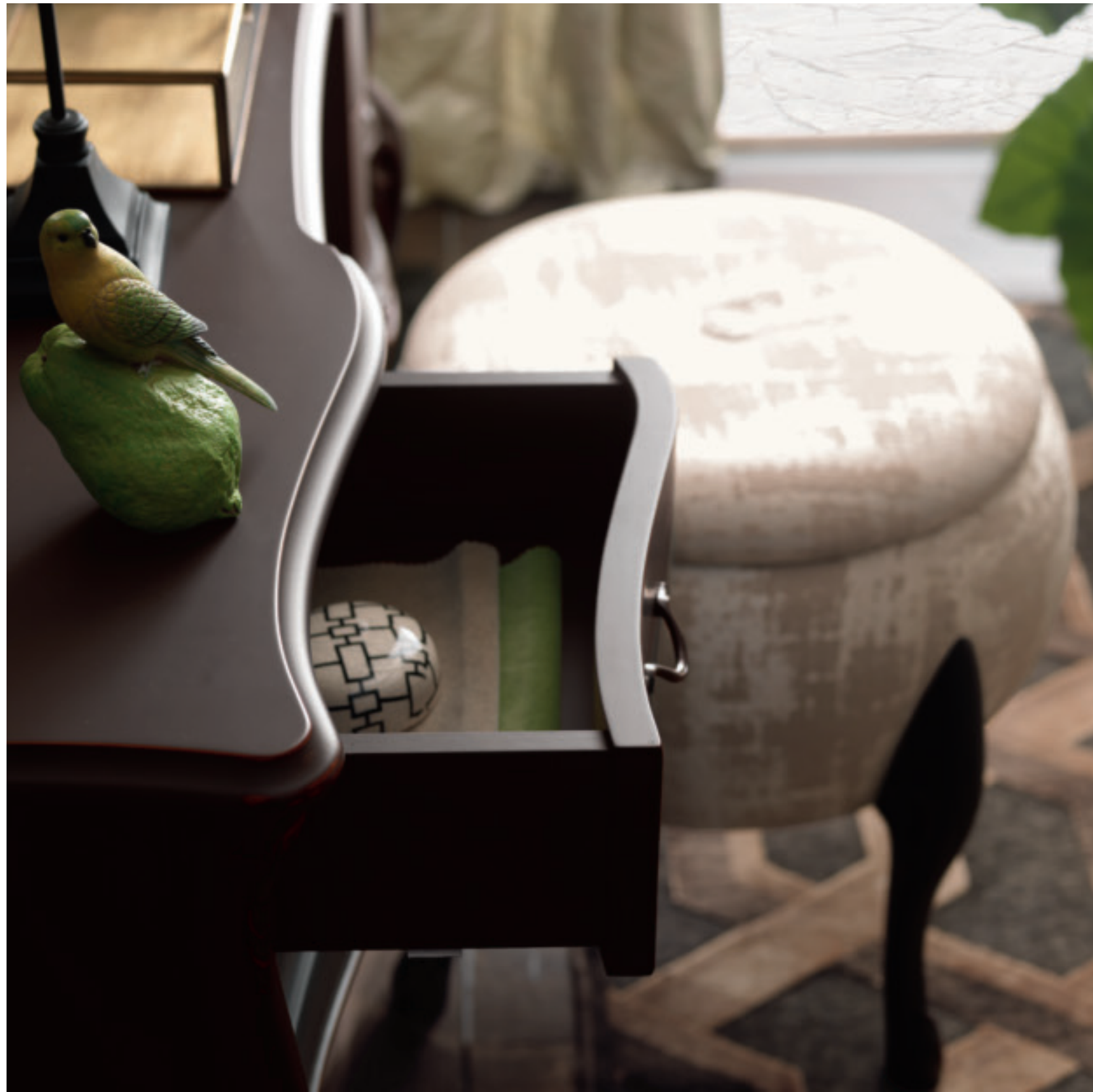
art. 1306 MOKA

Toilette 6 cassetti Dressing table with 6 drawers L. 138 P. 50 H. 135