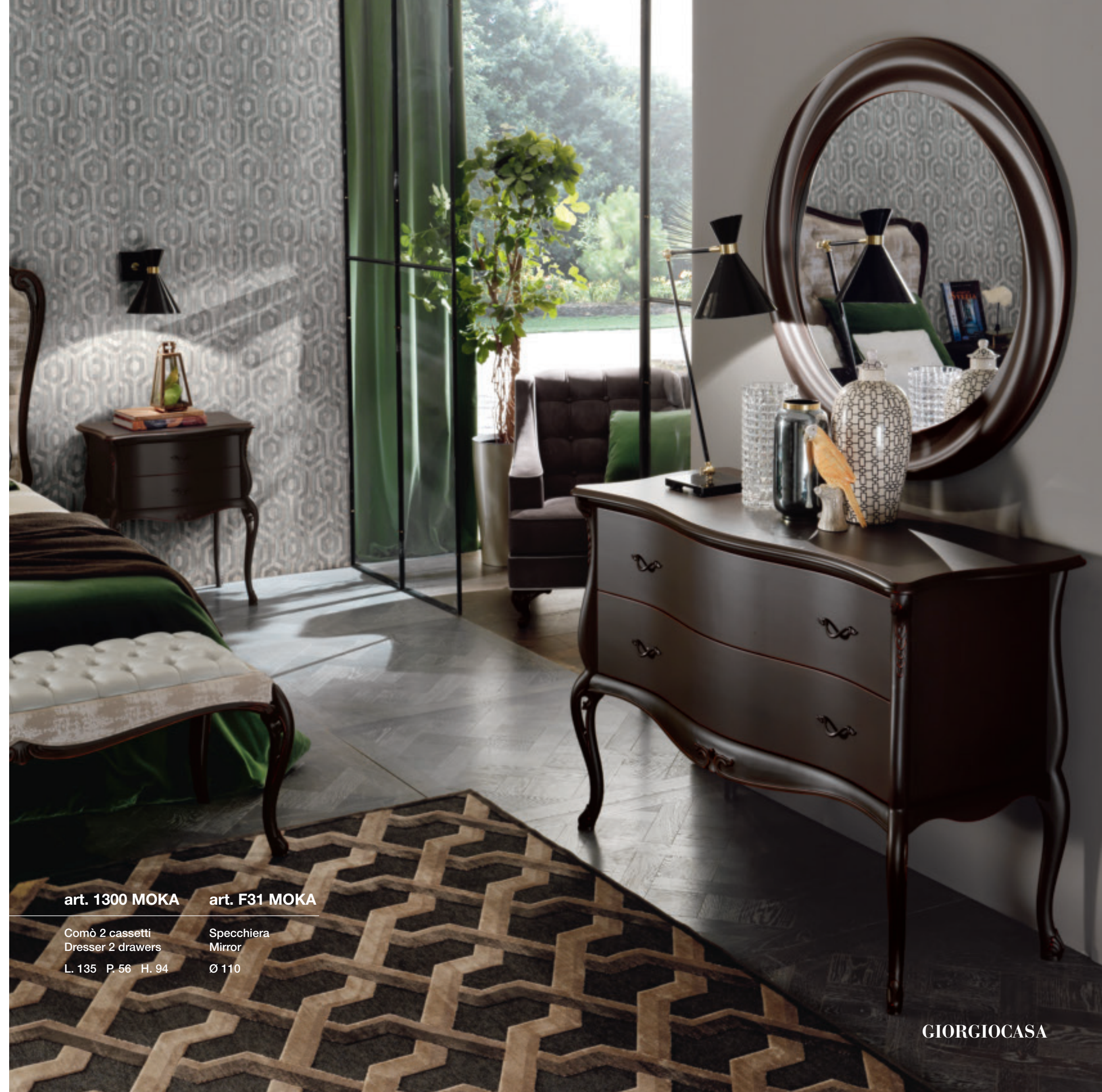
art. 1300 MOKA

Beauty is a pleasure to be savoured in relaxation, if with intensity. Our bedroom products are a first, ideal taste of the pleasures of the Valpolicella collection, with its simple but powerfully emotive design.