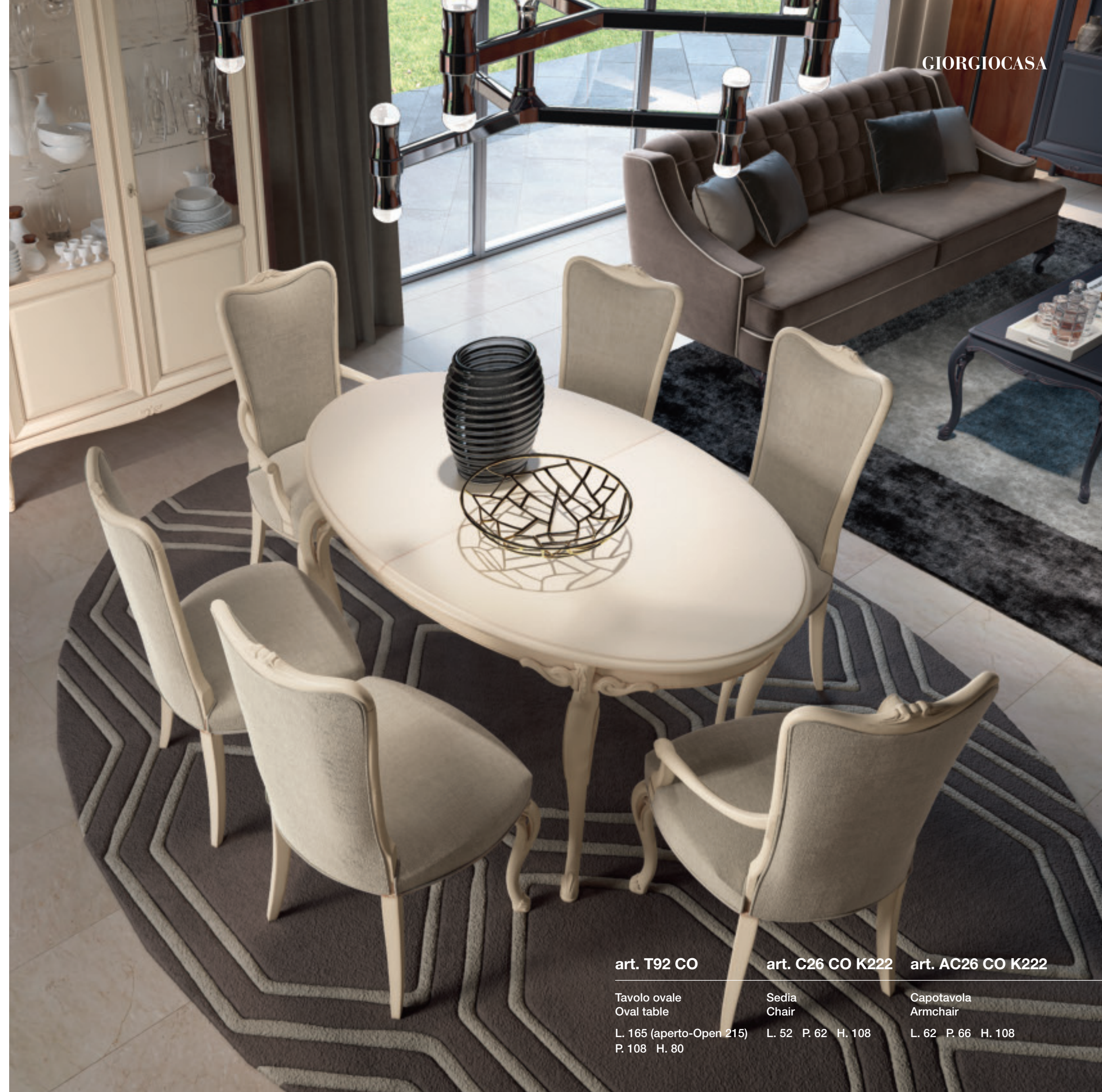
art. T92 CO

The Valpolicella drawing room is an experience to be had and a sight to be seen. The display cabinet both looks after and showcases your prized possessions. The table has extension leaves to take your welcome further. The chairs are the epitome of comfort, available with or without armrests.