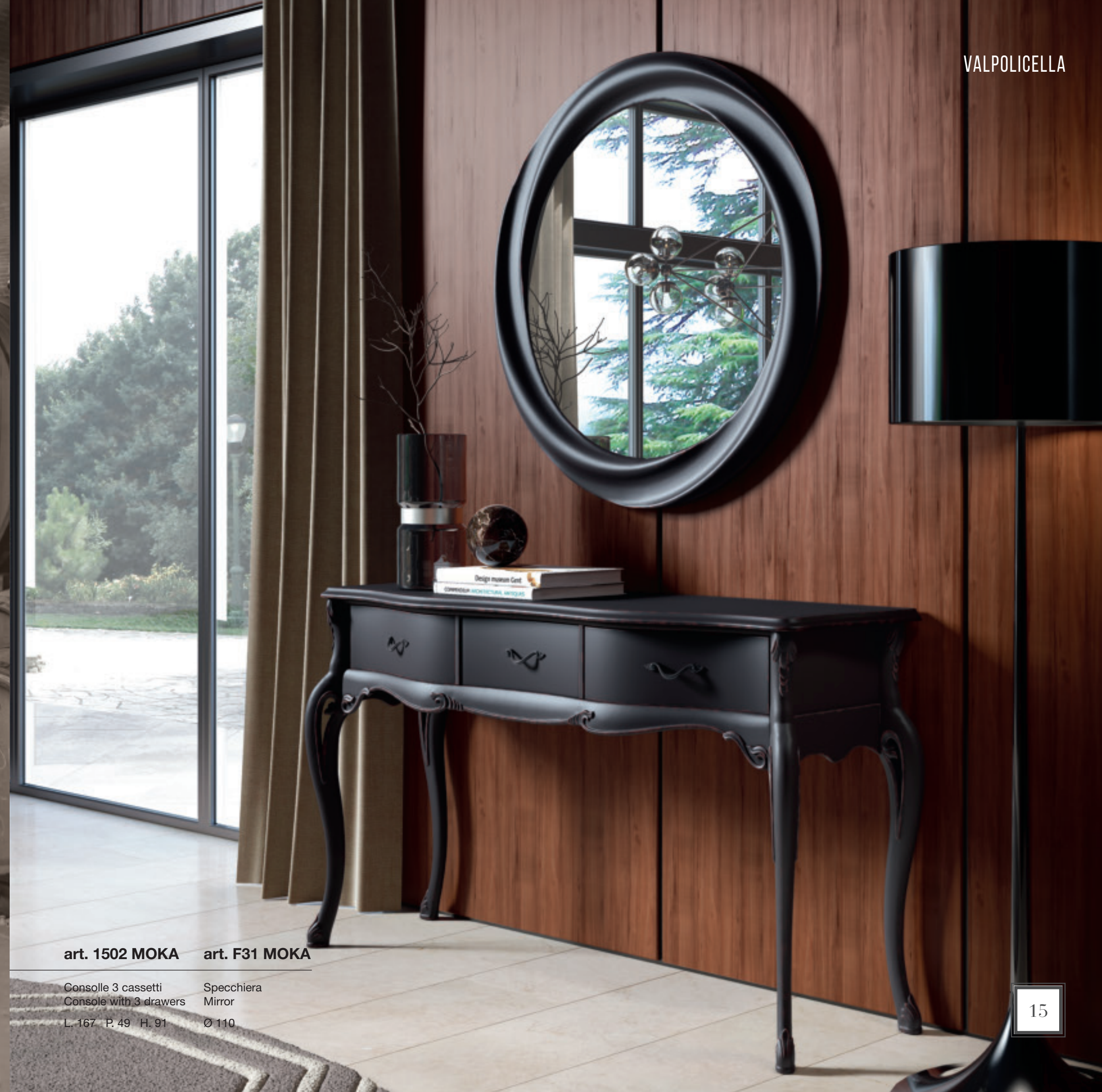
art. 1502 MOKA

Raffinatezza e calore Refinement and warmth