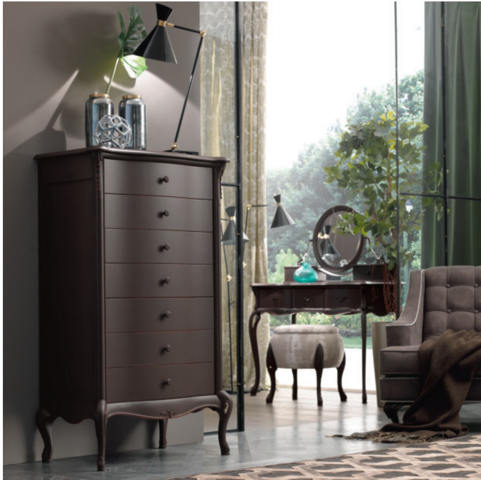
art. 1307 MOKA

Cassettiera 7 cassetti Drawers unit with 7 drawers L. 83 P. 49 H. 140