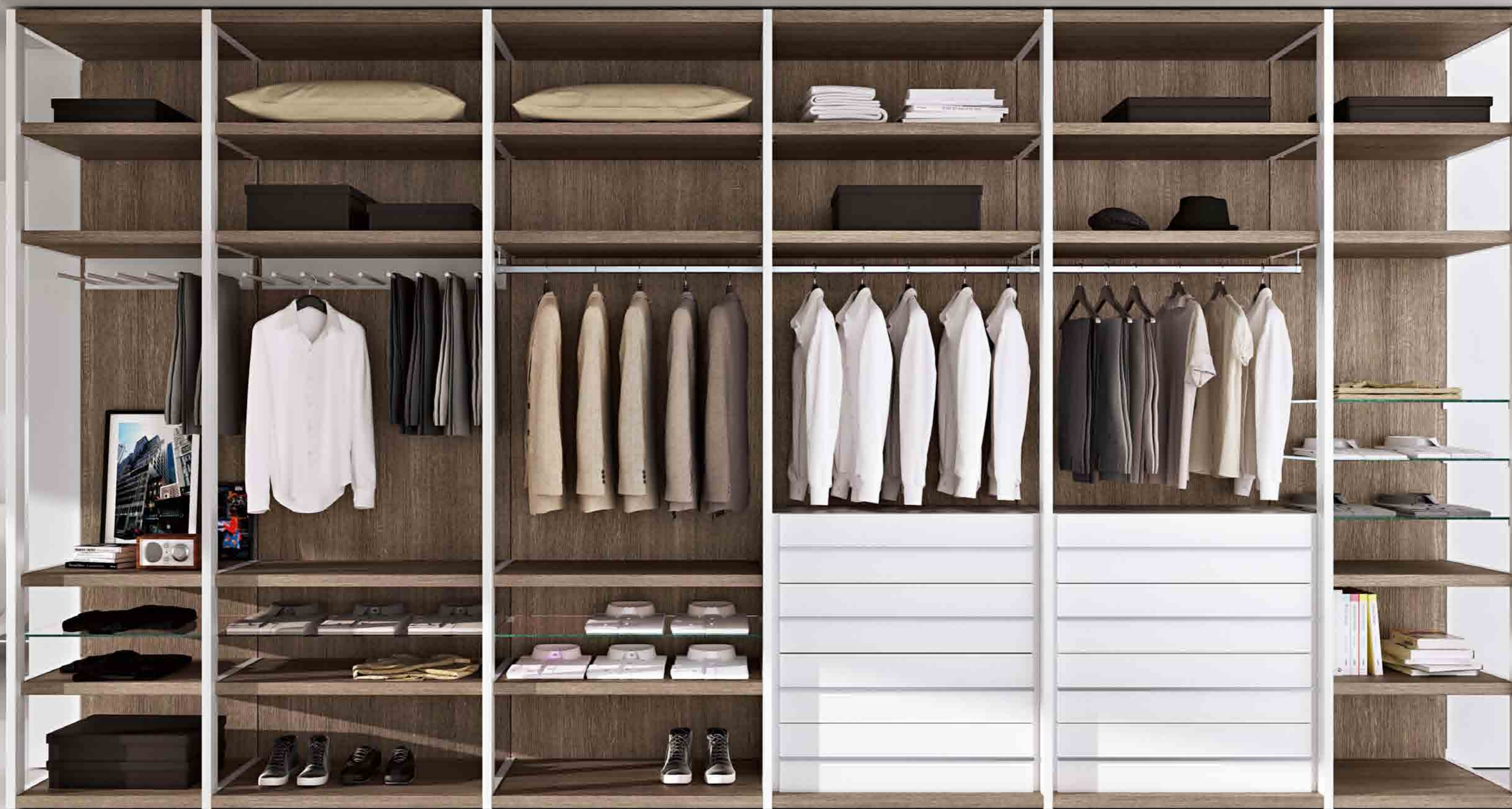
Cabina in nobilitato rovere barique, cassettiere bianco opaco. Componenti alluminio verniciati bianco opaco.