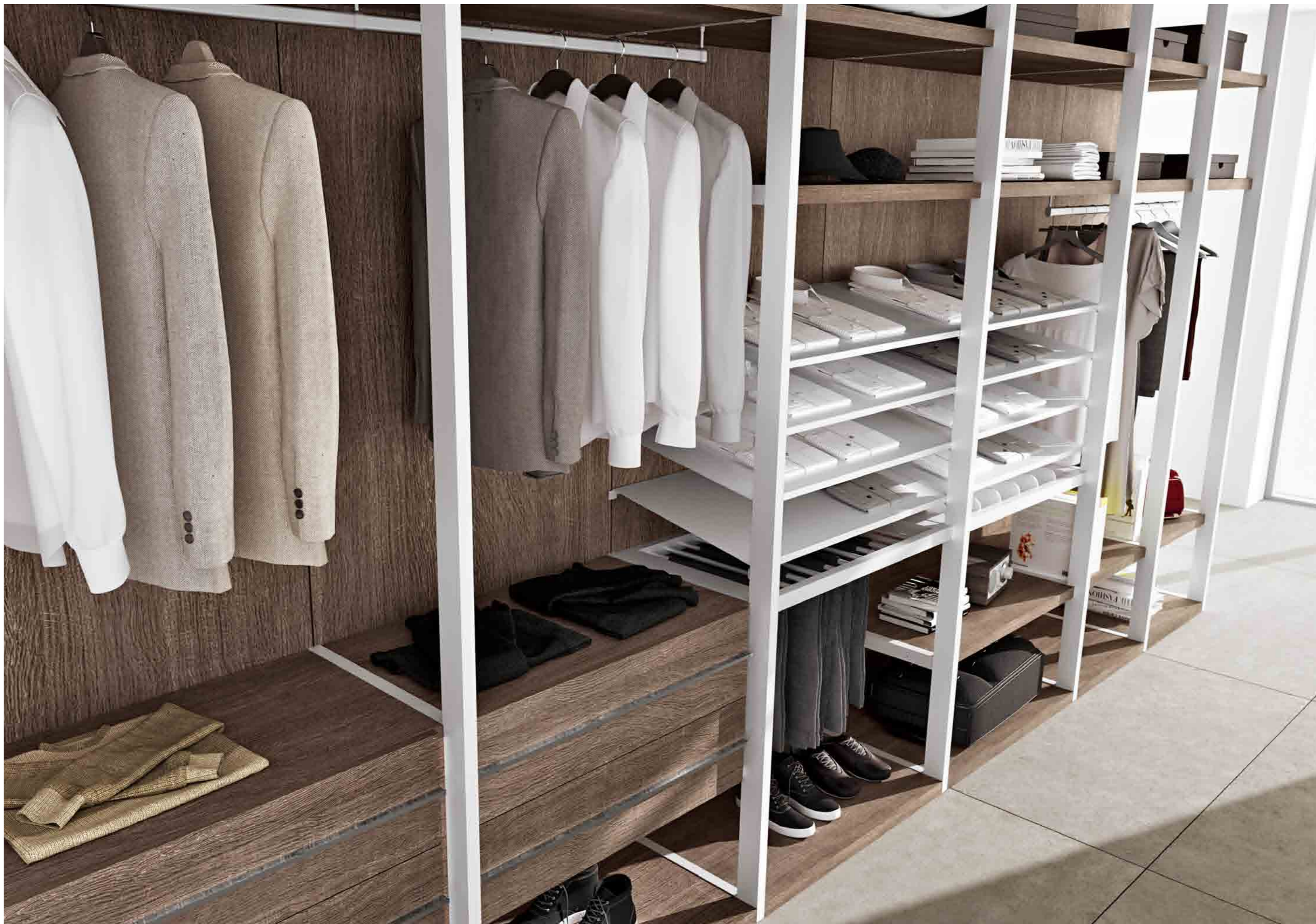
Cabina in nobilitato rovere barrique, cassettiere ed estraibili bianco opaco. Componenti alluminio e portacamicie in lamiera verniciata bianco opaco.