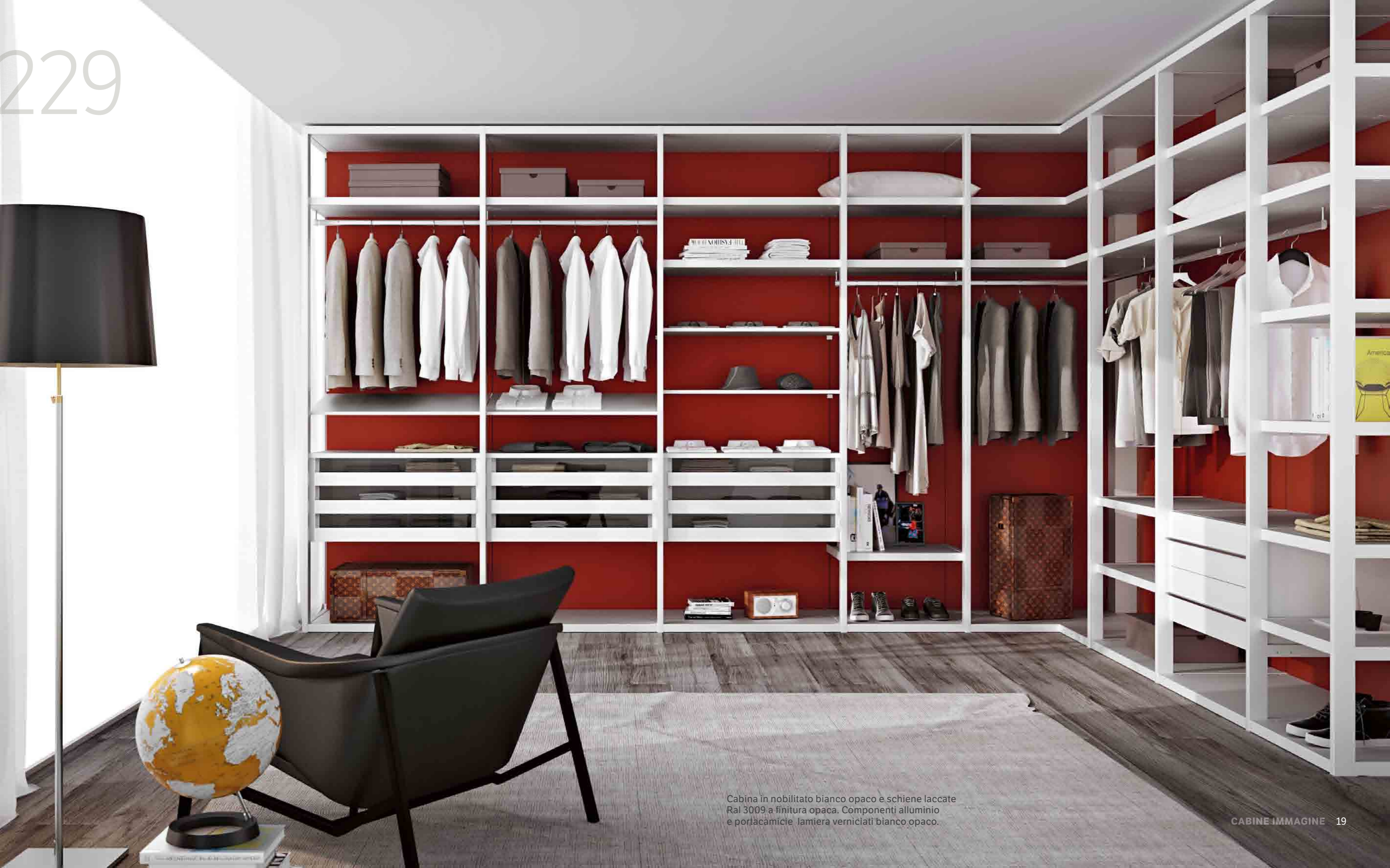
Cabina in nobilitato bianco opaco e schiene laccate Ral 3009 a finitura opaca. Componenti alluminio e portacamicie lamiera verniciati bianco opaco.